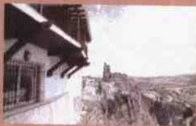
阿尔克斯 - 德拉弗龙特拉 Alcos de la Frontera