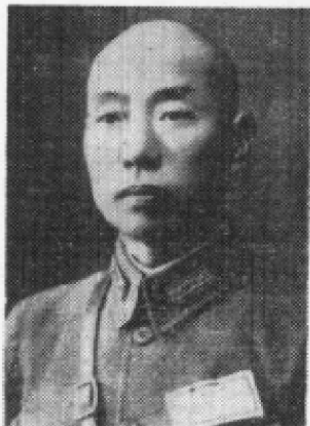
二十一军第一四五师师长 饶国华