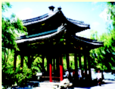
☒ 颐和园内的知春亭是整个园林最好的观景地点之一。

玉峰宝塔；立在青山之上，北可见佛香阁掩映在翠柏之间。远山近水，诗情画意，使人神清气爽、暑意顿消。湖面上设有汽艇、画舫，游客可乘坐环湖游览。条条小船，载着游客划桨而行，桥、岛、殿、阁倒映水中，湖面上生机勃勃，好一幅壮丽的画面。