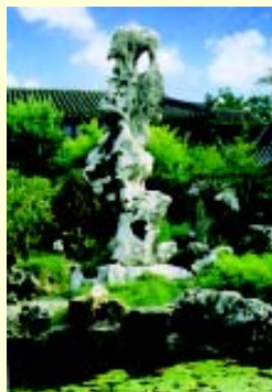
狮子林假山上的石头是搜集北宋“花石纲”的遗物，均玲珑俊秀。