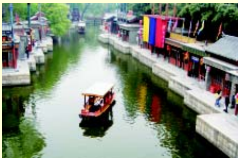
颐和园苏州街是一条修建在皇家园林内的模拟商业街,专供清朝帝后妃嫔们不出宫而能享逛市之娱。全长300多米,一水两街,沿岸作市,是我国古代“宫市”的唯一孤本。

同时,颐和园作为清代政治活动的重要场所,记录和保存了皇宫贵族们生活的许多史实,为我们了解和考察帝王们的生活提供了大量真实的素材。颐和园的几次兴废和遗存的大量宝贵物件,记录了清王朝从康乾盛世到列强入侵、国力由强盛到衰弱的痕迹,也是我国人民饱受帝国主义欺凌的佐证。