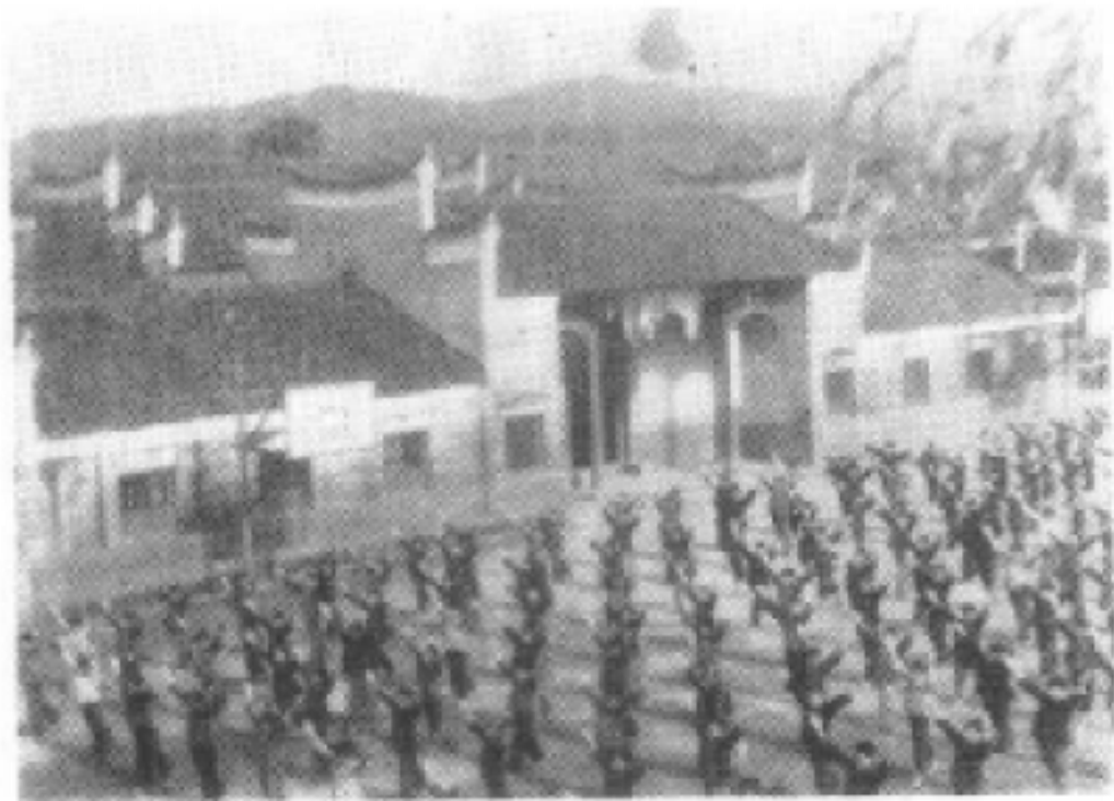
列宁高级小学旧址