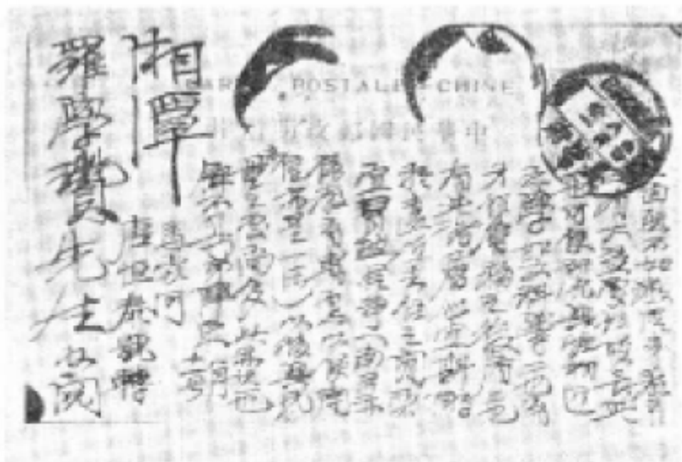
这是去北京留法预备班前毛泽东同志给罗学瓚同志的信（一九一八）