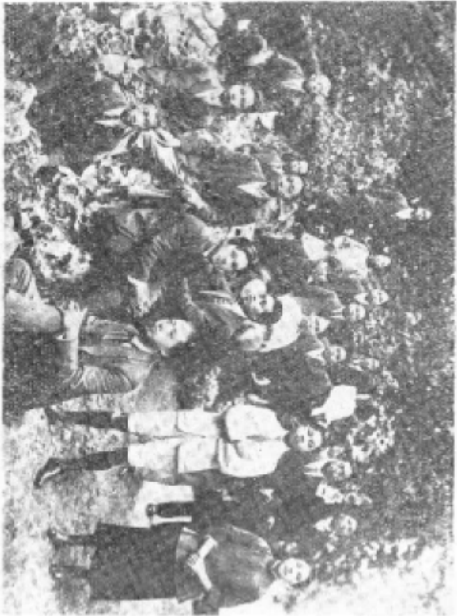
罗学瓚与蔡和森、向警予、李维汉、蔡畅、张星弟等同志 在法国蒙达尼会议时集体合影