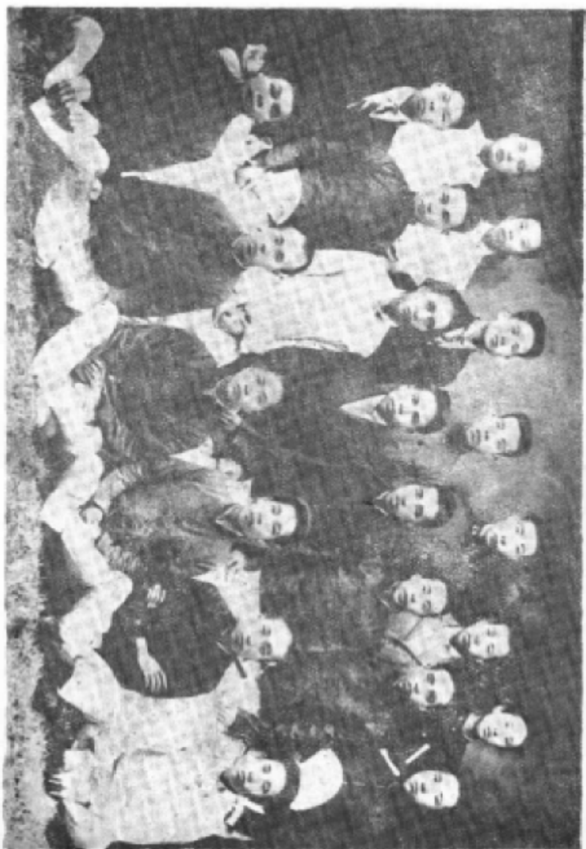
一九一八年湖南一师湘潭校友会集体合影 中排左起第三人毛泽东同志 第四人罗学瓚同志