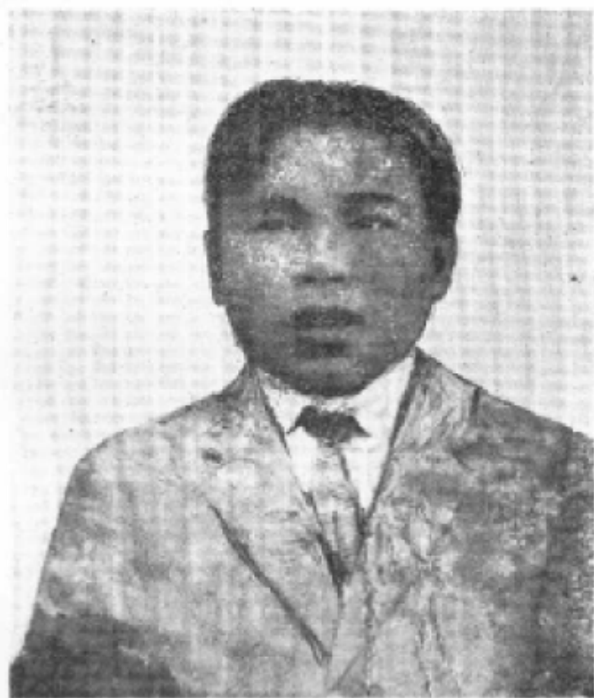
罗学璜同志 一九二〇年摄于法国蒙达尼