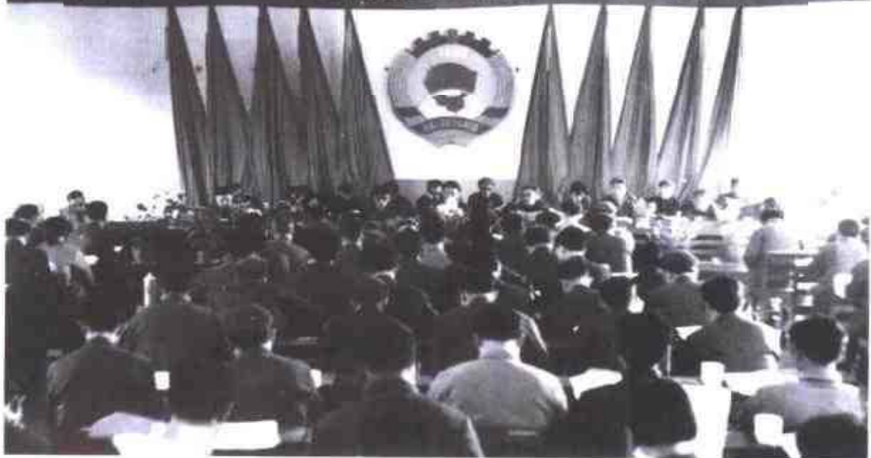
1980年11月29日，政协株洲市第一届委员会胜利召开。上图为《株洲日报》报道，下图为大会会场。