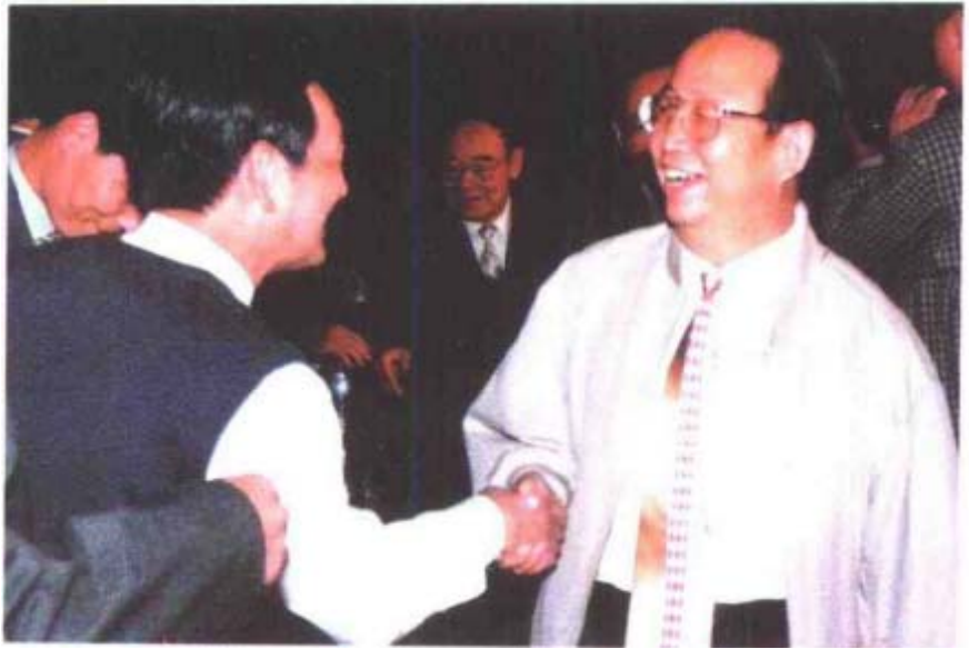
1997年10月中共湖南省委副书记、 省人民政府省长杨正午在株洲亲切接见 市政协委员。