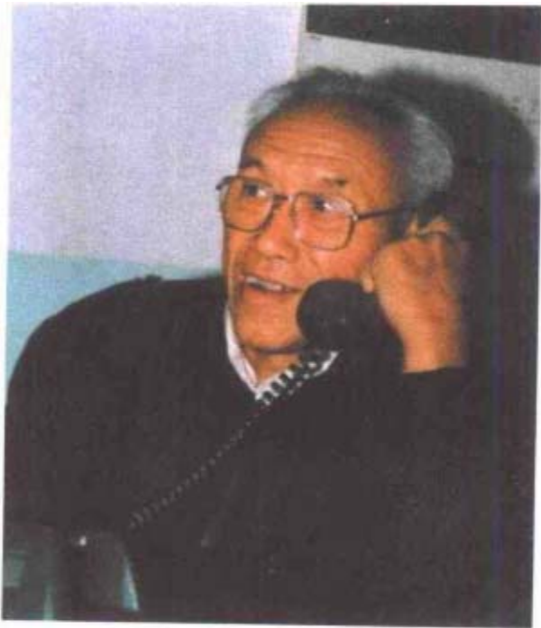
第一届政协主席郁宝云