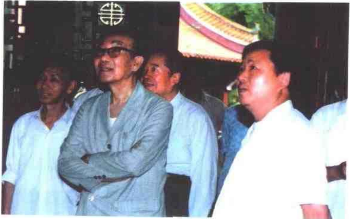
1991年6月，全国政协副主席王任重（左二）来株洲视察，株洲市委副书记、市政协主席程兴汉陪同王任重同志一行考察炎帝陵。