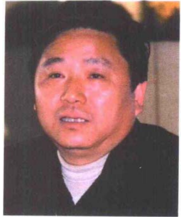
第三届政协主席程兴汉