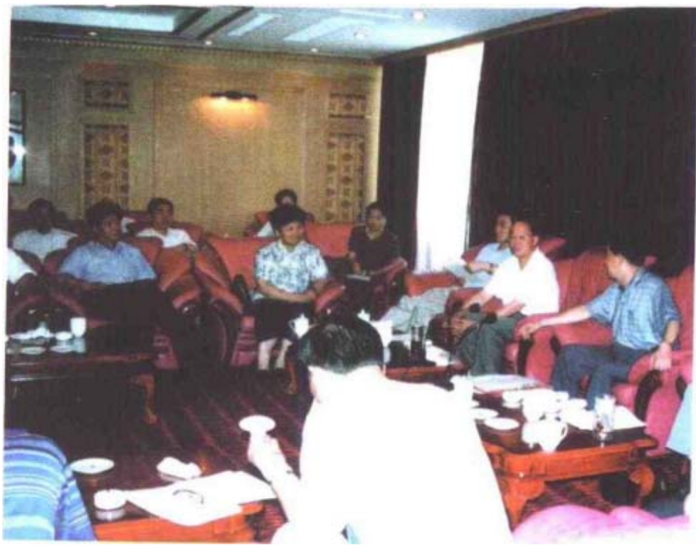
2000年6月27日，市委书记王汀明和市政协领导一起看望来株洲视察的省政协主席刘夫生一行，并汇报工作。（文史办供稿）