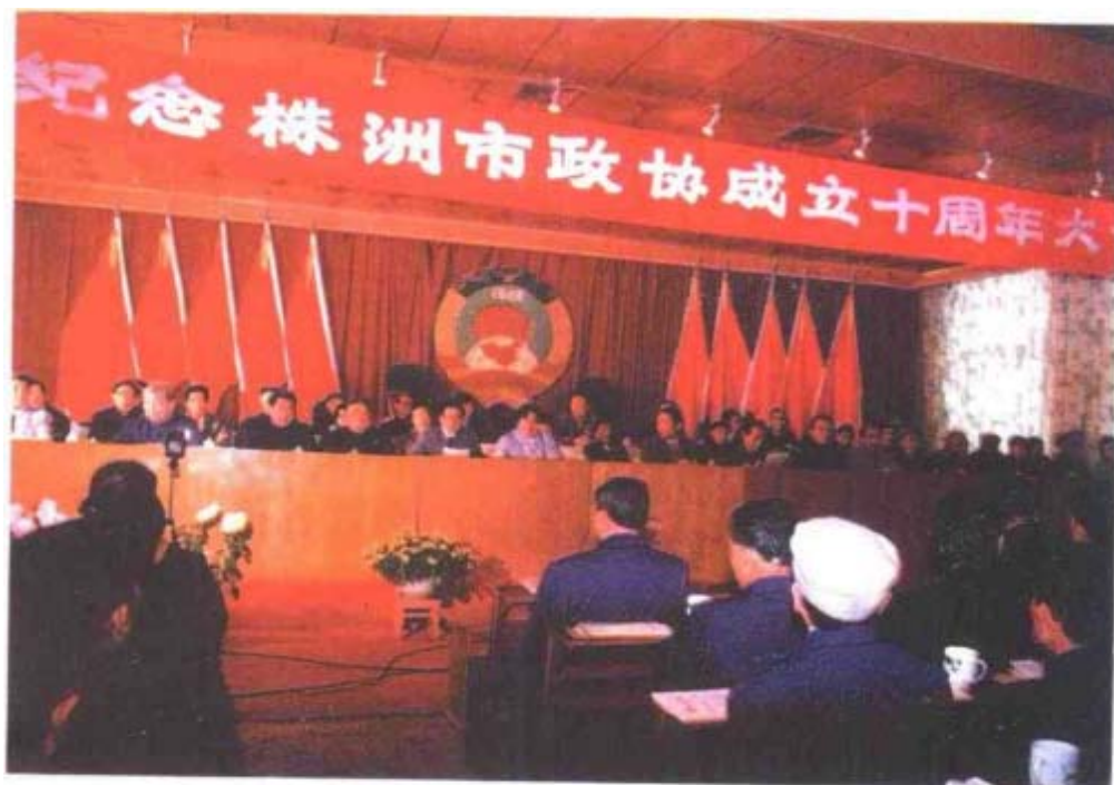
1990年12月，纪念株洲市政协成立十周年大会会场。