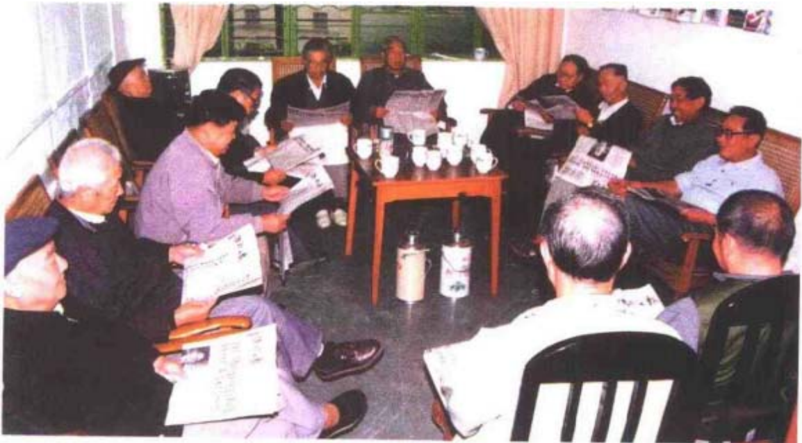
市政协老领导参加学习