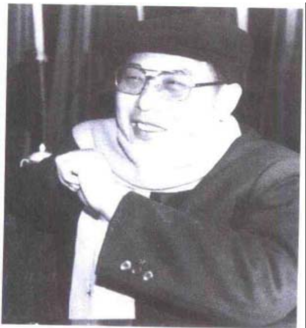
第三届政协主席陈满之 (冉济兵供稿)