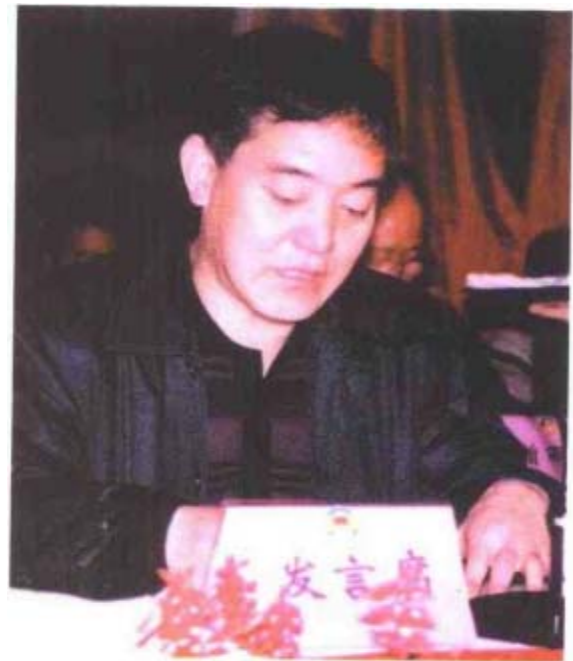
第五届政协主席赵占一