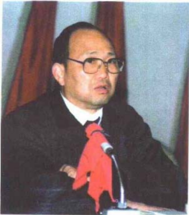
第四届政协主席曾雨农 文史办供稿：