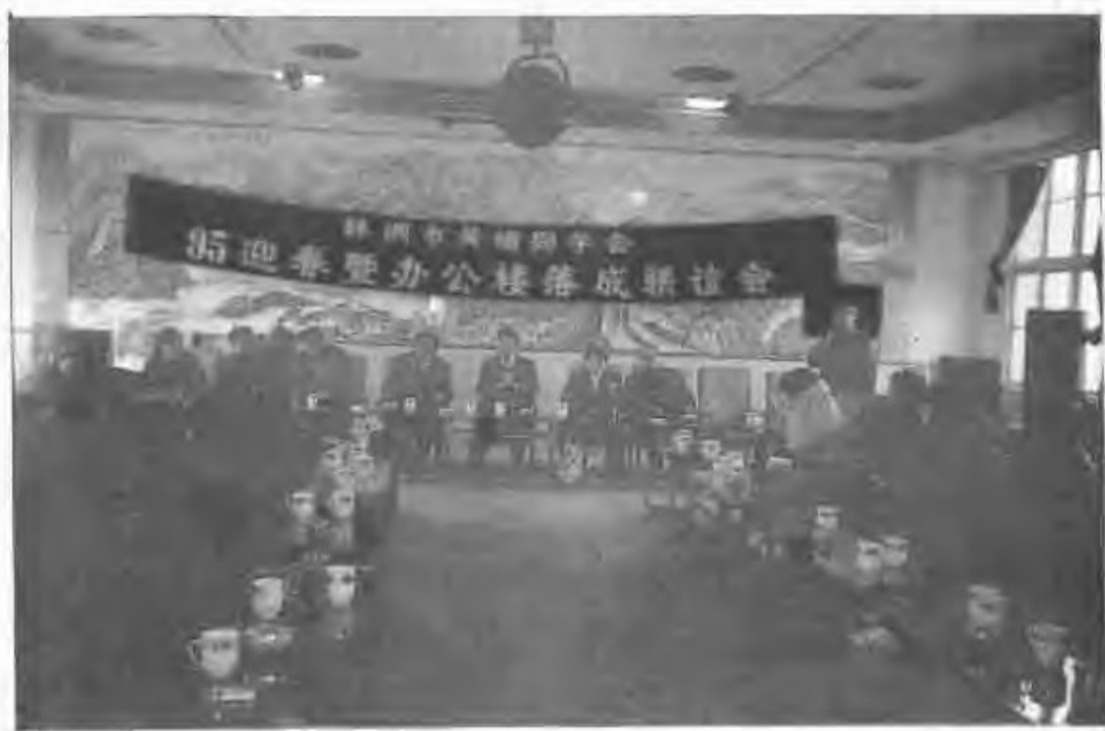
▲1995年春,市黄埔军校同学会举行办公楼落成联谊会,图为大会会场。