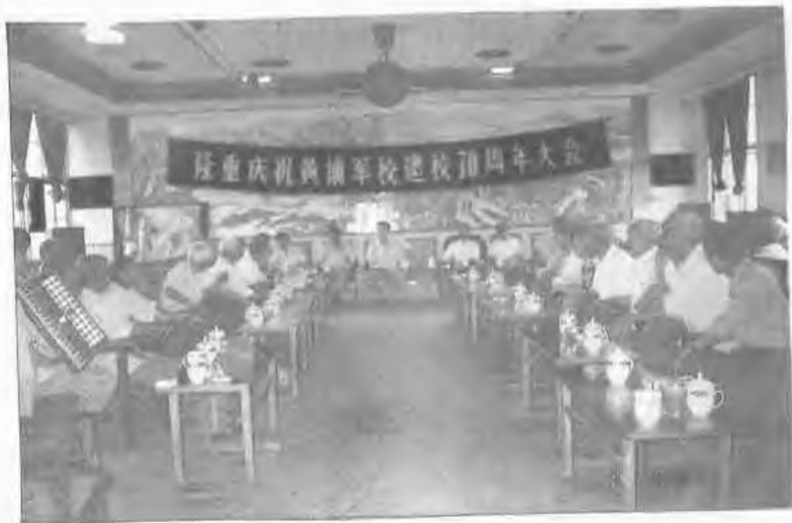
▲1994年6月，株洲市黄埔军校同学会庆祝黄埔军校建校70周年大会会场。