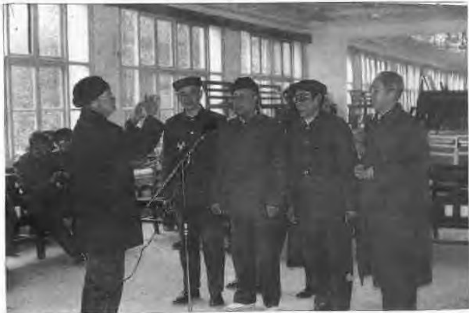
▲市黄埔军校同学会经常组织同学开展文娱活动，图为同学分组唱校歌。