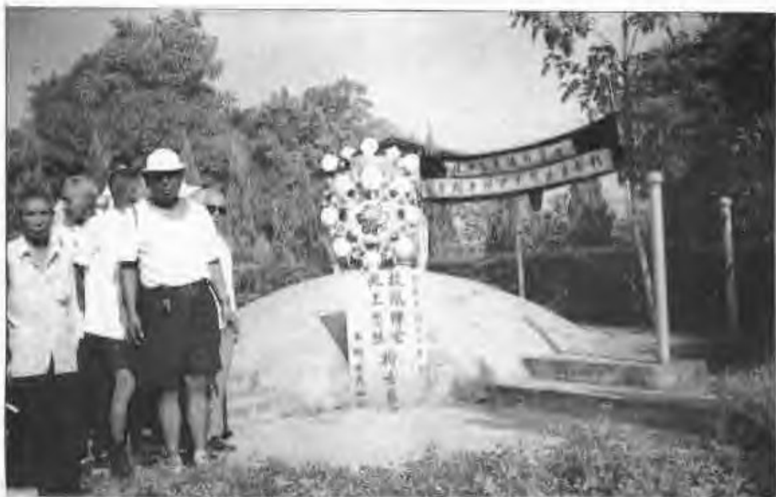
▲1995年8月,市黄埔军校同学会在纪念抗日战争胜利50周年前夕,组织同学在市流芳园抗战阵亡将士墓前敬献花圈。