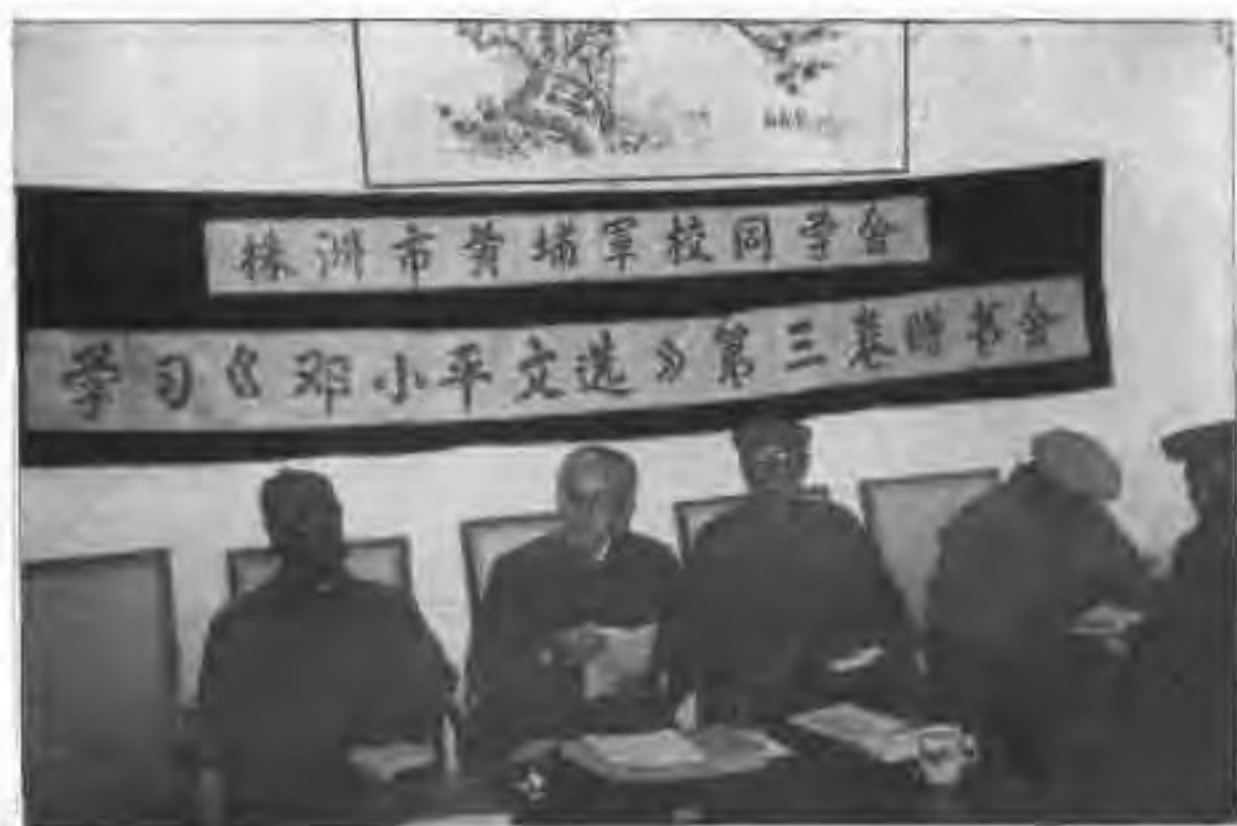
◀1993年12月,市黄埔军校同学会举行《邓小平文选》赠书仪式暨组织同学学习会会场。