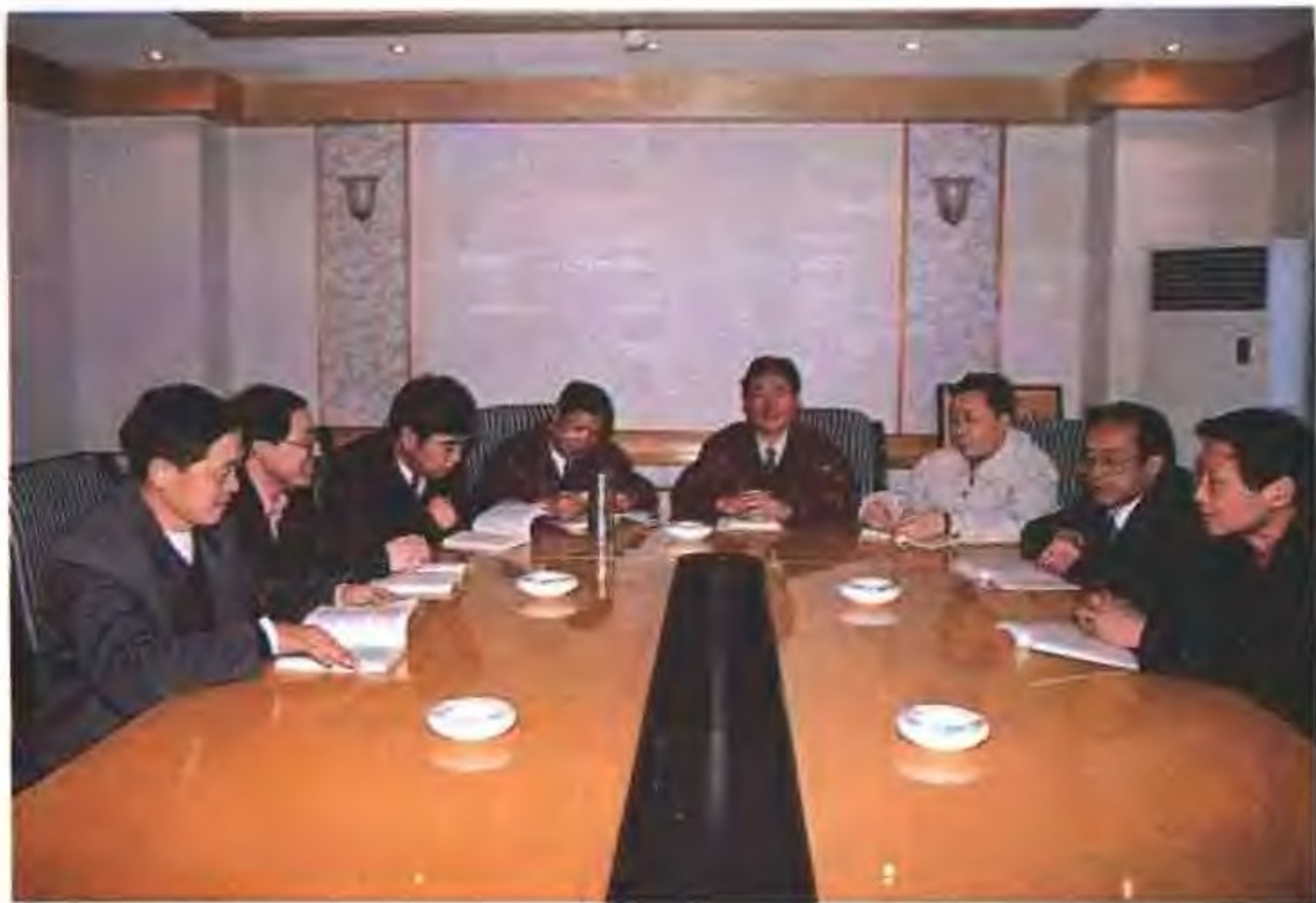
计委领导研究修志工作