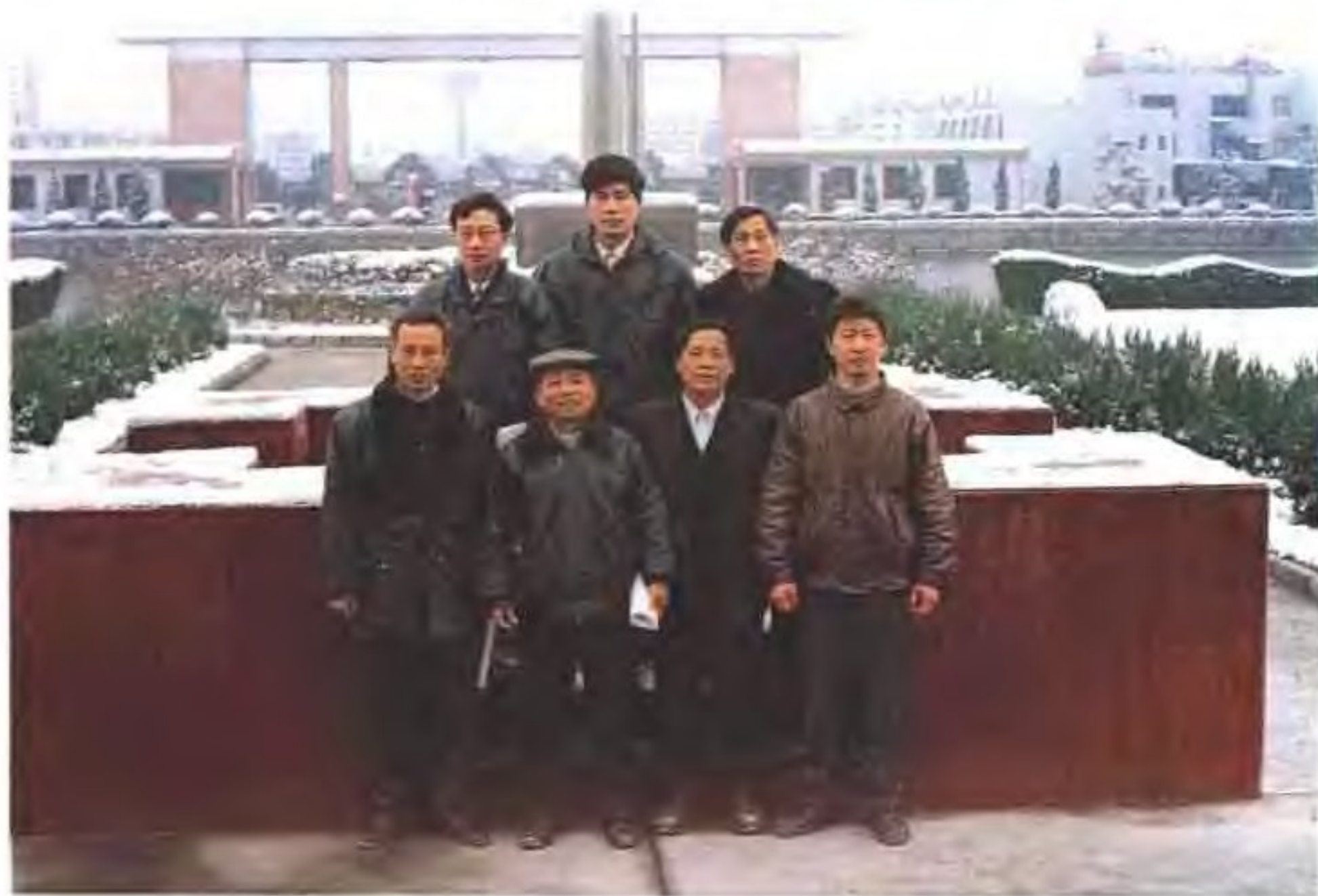
计委系统主编及市志办领导合影