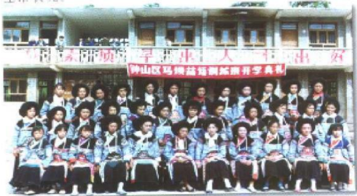
政协委员倡导的在少数民族村寨实行双语教学取得了一定的成绩。图为马坝苗族村双语教学班开学。