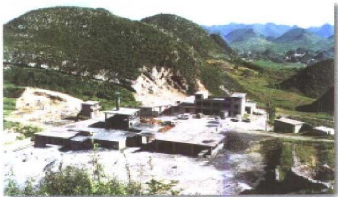
吉林电石厂旧貌。