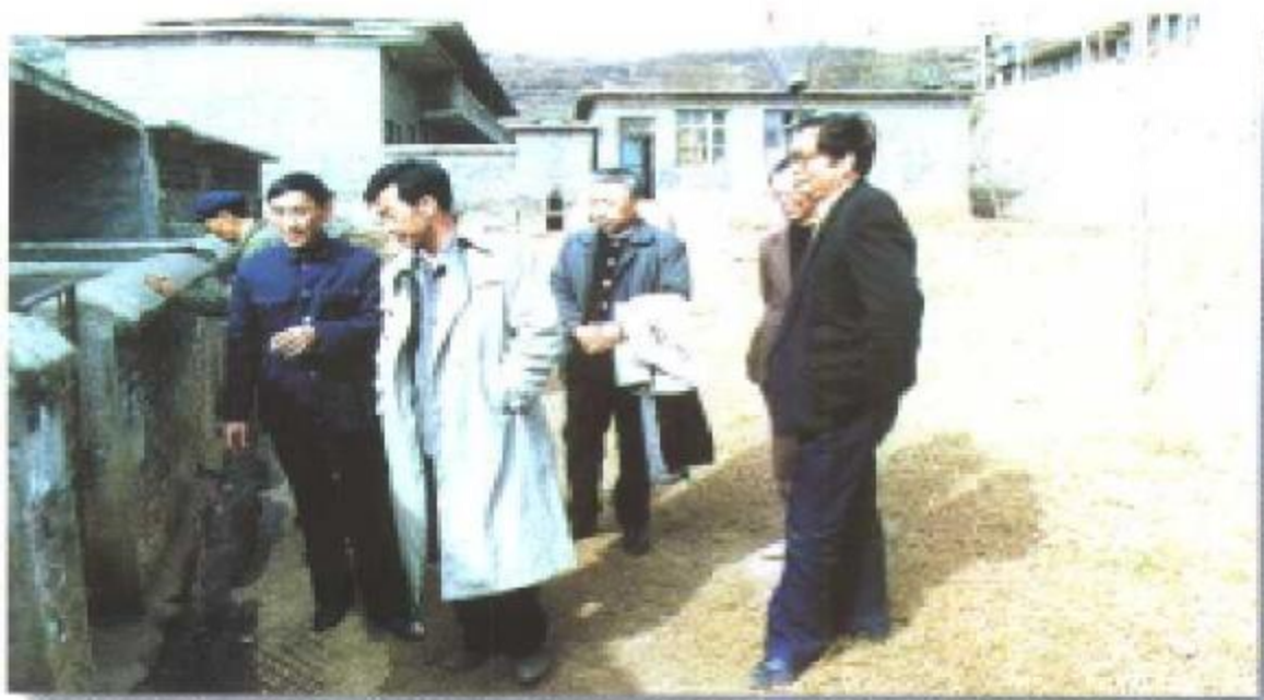
政协委员视察二塘职中。