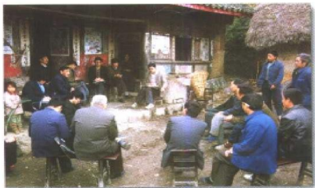
政协委员深入农村，听取农民的意见。