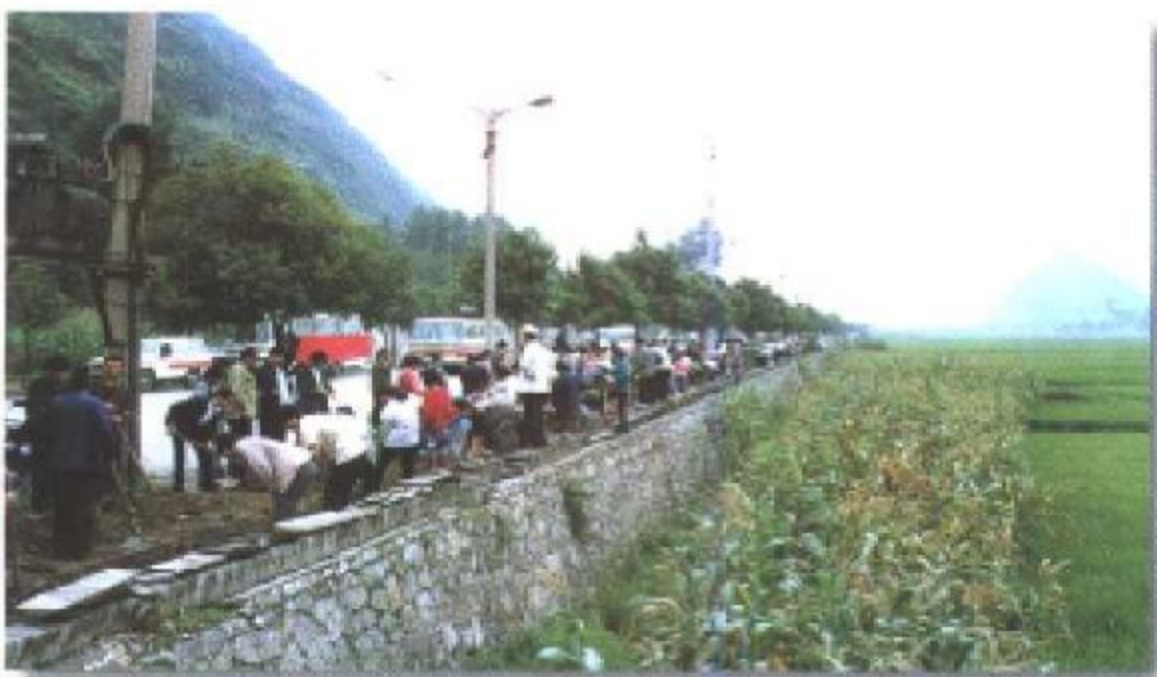
1991年9月老城，场坝饮用水主管道开工。