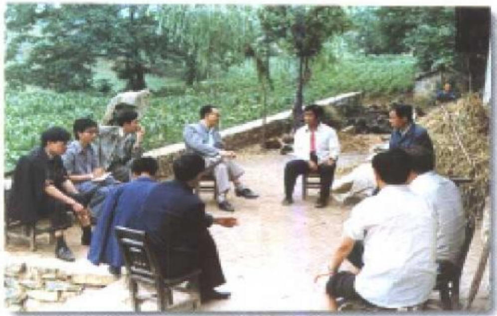
钟山区政协送科技下乡。图为政协主席与科技工作者亲切交谈。