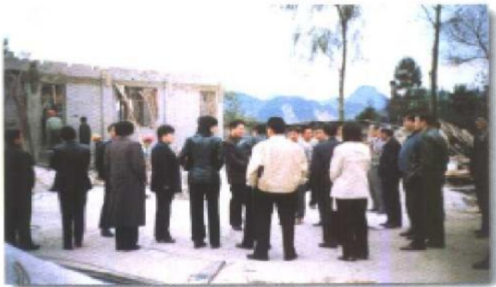
政协委员视察钟山区“义教工程。”