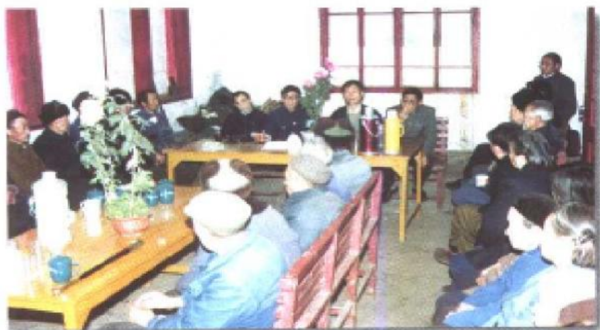
政协领导和老城政协学习组的老先生们座谈。