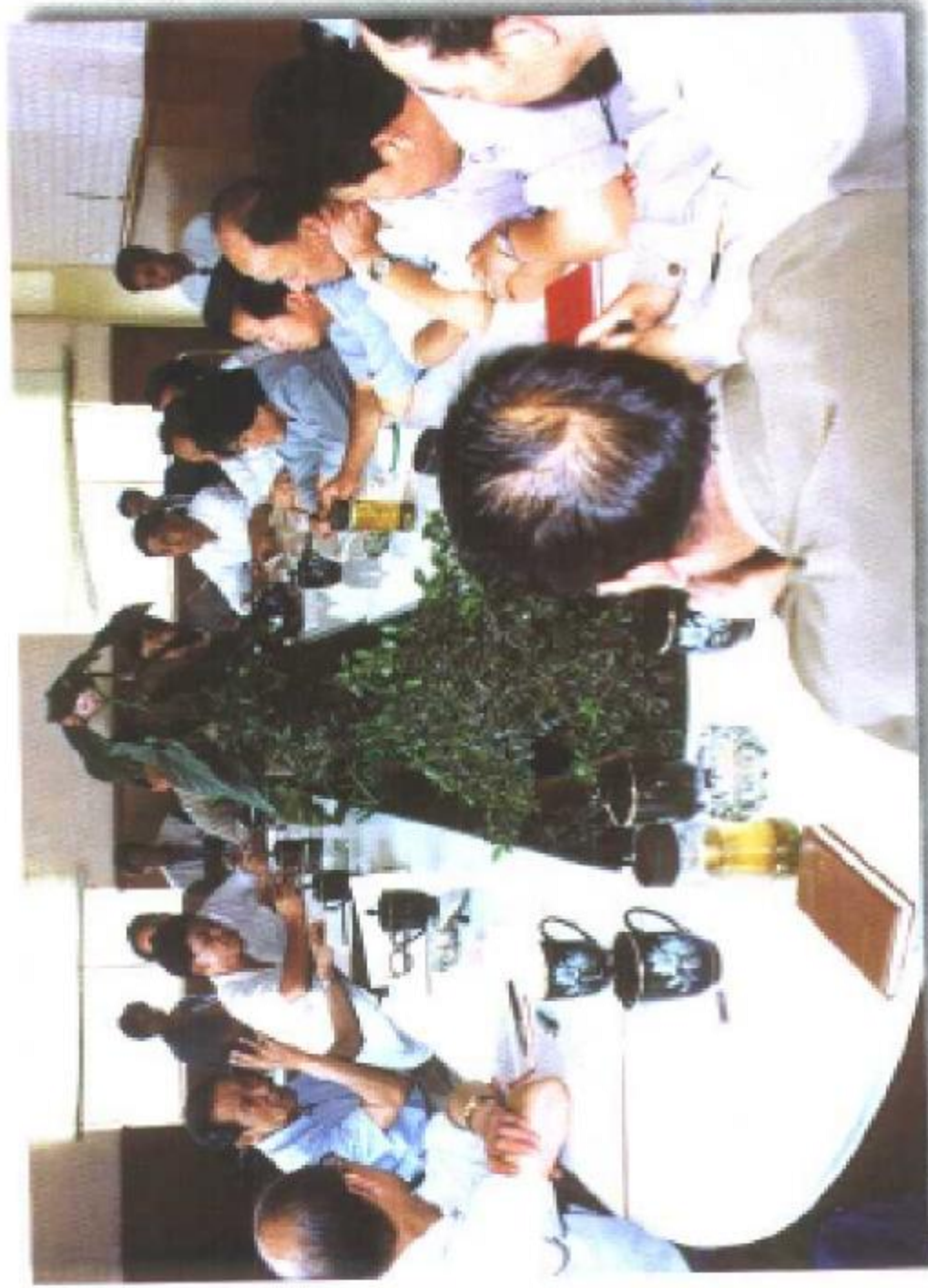
1994年7月原中共中央统战部副部长、全国工商联党组书记李定同志 (左二)在钟山区私营经济汇报会上作指示。