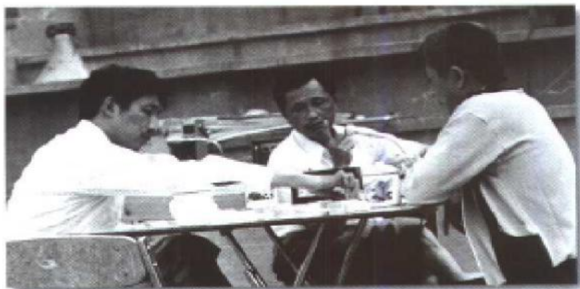
对弈钟山脚。左为中国象棋特级大师柳大华；右为象棋大师徐天利，1976年来六盘水作象棋表演赛。