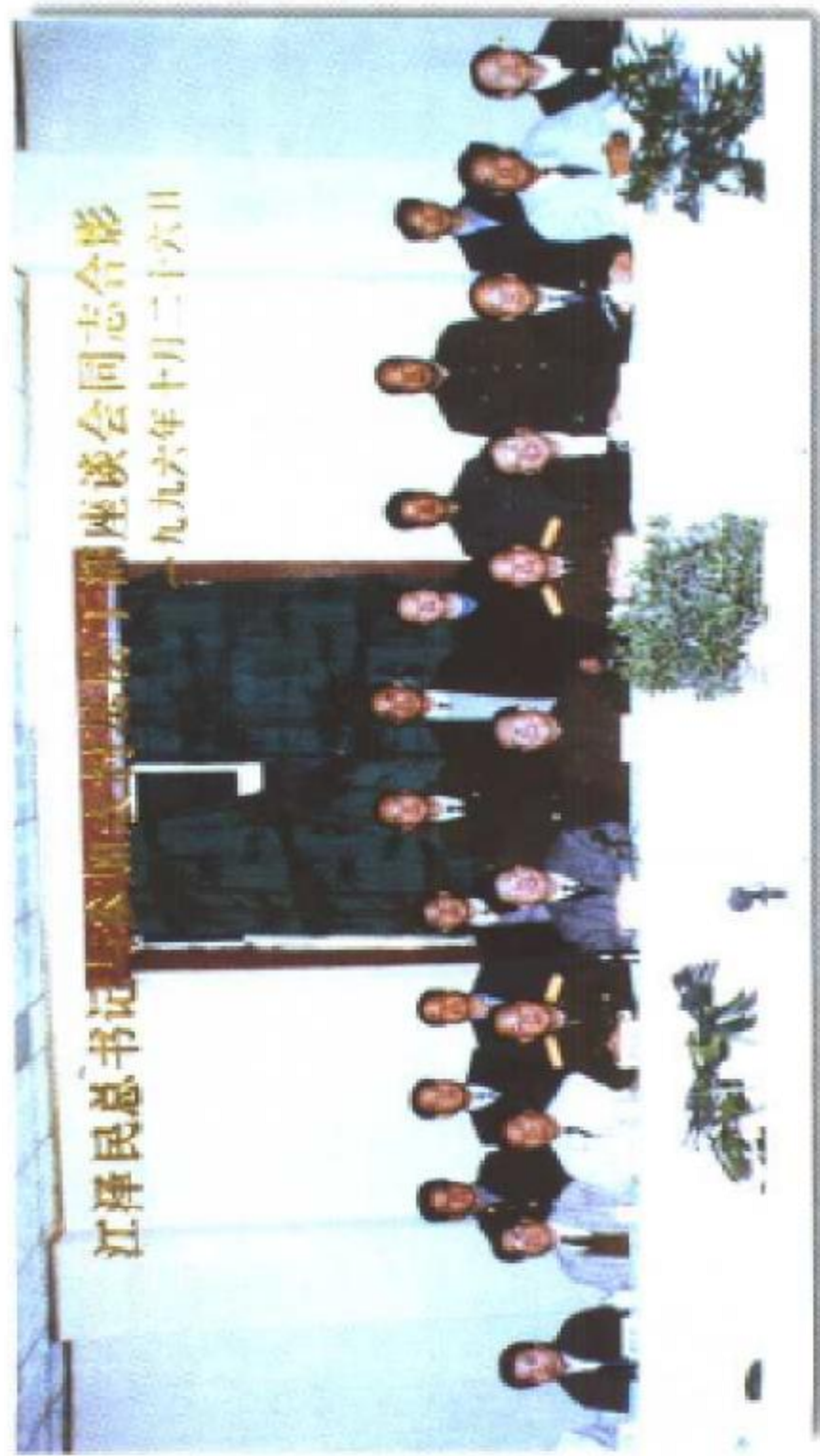
1996年10月26日江泽民总书记和其他中央领导同志在六盘水召开农村基层干部座谈会时与全体同志的合影。