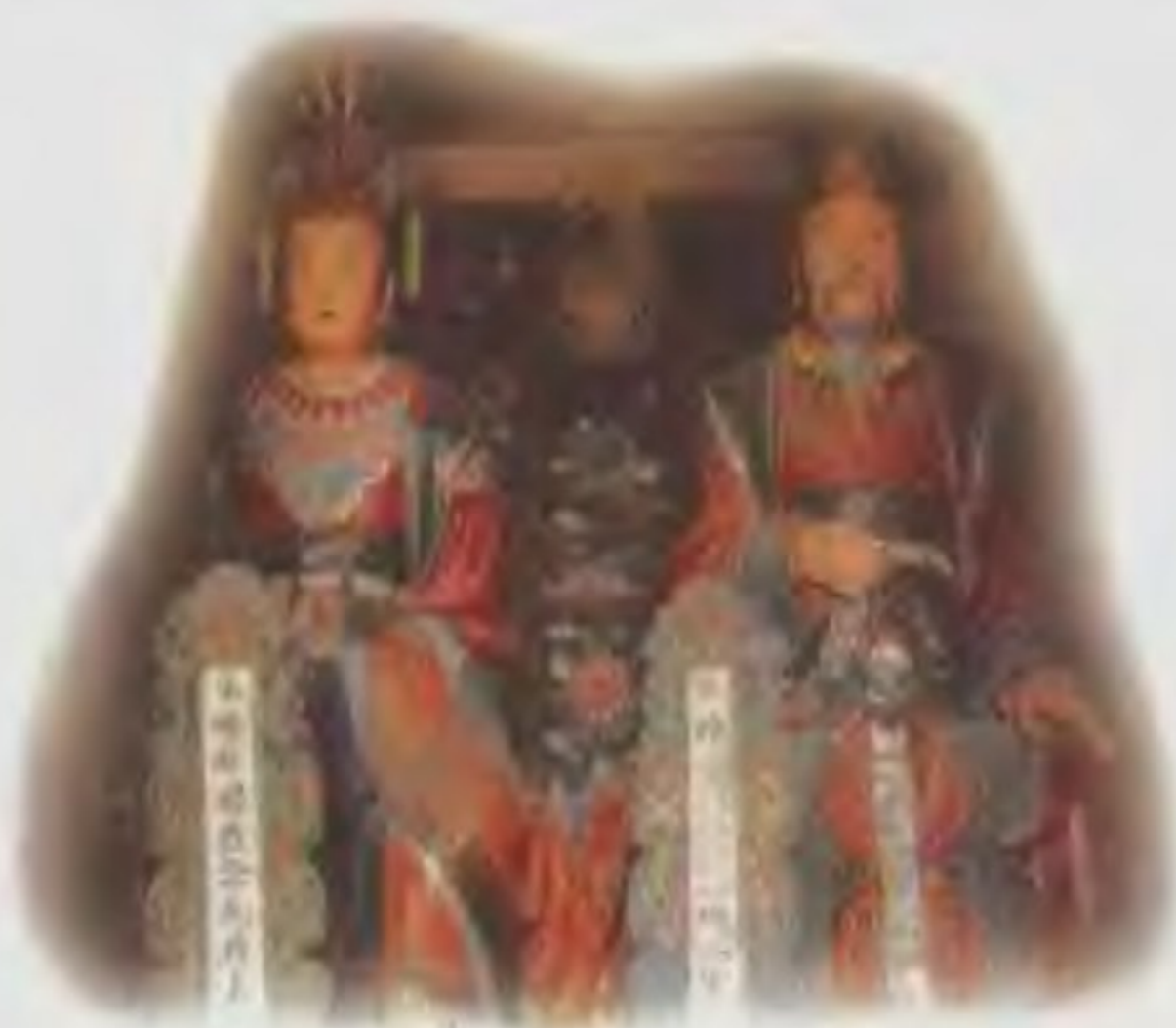
杨业及夫人宗太君像，杨业的夫人宗太君也是一位女将，曾协助丈夫英雄建功。

杨业 （922—986年）本是北汉国主刘承钧的养子，赐姓名刘继业。他骁勇善战，有智谋。宋太平兴国四年（979年）宋伐北汉，杨业在刘继元献城投降后仍据城苦战。宋太宗早知他“无敌”的大名，这次亲自领教他的忠勇，一心想收归己用。杨业为使城中百姓免遭杀戮，开城受降。太宗授予他右领军卫大将军，后又不断委以要职。杨业抗辽，连战连胜，捷报频传。陈家谷之战，潘美嫉妒杨业的赫赫战功，不发兵援助，致使杨业孤军奋战，终因兵力不够而被俘。三日之后杨业伤势过重，不食而亡。