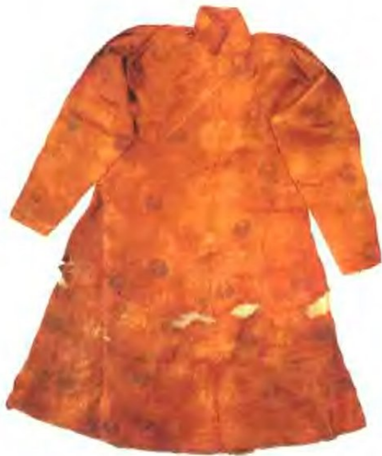
凤纹织金锦袍 契丹建国后积极选择吸收中原文化制度，这件长袍可作为契丹学习中原文化的实物见证。