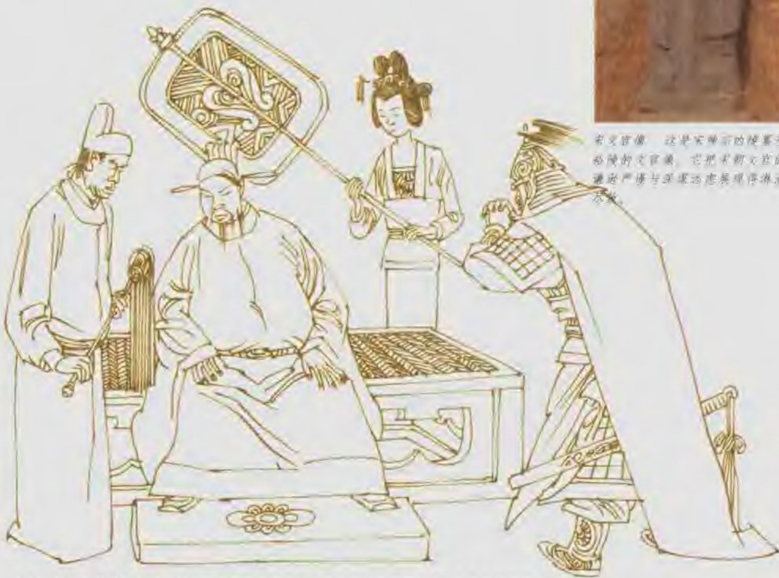
宋太祖赵匡胤杯酒释兵权 宋太祖赵匡胤与石守信、王审琦等是同甘苦、共患难的结拜兄弟，就这样他仍是不信任他们，想方设法解除他们的兵权。

分路而治 宋朝建国之初，承袭唐制，将全国分为若干道。鉴于唐末五代藩镇拥兵之祸，太祖设置专门在路上管理军队粮饷的路计度转运使。后来又设置专管各地赋税的诸道转运司，之后又因逐渐开始掌管漕运，俗称“漕司”。太平兴国二年（997年），太宗尽罢节镇统辖支郡后，根据土地形势，将全国改为15路，施行分路而治。有关边防、刑狱、财粮等事务一概由各路主管，路遂成为北宋地方最高一级行政机构。路级机构有转运使司，提点刑狱司，提举常平司，安抚使司等。