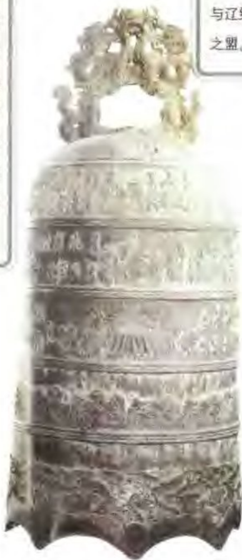
卤簿大钟 这就是靖康之难时被金人劫走的名贵器物之一。钟上雕刻了皇帝出行的仪仗队伍，称为“卤簿仪仗纹饰”，此钟故名。

海上之盟 金军连败辽军，攻占黄龙府。辽阳府的消息传到北宋，宋廷认为联合金国，收复燕云诸州的时机已到。重和元年（1118年）徽宗派遣使臣从登州（今山东蓬莱）渡海到金国。第二年金也派使臣入宋。宣和二年（1120年）双方再次互派使臣，并订立盟约。金攻打辽中京大定府（今内蒙古宁城西），宋攻打辽南京析津府（今北京西南）、西京大同府（今山西大同）。灭辽后，宋收回燕云诸州。宋将每年给辽的岁币转而给金国。宋金双方不得单独与辽结盟。因这次宋金立盟，使臣来往于海上，故称海上之盟。