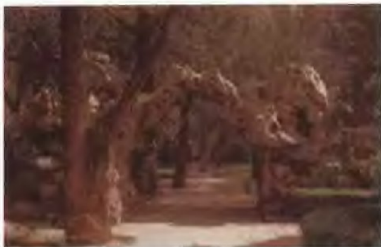
北海名石 太湖中的岩石长年被波涛冲击，就会形成剔透的空穴。宋徽宗尤其喜爱这种别致的太湖石，以致“花石纲”扰民不断。这是宋朝人不远千里从江南运到京城的奇石。当时的费尽心思可从这里略见一斑。

完颜阿骨打 完颜阿骨打(1068-1123年)是金朝开国皇帝。按出虎水(今哈尔滨东南阿什河)女真完颜部人。辽天庆三年(1113年)出任女真各部落联盟长，称都勃极烈。第二年起兵反辽，攻占宁江州(今吉林扶余东南小城子)；又于出河店(今黑龙江肇源西南)大败辽军。天庆五年正月完颜阿骨打建国号金，年号收国，定都会宁府(今黑龙江阿城南白城子)。在位期间曾攻克辽北方重镇黄龙府(今吉林农安)，夺取辽东半岛以东地区，并占领辽上京、中京、西京、南京等地。金天辅三年(1119年)颁行女真文字。