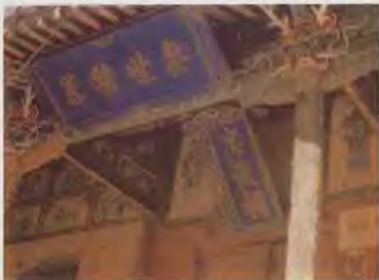
杨业祠山门，杨家三代都是英雄，就连妻子也是豪杰，杨家父子先后在战争中阵亡后，杨家义勇投宋，宋太宗欣然接纳，带领杨家妇出征，终于大获全胜。