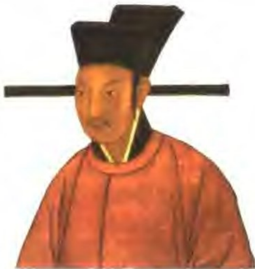
李纲（1088—1140年）字伯纪，福建邵武人。发生靖康之难时力主抗战，林则徐曾与楹联“进退一身兴社稷，安危千古镇湖山”来赞颂他。