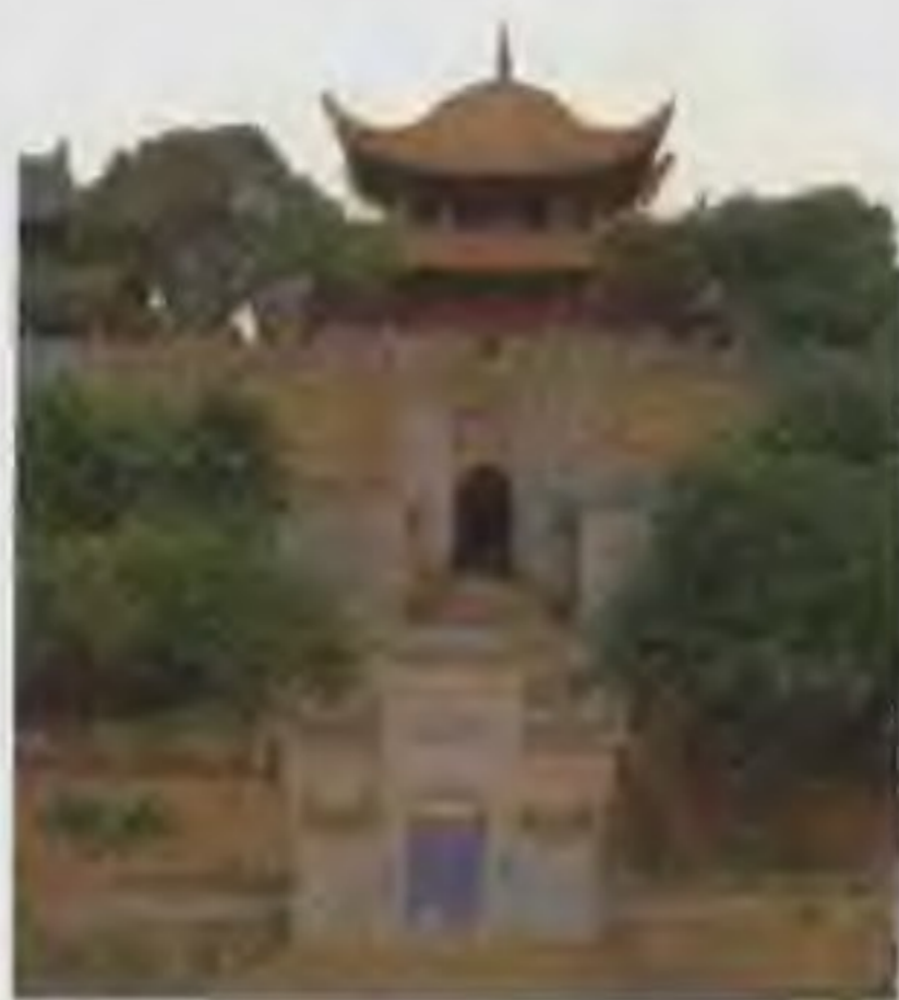
岳阳楼为湖南岳阳的西门城楼，始建于唐代。北宋滕子京重修，1950年后又进行了大规模的重修。它坐落在洞庭湖旁，高三层。登上岳阳楼，便可俯瞰浩淼奔流的洞庭湖，以及若隐若现的君山。《岳阳楼记》为北宋参知政事范仲淹所作，岳阳楼因这篇千古名篇而著名。

庆历新政 宋仁宗庆历年间阶级矛盾和民族矛盾日益激化，统治集团中的一部分人认为若不采取措施，就可能危及统治。仁宗任命范仲淹为参知政事，富弼为枢密副使，在政治上实行改革。针对当时最严重的冗官、冗兵、冗费，庆历三年（1043年）范仲淹等提出明黜陟、精贡举、厚农桑、减徭役、均公田、修武备、重命令、抑侥幸、择官长、覃恩信等十项改革措施。仁宗多采纳并颁布实施。但随着新政的施行，利益受到严重损害的大官僚、大地主们联合起来反对新政，并诬陷范仲淹、富弼等为朋党。庆历五年范仲淹被罢，新政废止。