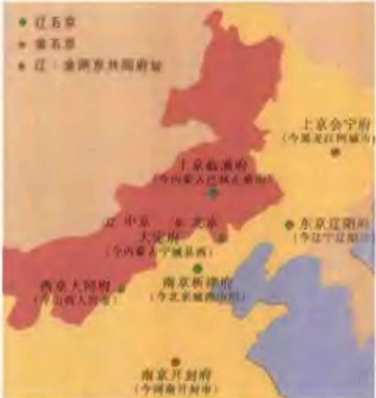
辽、金五京分布图 辽的都城采用五京制，这实际上是他们逐水草而居生活的反映。以后的金、元、清亦仿效这种设置。