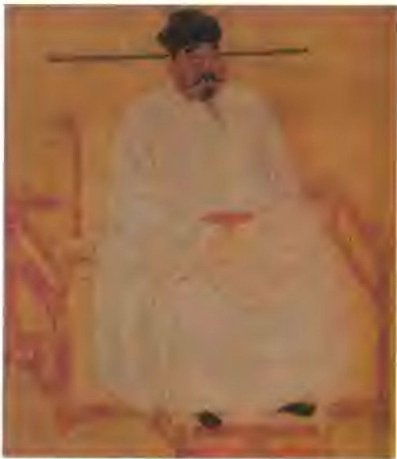
宋太祖赵匡胤（927—976年），公元960—976年在位。在位期间采取一切措施加强中央集权。公元960年，赵匡胤建立宋朝，定都汴梁（今河南开封）。为了消除当时的割据局面，他又相继灭了南唐、荆南、后蜀、南汉等。在位期间国势的版图相对稳定。

陈桥兵变 “王侯将相，宁有种乎”，很久以前人们就有这样的想法，否则也不会出现唐太宗李世民、宋太祖赵匡胤。五代后周显德二年（959年），世宗柴荣病亡，由年幼的恭帝继位。第二年，契丹联合北汉军南下，宰相范质等商议后，命殿前都点检赵匡胤出征。不服恭帝统治，意图谋位的赵匡胤认为时机已到，当大军行至汴京东北陈桥驿时，由赵匡胤、赵普等发动兵变，把事先准备好的黄袍披在赵匡胤身上。之后大军反攻回开封，逼迫年幼的恭帝退位，以赵匡胤为开国皇帝的宋朝，于公元960年建立。