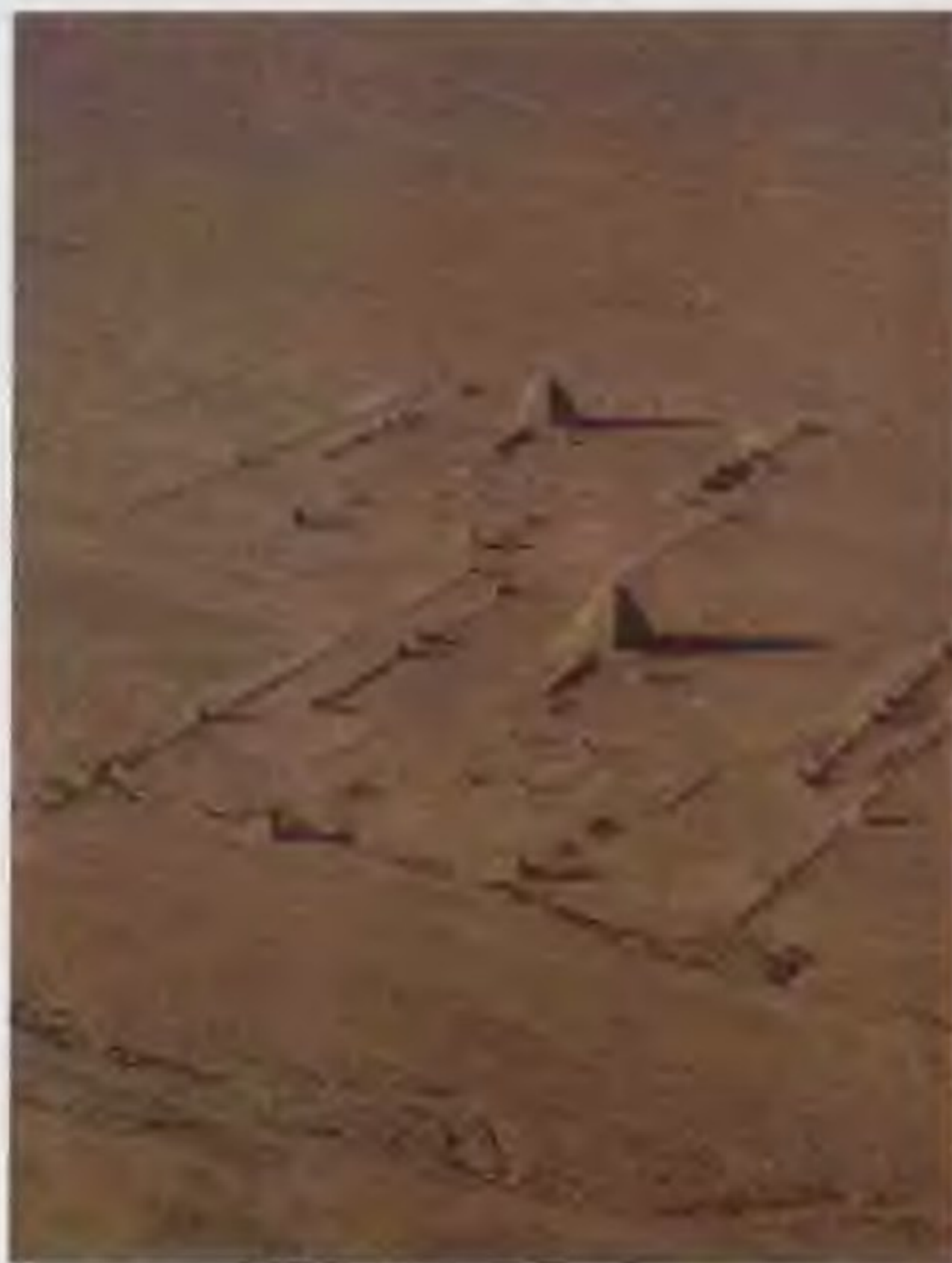
西夏王陵 西夏皇陵位于宁夏银川市以西，贺兰山东麓。在东西约5公里，南北约10公里的范围内，有帝王陵墓9座，陪葬墓103座，规模相当大。

庆历新政 宋仁宗庆历年间阶级矛盾和民族矛盾日益激化，统治集团中的一部分人认为若不采取措施，就可能危及统治。仁宗任命范仲淹为参知政事，富弼为枢密副使，在政治上实行改革。针对当时最严重的冗官、冗兵、冗费，庆历三年（1043年）范仲淹等提出明黜陟、精贡举、厚农桑、减徭役、均公田、修武备、重命令、抑侥幸、择官长、覃恩信等十项改革措施。仁宗多采纳并颁布实施。但随着新政的施行，利益受到严重损害的大官僚、大地主们联合起来反对新政，并诬陷范仲淹、富弼等为朋党。庆历五年范仲淹被罢，新政废止。