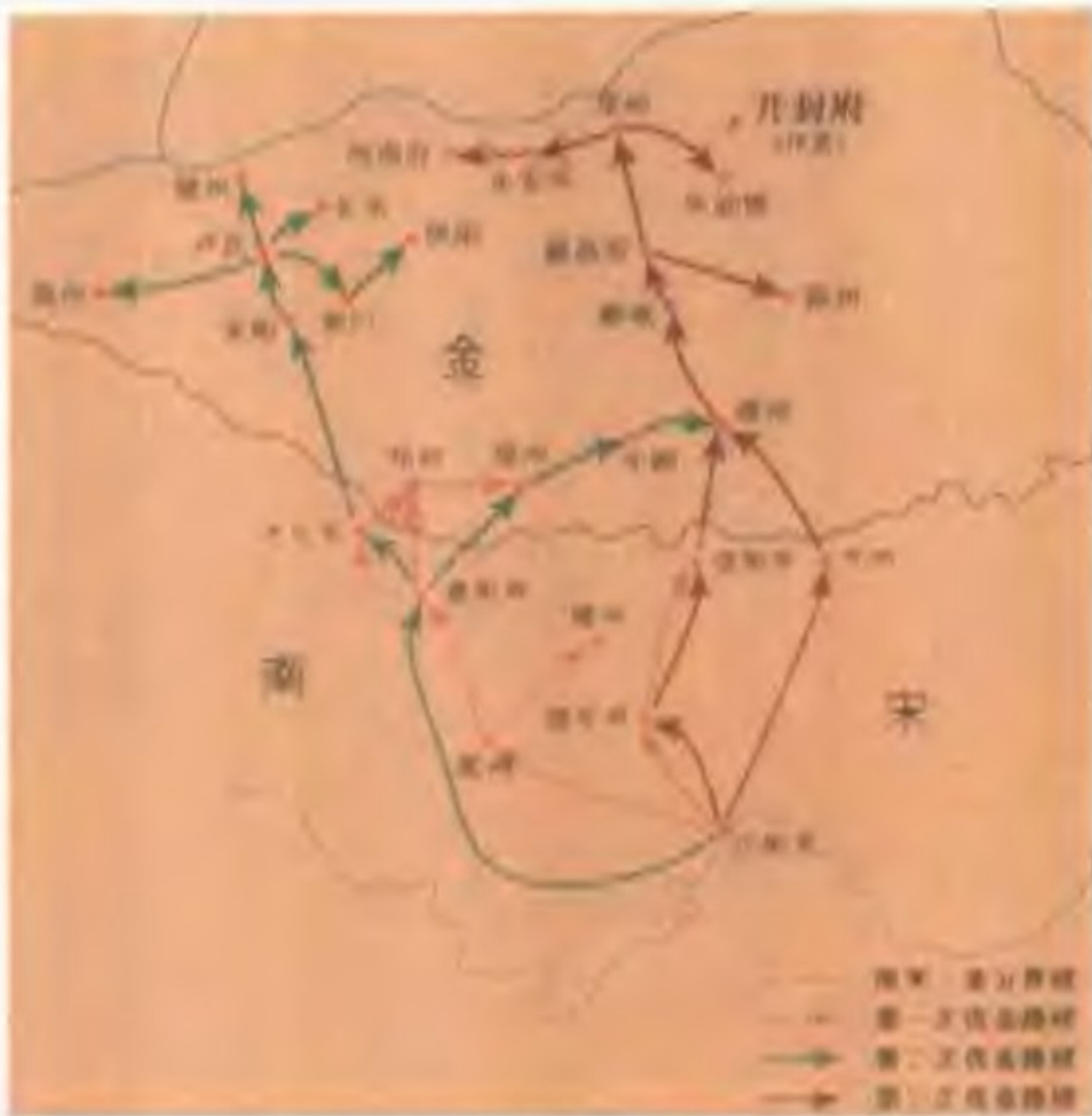
岳飞三次北伐路线图 岳飞精忠报国，三次北伐立下赫赫战功，只差一点儿就可打回开封，收复失地。

岳飞 (1103-1142年) 字鹏举，相州汤阴县(今河南汤阴)人，南宋抗金名将，著名的军事家。出身于农民家庭，少年时沉默寡言，平日在勤劳耕作外，还抽出时间努力读书，尤其喜爱《左传》、孙吴《兵法》。他向周同习武，又跟名枪手陈广学枪法，其技“一县无敌”。宣和四年(1122年)岳飞从军报国。以下级军官参加宋金联兵灭辽，攻打燕京的战役。绍兴十年(1140年)岳飞挥师北伐，取得了著名的郾城和朱仙镇大捷，致使金人也发出“撼山易，撼岳家军难”的感叹。宋高宗和奸臣秦桧却在一日内连下12道回朝的金牌，岳飞只能叹息“十年之功，毁于一旦”。秦桧串通张俊等人，以“莫须有”的罪名于绍兴十一年十二月二十九日将年仅39岁的岳飞杀害。岳飞的儿子岳云(1119—1142年)也是宋朝的一员猛将，但不幸的是被秦桧等诬陷，与岳飞同时被害，年仅23岁。