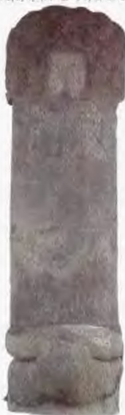
大金得胜陀颂碑 该碑立于金世宗大定二十五年(1185年)。碑上分别用汉文和女真文记载了辽天庆四年(1114年)，金太祖完颜阿骨打在吉林松原徐家店誓师反辽，次年建立金国的史实，以及立碑的缘起和颂文。

完颜阿骨打 完颜阿骨打(1068-1123年)是金朝开国皇帝。按出虎水(今哈尔滨东南阿什河)女真完颜部人。辽天庆三年(1113年)出任女真各部落联盟长，称都勃极烈。第二年起兵反辽，攻占宁江州(今吉林扶余东南小城子)；又于出河店(今黑龙江肇源西南)大败辽军。天庆五年正月完颜阿骨打建国号金，年号收国，定都会宁府(今黑龙江阿城南白城子)。在位期间曾攻克辽北方重镇黄龙府(今吉林农安)，夺取辽东半岛以东地区，并占领辽上京、中京、西京、南京等地。金天辅三年(1119年)颁行女真文字。