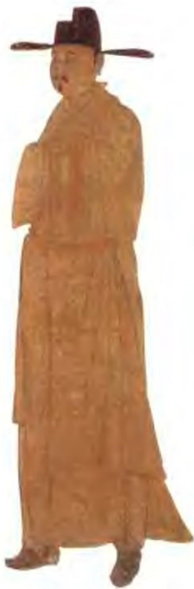
这是壁画中反映的身着汉式官服，出任南面官的汉人形象。