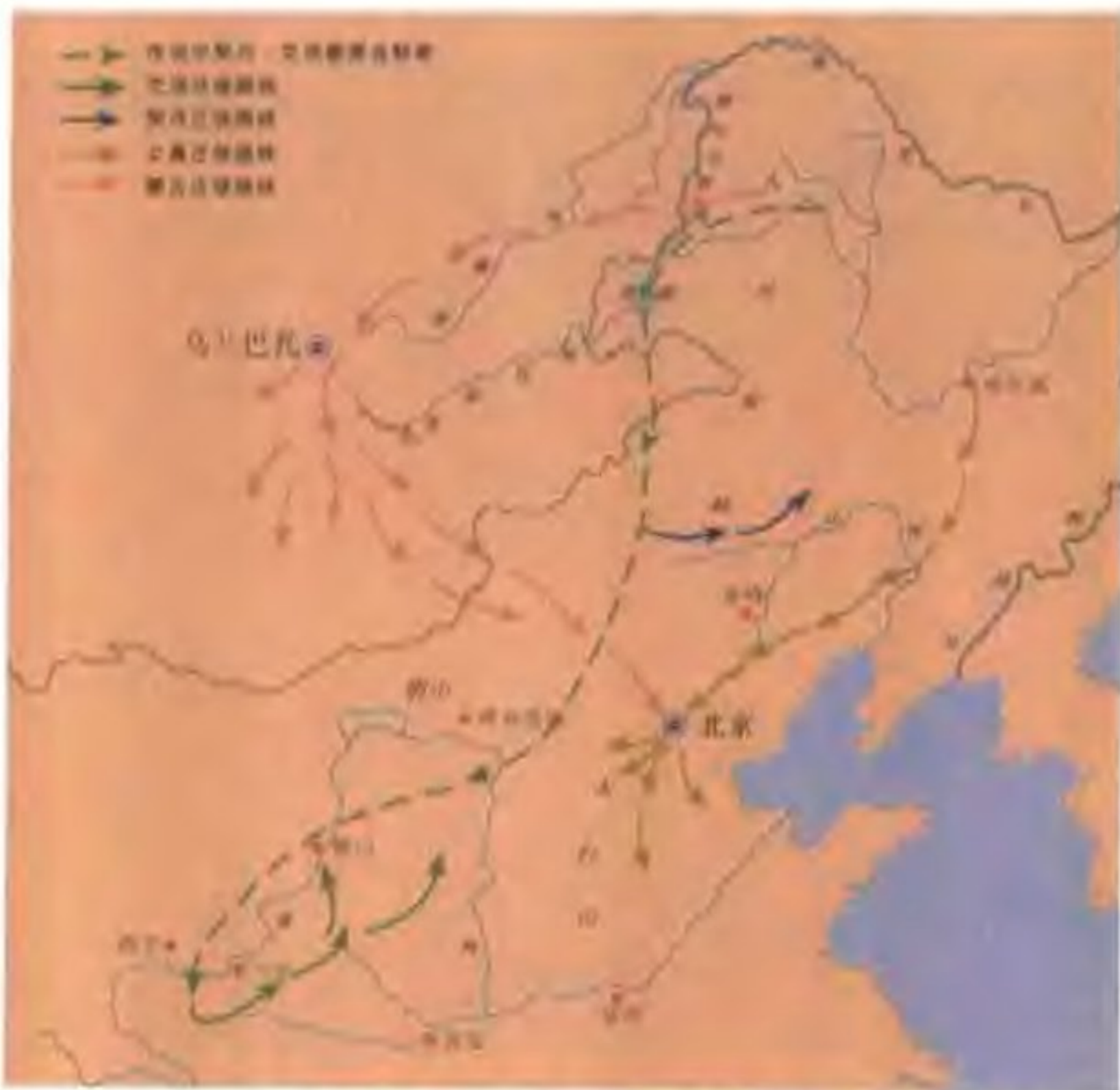
契丹、奚、奚、蒙古源地及迁徙情况 少数民族随水草而居，他们在不断地迁徙过程中始终在寻找适合自己发展的最佳环境。

南北面官制 唐朝中叶以后，北方藩镇割据的局面愈演愈烈，契丹族的势力也趁此混乱时机日益强大。公元916年，耶律阿保机统一契丹各部，建立政权，定都上京（今内蒙古巴林左旗南）。辽统治者提出了“以国制治契丹，以汉制待汉人”，分而治之的开明治国方针，并在这一基础上实行“南北面官制”。北面官由契丹人担任，衙署设在皇帝宫帐以北，主要负责统治契丹和其他游牧民族；南面官主要由汉人担任，衙署设在皇帝宫帐以南，主要统治汉人。皇帝和南面官穿汉服，太后和北面官穿契丹服。