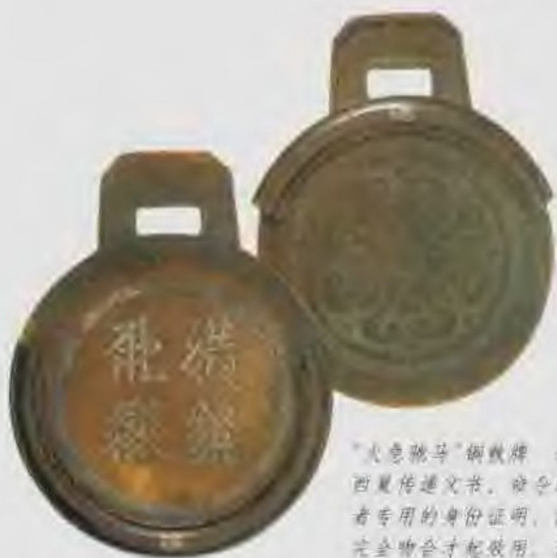
“火急脱马”铜钱牌 这是西夏传递文书、命令的使者专用的身份证明，两片完全吻合才能使用。该片上的四个西夏文字意为“火急脱马”。

宋夏和议 自北宋景祐五年（1038年）党项族建立大夏国以来，宋朝西北边界就一直不得安宁。定川寨之战，元昊采用诱兵深入之计，宋军大败。朝中就有议和的议论。庆历三年（1043年）双方开始议和。和约规定：宋承认元昊为夏国主；宋每年给夏绢十三万匹、茶二万斤、银五万两；其他岁时赏另给；恢复互市。宋夏和议，使夏与契丹矛盾激化。宋、辽、夏三方鼎立格局形成。