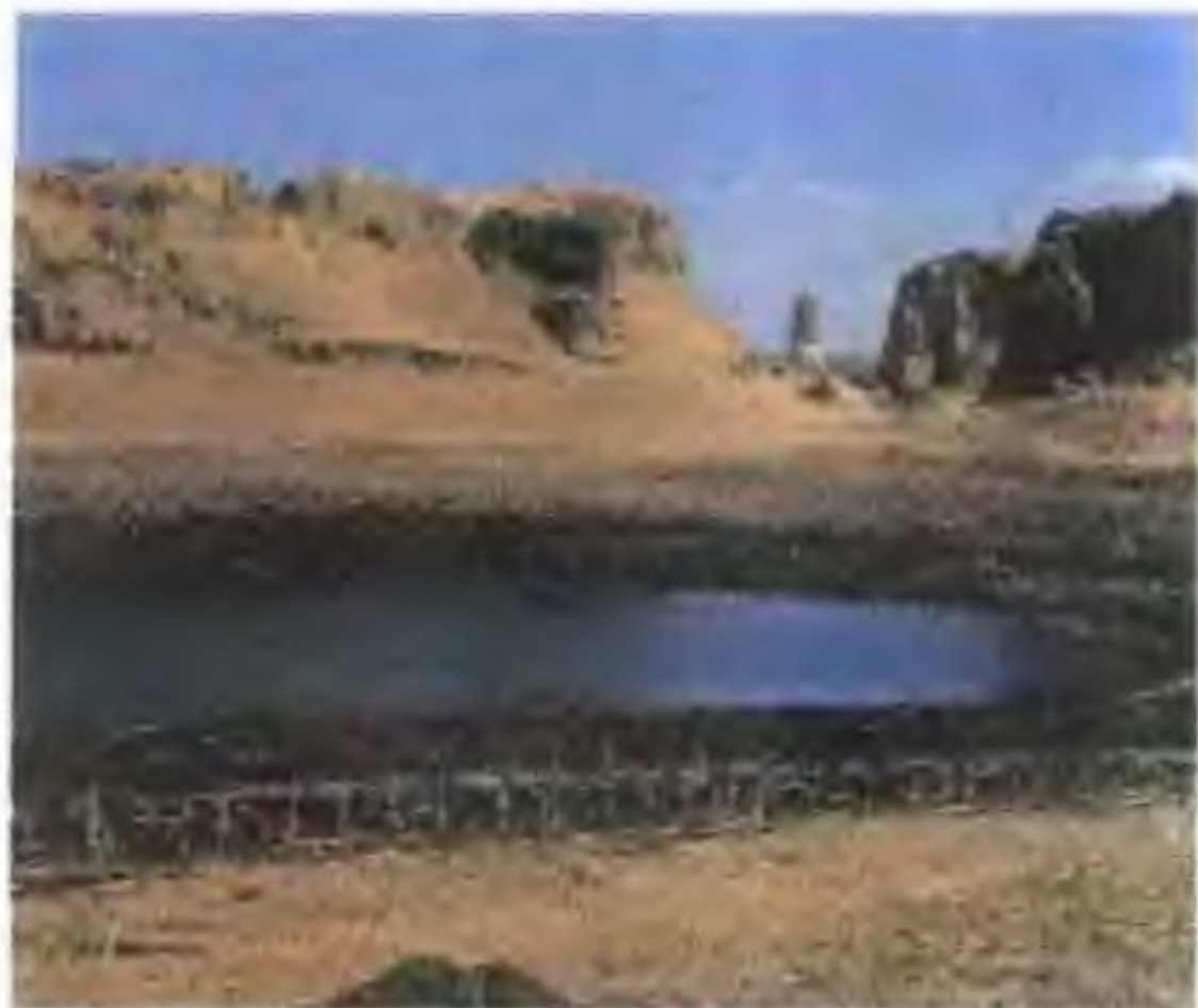
辽中京遗址 澶渊之盟后，辽利用每年从宋朝获得的大量财富中的一部分建设城市，辽中京大定府就是利用这笔资金建设的。