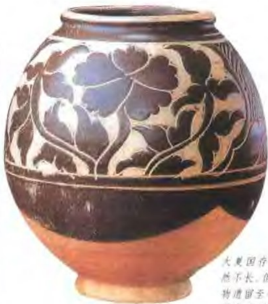
大夏国存在的时间虽然不长，但也有一些文物遗留至今，这就是极具代表性的黑釉剔花牡丹纹罐。

元昊 西羌党项部的首领，由于他的祖先曾率领部众归降唐王朝，受封为西戎州都督，赐姓李氏，故称李元昊。北宋建立，元昊归宋，又得赵姓。但他得封平西王后，自称姓嵬名，号兀卒（青天子）。公元1038年又接受辽的册封，为西夏皇帝，即夏景宗，国号大夏，定都兴庆府（今宁夏银川）。元昊精通蕃、汉文字，后又创制西夏文。熟悉兵法，有谋略，把全国分为两厢，在各地创设监军司，四向驻军。他在位十年期间，多次打败宋军和辽军，形成三方鼎立的局面。大夏国传十帝，夏末帝抵抗蒙古军未果，向蒙古军请降，被杀。共存在189年。