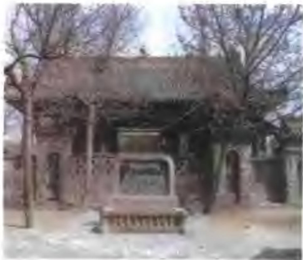
陈桥兵变遗址 遗址位于今河南封丘的陈桥镇，前面一块石碑上书“宋太祖黄袍加身处”。