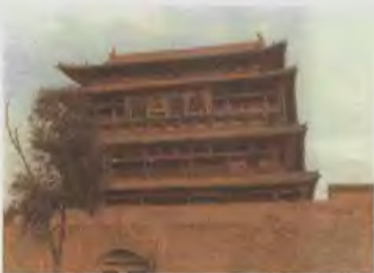
雁门关 自从宋朝失去了用来作为天然屏障的高宗十六州，只得加强设关防备，以阻挡北方少数民族的入侵。