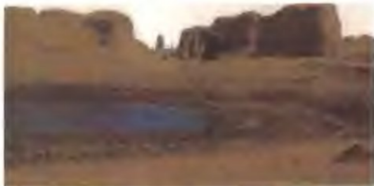
辽上京遗址 辽上京始建于919年，初名皇都，后改此名。

猛安谋克 猛安指部落军事首长，谋克是氏族长。猛安谋克原是女真人在氏族社会末期的部落组织。金太祖完颜阿骨打建国前后，在女真、渤海、契丹族地区全面推行这一制度，使之成为军事组织和地方行政组织的军政合一。规定每300户为1谋克，10谋克为1猛安。猛安、谋克管辖下的各户壮丁，平时从事生产，战时应征出战，既节省了军队开支，又保证了战斗力。