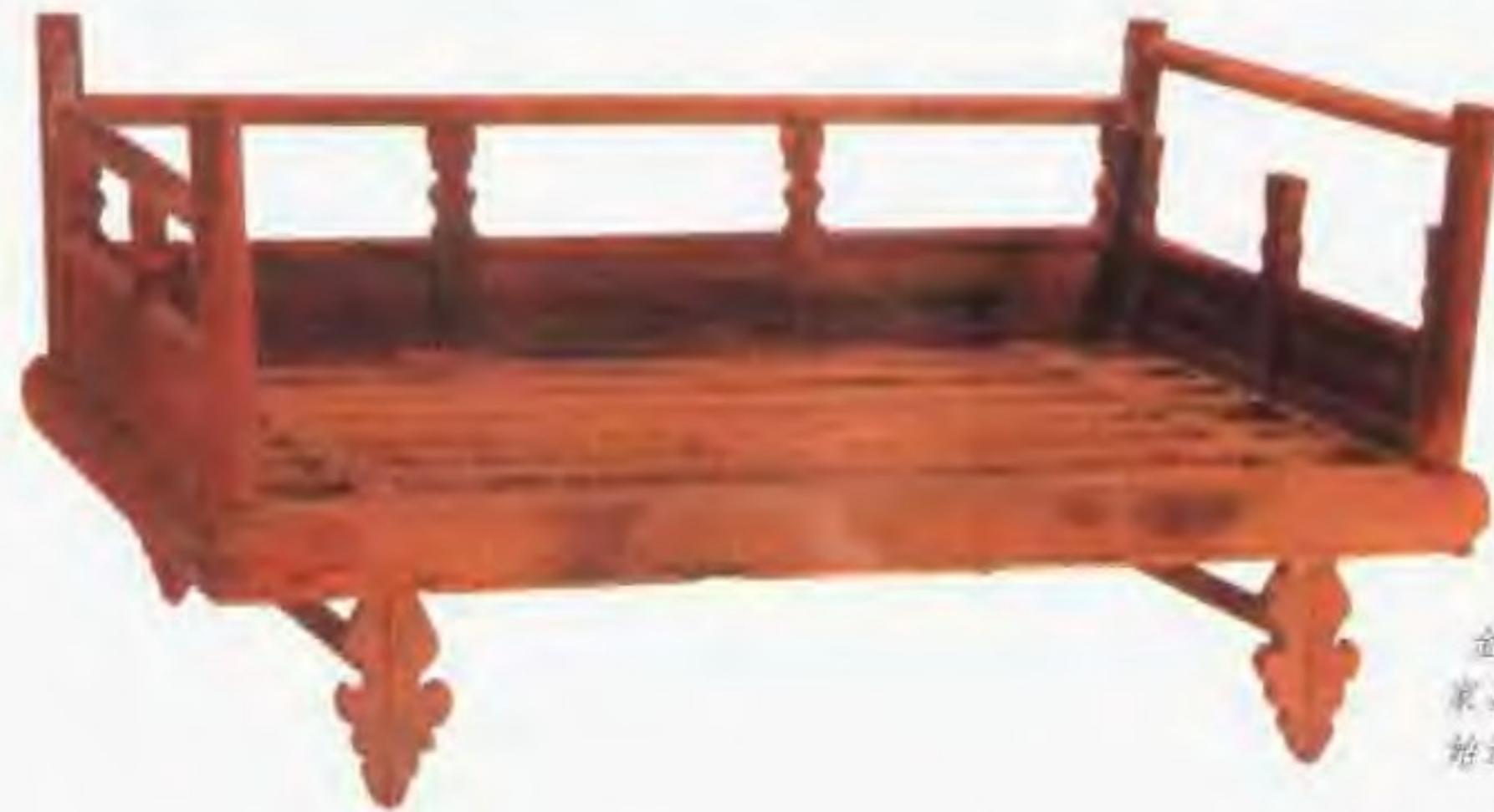
金木床 这是金朝墓葬中出土的家具。木制床的出现，说明金人已开始过暂时定居的生活。