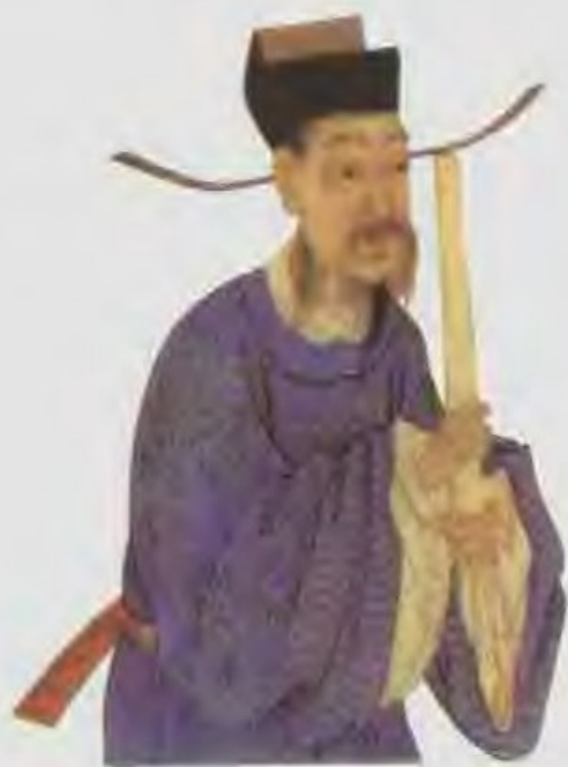
建准（961—1023年）字平仲，华州下邳（今陕西渭南）人。性情豪爽，勇敢沉着，但遇事却优柔寡断，且为人刚直，备受众人的敬重。

杨业 （922—986年）本是北汉国主刘承钧的养子，赐姓名刘继业。他骁勇善战，有智谋。宋太平兴国四年（979年）宋伐北汉，杨业在刘继元献城投降后仍据城苦战。宋太宗早知他“无敌”的大名，这次亲自领教他的忠勇，一心想收归己用。杨业为使城中百姓免遭杀戮，开城受降。太宗授予他右领军卫大将军，后又不断委以要职。杨业抗辽，连战连胜，捷报频传。陈家谷之战，潘美嫉妒杨业的赫赫战功，不发兵援助，致使杨业孤军奋战，终因兵力不够而被俘。三日之后杨业伤势过重，不食而亡。