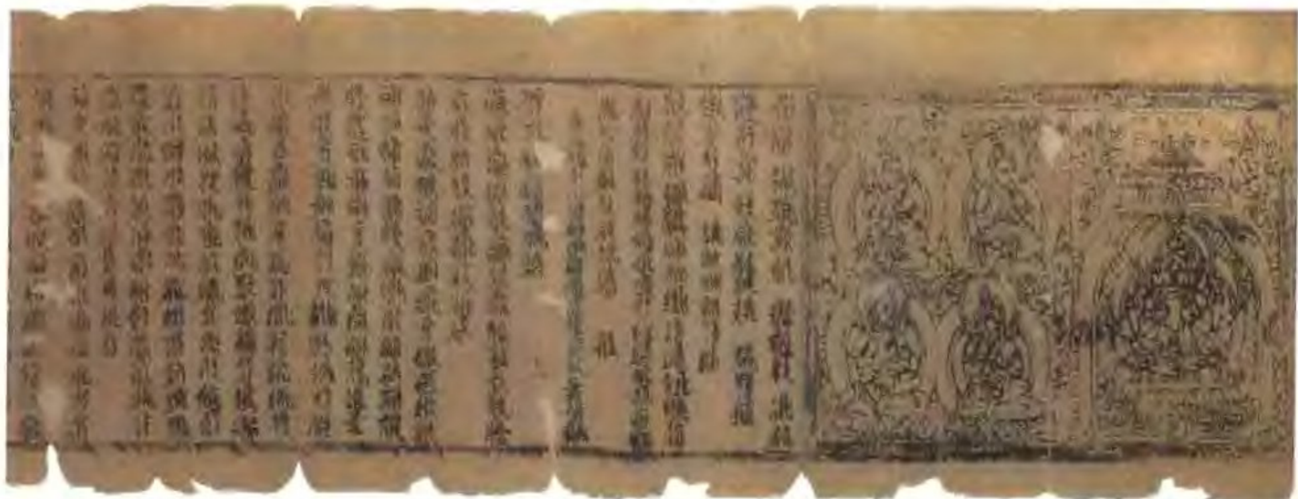
西夏文雕版印经 元昊虽精通汉语，但对西夏文的创立亦非常重视，命野利仁荣主持此事。西夏文字是在仿照汉字字形的基础上创制的间得文字。