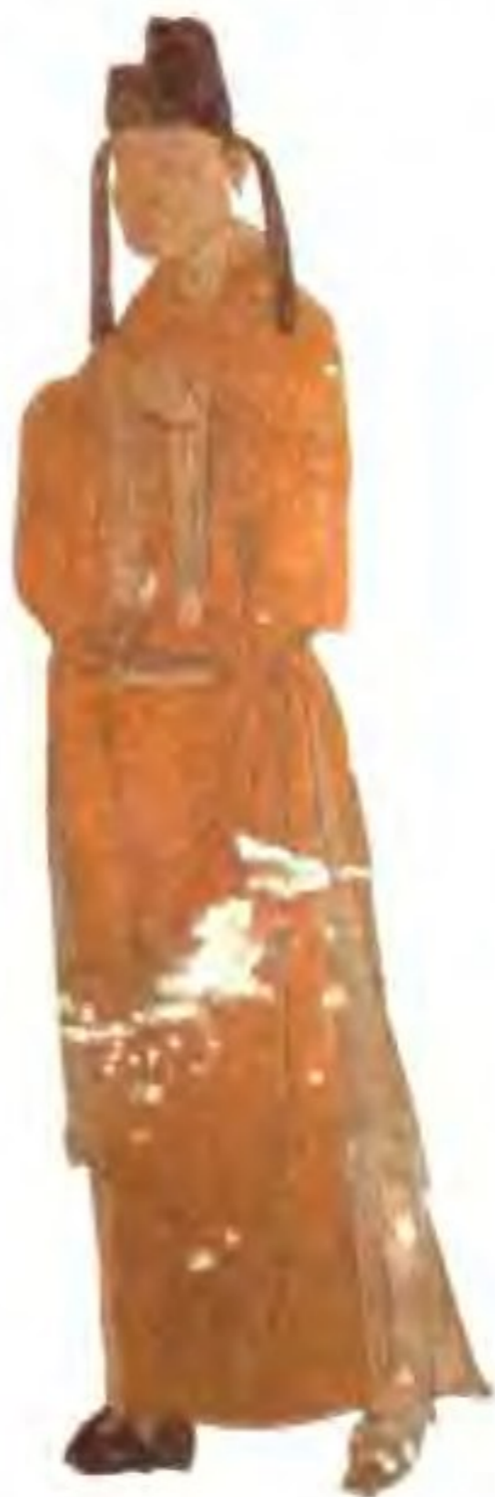
辽文官像 这是壁画中的辽文官形象，可以看出，他们的服装同汉地的基本上没什么区别。