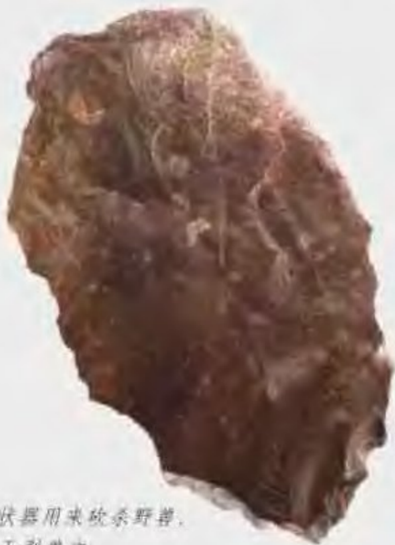
薄型尖状器用来砍杀野兽，也可用于剥兽皮。