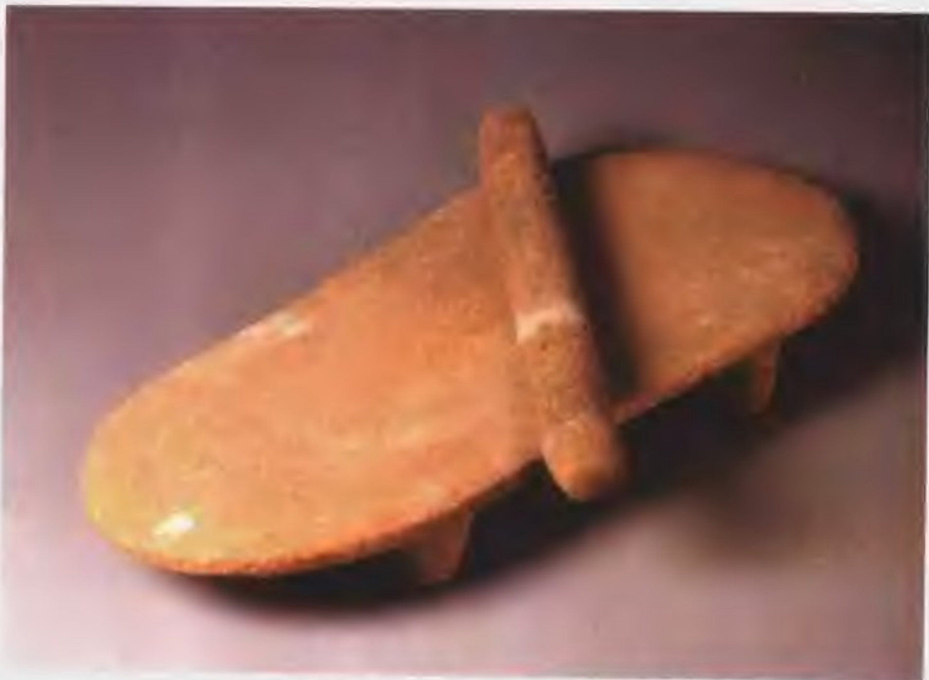
出土于河南新郑裴李岗村新石器早期遗址的磨盘和磨棒是粮食加工器具，用这种磨盘和磨棒脱去谷物的外壳。磨盘长63.5厘米、宽28厘米，呈前宽后窄的鞋底形。磨棒长47厘米、径4.8厘米。