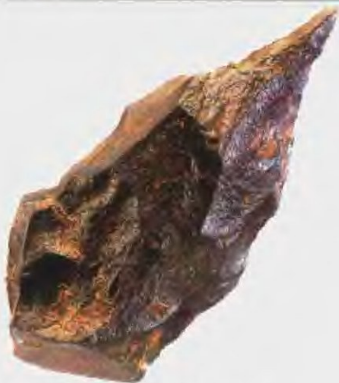
这种尖状器为旧石器人制作的典型器具，利于打猎。

旧石器时代 旧石器是用打制方法制成的石器，人们用这种工具打猎、分割兽体。伴随旧石器出土的往往有灰烬或炭粒，据此可知人们已经学会用火。根据与人类化石共生的其他古生物化石，可以使我们了解到当时的生态环境。旧石器时代距今约250万-1万年，人们聚群而居，到了后期则产生了母系氏族社会。约公元前8000年新石器时代开始。