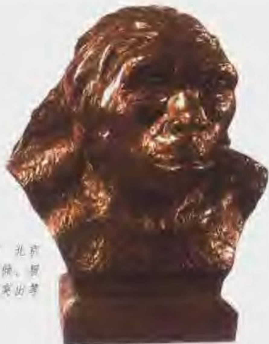
北京人复原图 北京人具有颧骨后倾，眉骨粗大，吻部突出等特点。