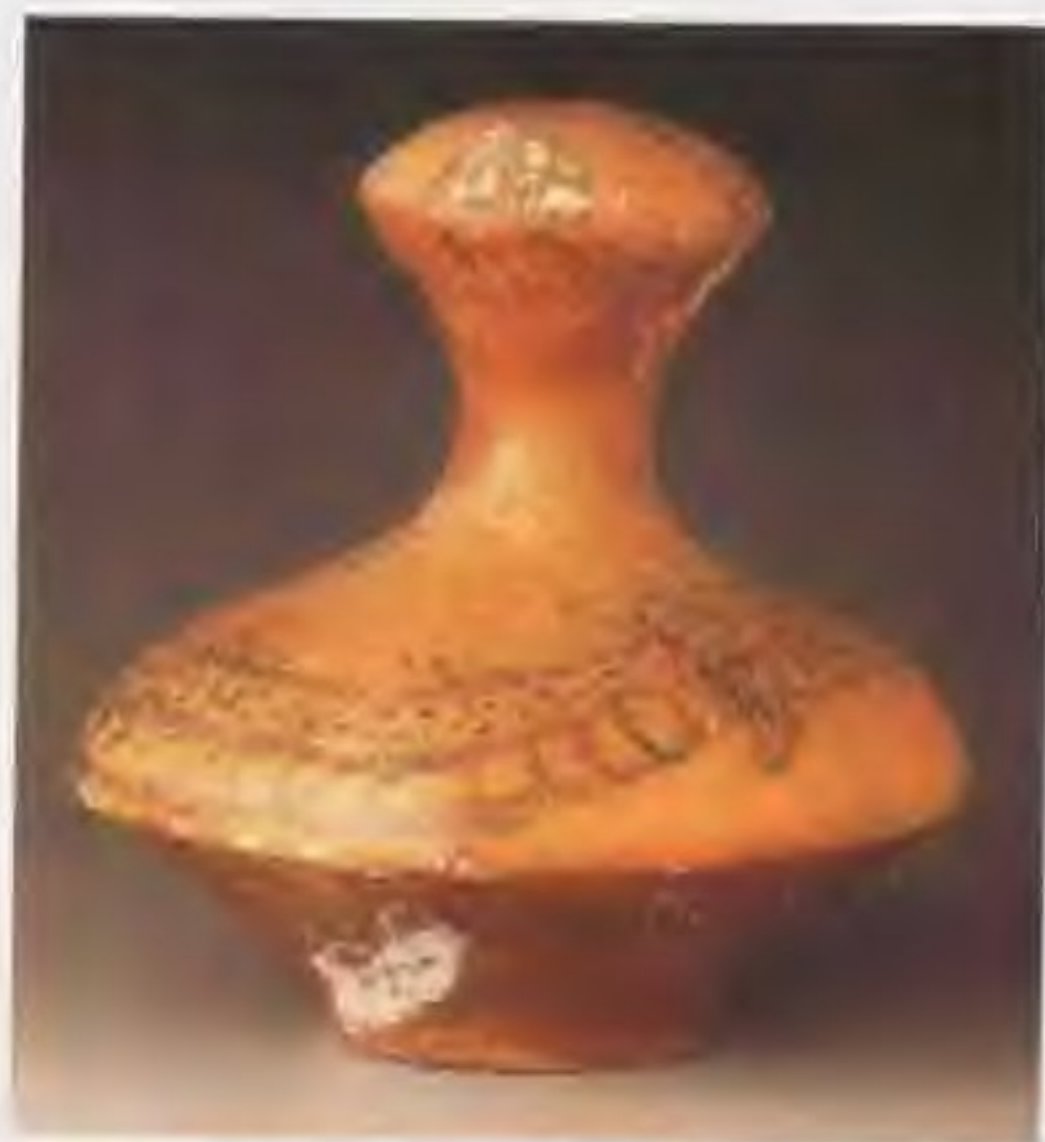
1958年在陕西宝鸡北首岭仰韶文化遗址出土的鸟鱼纹细颈彩陶瓶，口径21厘米，底径8.5厘米，高21.8厘米。泥质红陶，黑褐色彩，水鸟衔鱼图案。

陶文化 陶器是人类创造的第一种生活用具，它标志着人类生产能力和生活水准的提高。新石器时代的人们已普遍使用陶器。陶器的制作一般先用陶土制成所需器形，然后在窑内经700—900度的温度烧制。制作陶胎有捏塑、盘筑、模制、轮制等方法，轮制的陶胎圆整光匀。由于陶土、火候、烧制方法的不同，有红、青、灰、黑、黄、白等不同的色彩。为了美观和清洁，在器皿的表面涂釉，绘制各种花纹图案，塑成多种形状。