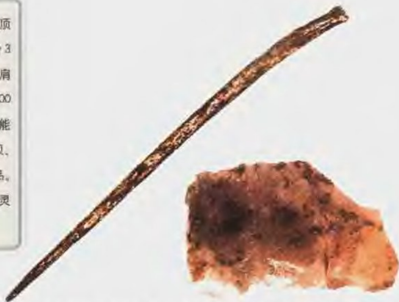
出土的82毫米长的骨针，表明山顶洞人已经能够把兽皮穿缀起来缝制衣服。穿孔小砾石也是山顶洞人的装饰挂件。

旧石器时代 旧石器是用打制方法制成的石器，人们用这种工具打猎、分割兽体。伴随旧石器出土的往往有灰烬或炭粒，据此可知人们已经学会用火。根据与人类化石共生的其他古生物化石，可以使我们了解到当时的生态环境。旧石器时代距今约250万-1万年，人们聚群而居，到了后期则产生了母系氏族社会。约公元前8000年新石器时代开始。