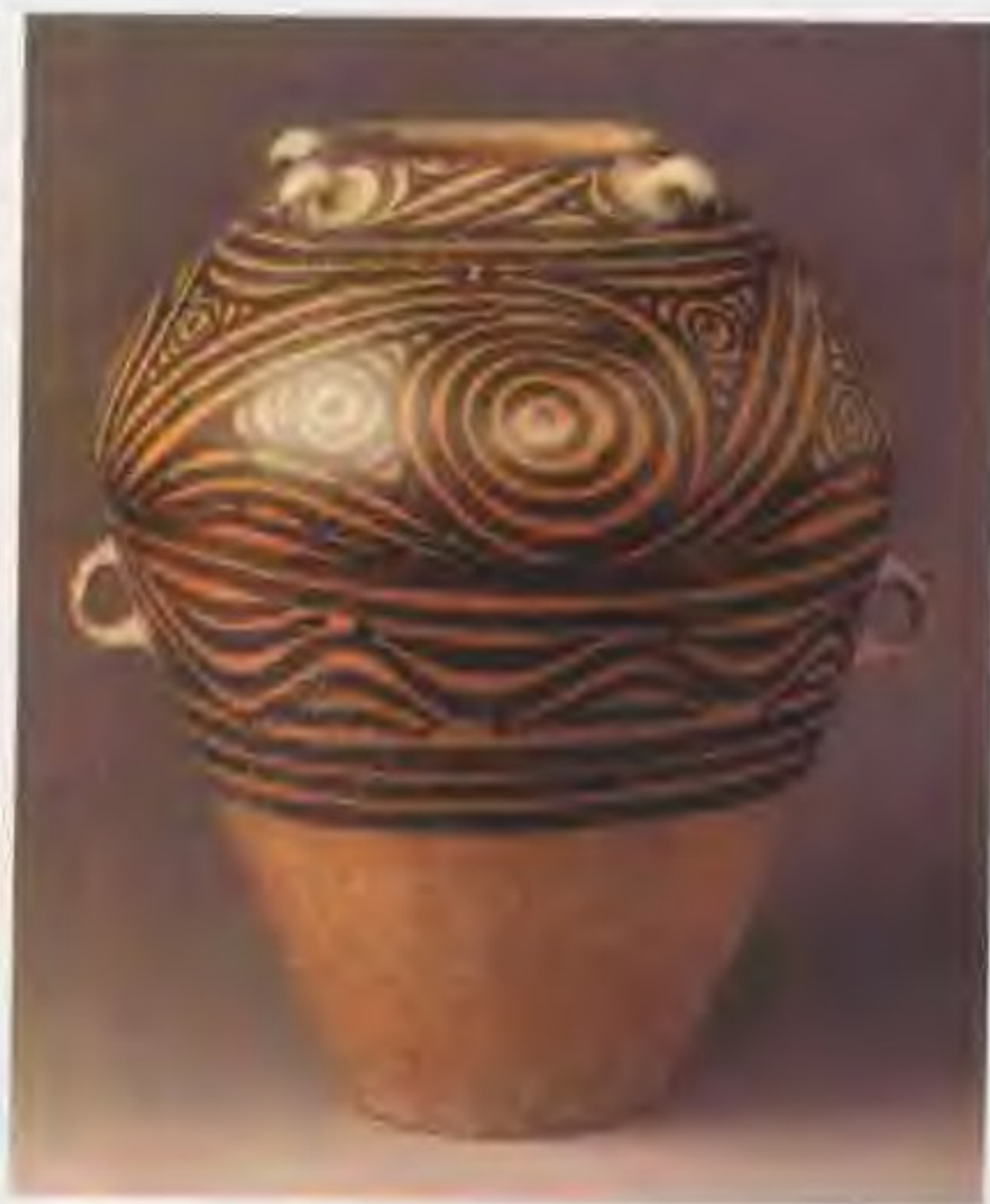
1956年在甘肃永靖二坪村采集到的马家窑文化彩陶罐，高51厘米，泥质红陶，黑褐色彩，流水波纹与水波纹图案。

彩陶 仰韶文化和马家窑文化的彩陶十分优美。彩陶是在陶坯上用彩料绘制图案后烧成的，彩料以黑褐色、紫红色为主，图案多数是动植物、几何纹，陶坯通常用慢轮修整，质地细腻。烧制温度一般在900度左右。彩陶文化主要分布在陕西、河南、山西、甘肃、青海等地，后来传播到长江流域。