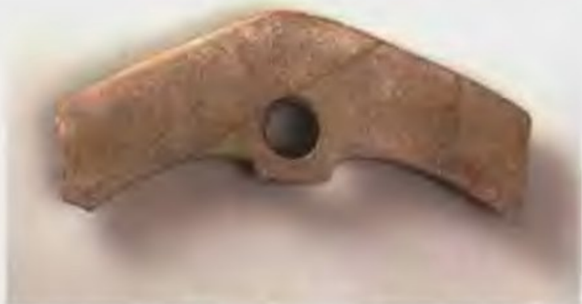
耘田器长18厘米，宽6.5厘米，用于锄草、松土，为锄头的前身，说明当时已经注重农作物生长过程中的田间管理。