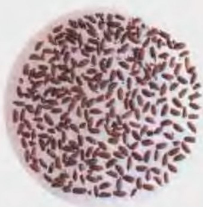
河姆渡文化遗址有成堆的已经炭化的稻谷，是人工种植的水稻。

稻作文化 新石器时代石器的种类较多，有铲、镑、凿、斧、刀、磨盘、磨棒、犁状器、镰等，表明农耕已经出现，长江流域以种植水稻为主，黄河流域主要种植粟子。由于猪、羊、犬、牛、鸡等骨骼的出土，说明人们掌握了家畜饲养方法。伴随农耕文化而起的是制陶、纺织、酿酒技术。绘画、雕刻、音乐、舞蹈等艺术初露端倪。人们开始用刻划、图形记事符号记录生活、生产的各种事务，开象形文字的先声。