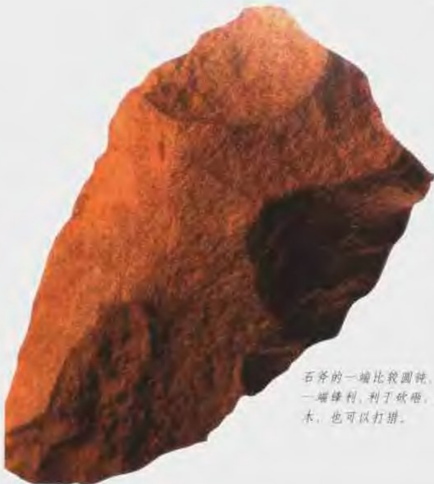
石斧的一端比较圆钝，便于手握，一端锋利，利于砍砸，可以砍伐树木，也可以打猎。

稻作文化 新石器时代石器的种类较多，有铲、镑、凿、斧、刀、磨盘、磨棒、犁状器、镰等，表明农耕已经出现，长江流域以种植水稻为主，黄河流域主要种植粟子。由于猪、羊、犬、牛、鸡等骨骼的出土，说明人们掌握了家畜饲养方法。伴随农耕文化而起的是制陶、纺织、酿酒技术。绘画、雕刻、音乐、舞蹈等艺术初露端倪。人们开始用刻划、图形记事符号记录生活、生产的各种事务，开象形文字的先声。