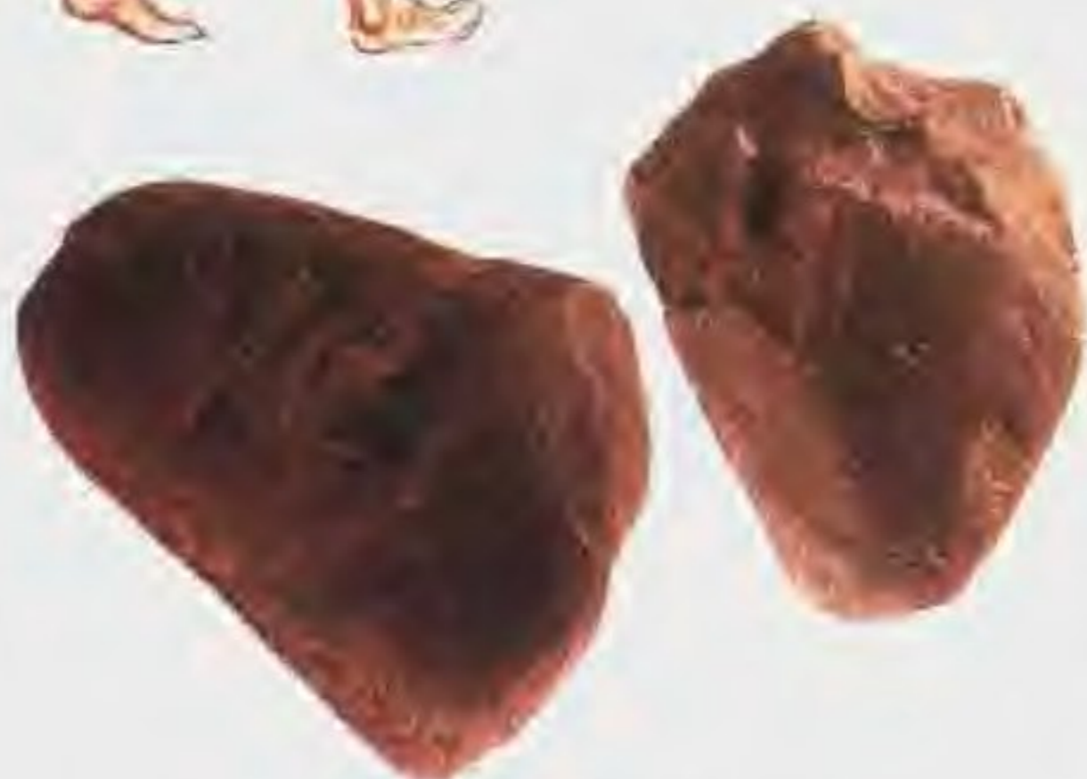
北京人使用的石器显示打制而成

元谋人 元谋位于云贵高原的一个小盆地，有数条发源于高原的小河流流经盆地注入金沙江。雨量充沛，气候温暖，森林密布，适宜多种动植物的生存。约在170万年前元谋人生活在这里。他们直立行走，靠采摘自然生长的果实谋生。不穿衣服，可能住在山洞里。他们学会了用火，会制作简单的石器。有时全体出动，有的举着火把，有的手握棍棒或锋利的石块，围着几头野兽，叫喊、追打。被围的野兽或被灼伤，或被击破皮肉，又惊恐又伤痛，心力俱衰地倒下，任人宰割。元谋人拉开了中国历史的序幕。