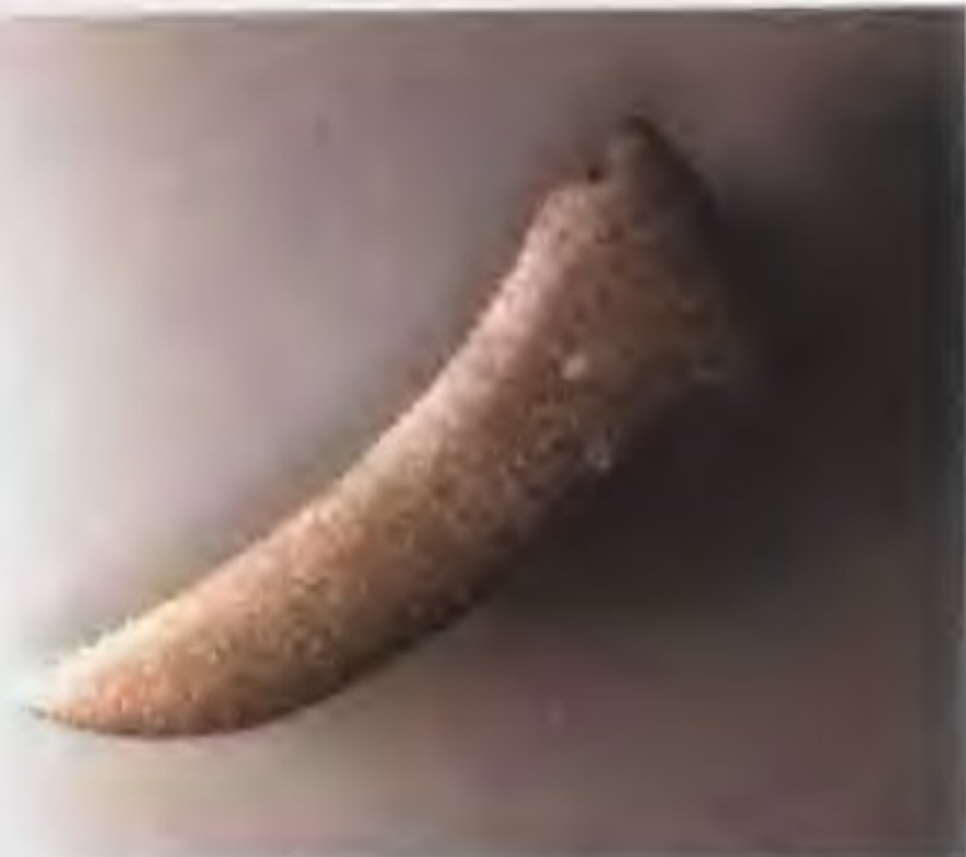
石镰长20.6厘米，宽6厘米，它反映了当时的收割已经由镰收改为裸收，不仅加快了速度，而且能利用秸秆。