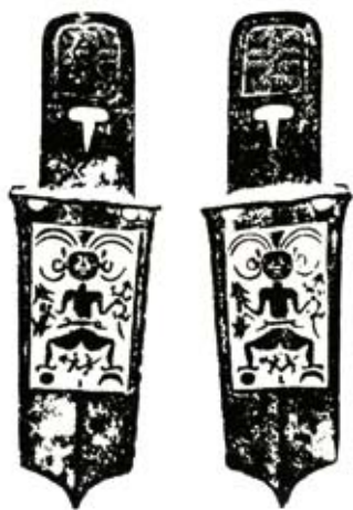
✿“兵避太岁”戈浮纹像拓片。“兵避太岁”戈为巴蜀式铜戈，是避兵的法器。