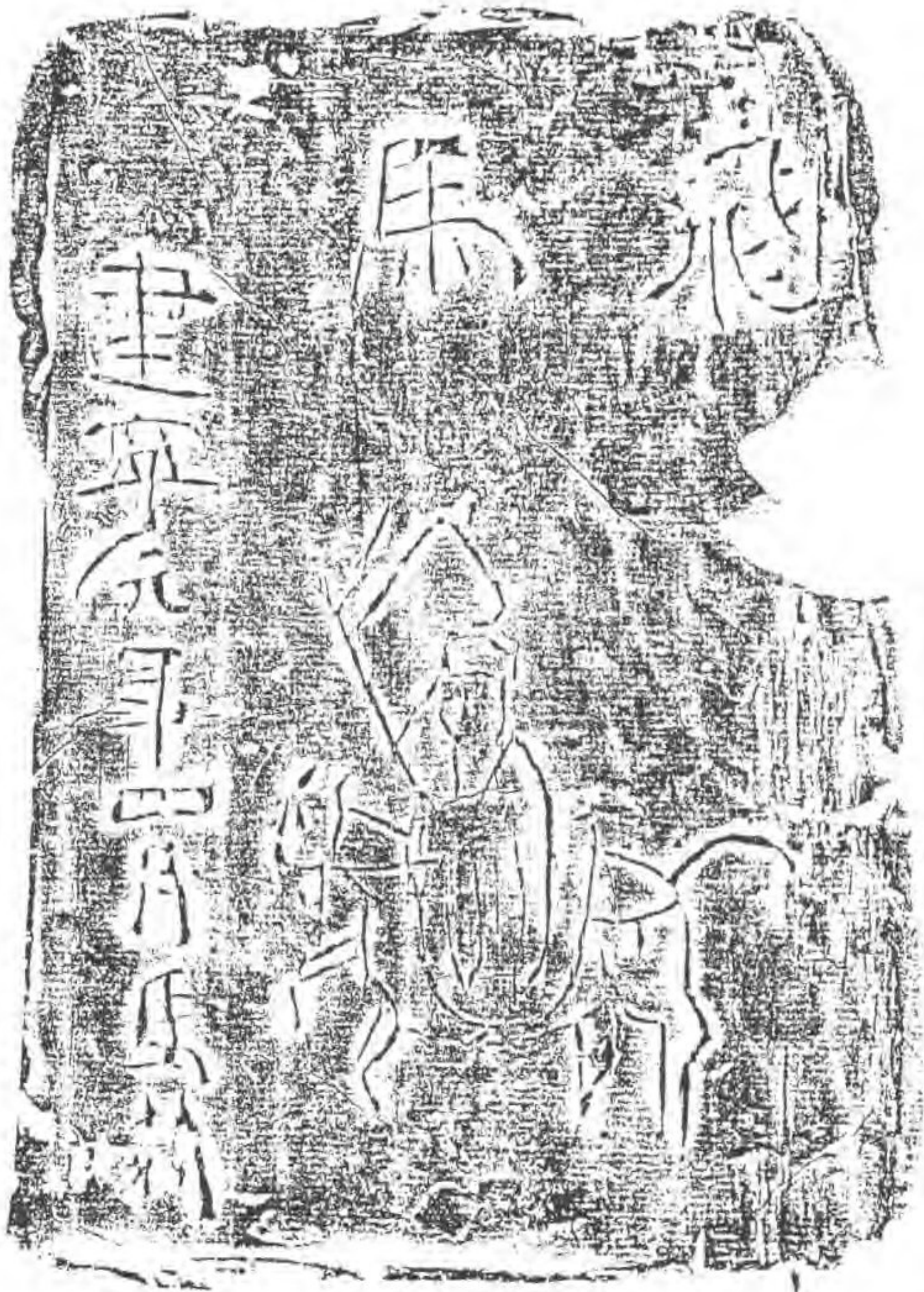
東漢建寧元年四月磚