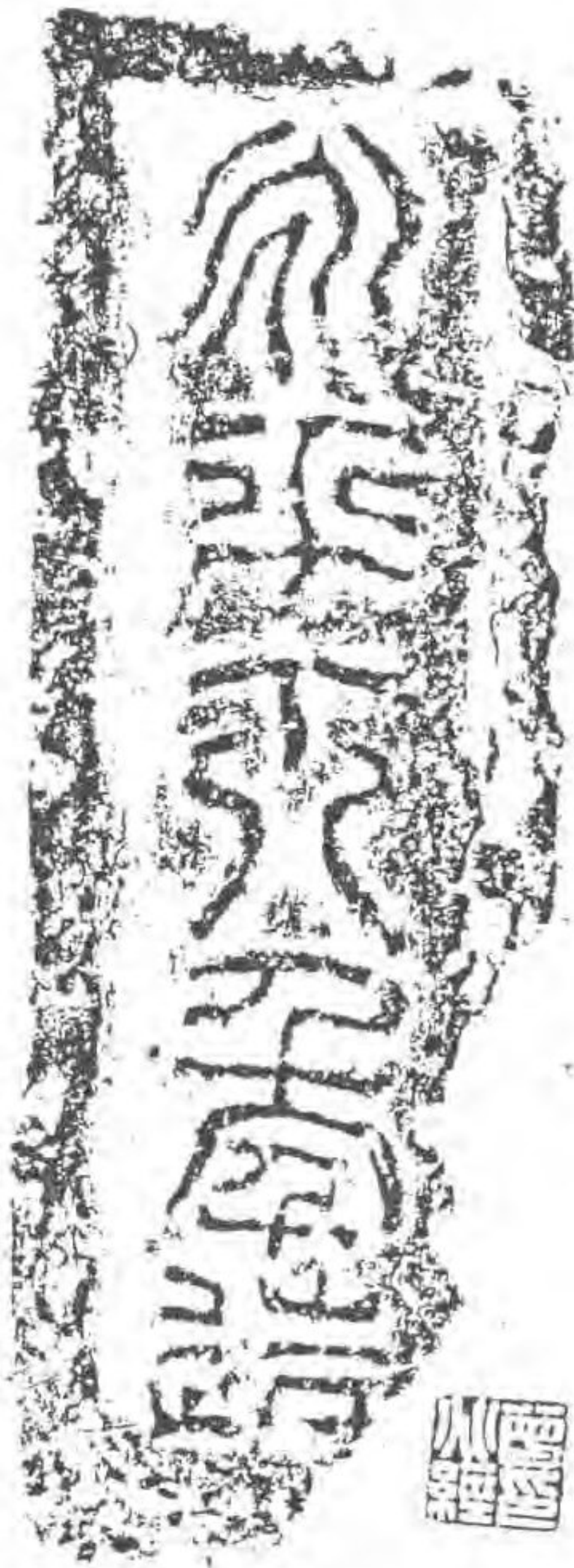
東漢永平十八年磚