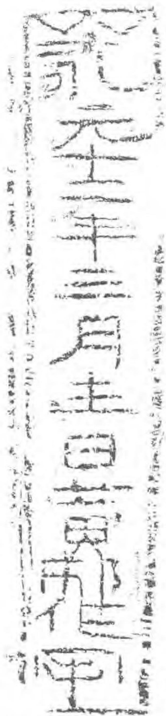
東漢永元十二年碑