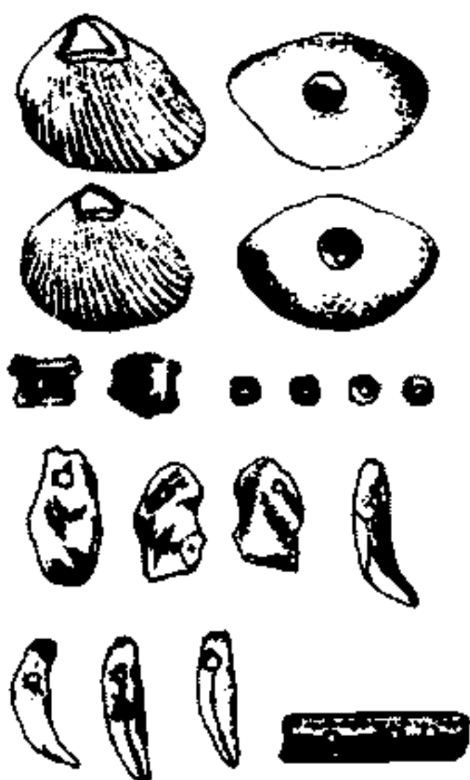
图1 北京房山周口店山顶洞人（距今二万五千年）所使用的串饰。

首饰的文明生活。在我国已公布的全国七千余处较大规模的新石器文化遗址中，几乎都有纺纱捻线的原始工具石纺轮。在河姆渡文化遗址及龙山文化遗址都发现过织布的工具骨梭、木机刀及机具卷布轴等。