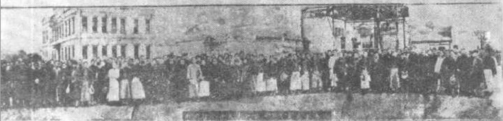
1926年12月湖南省第一次农民代表大会代表合影