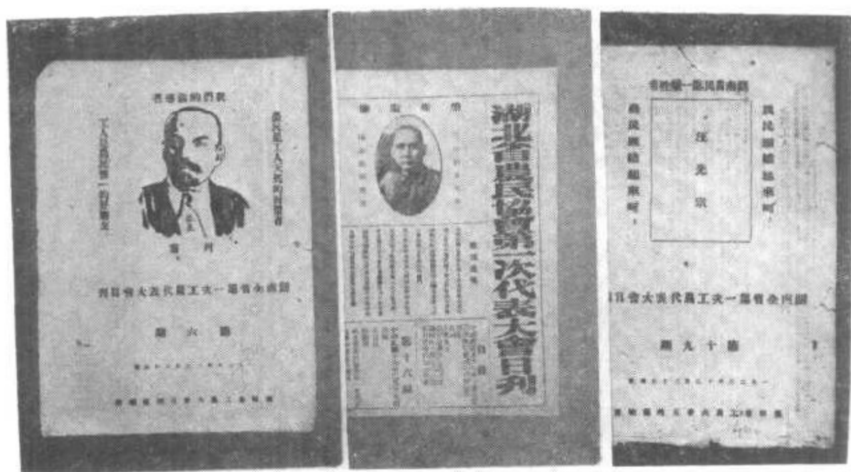
1926年12月湖南全省第一次工农代表大会日刊