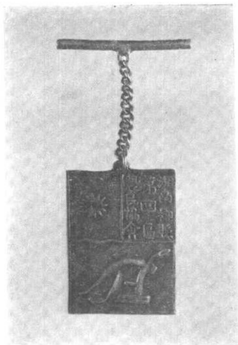
湖南郴县第四区农民协会铜质证章