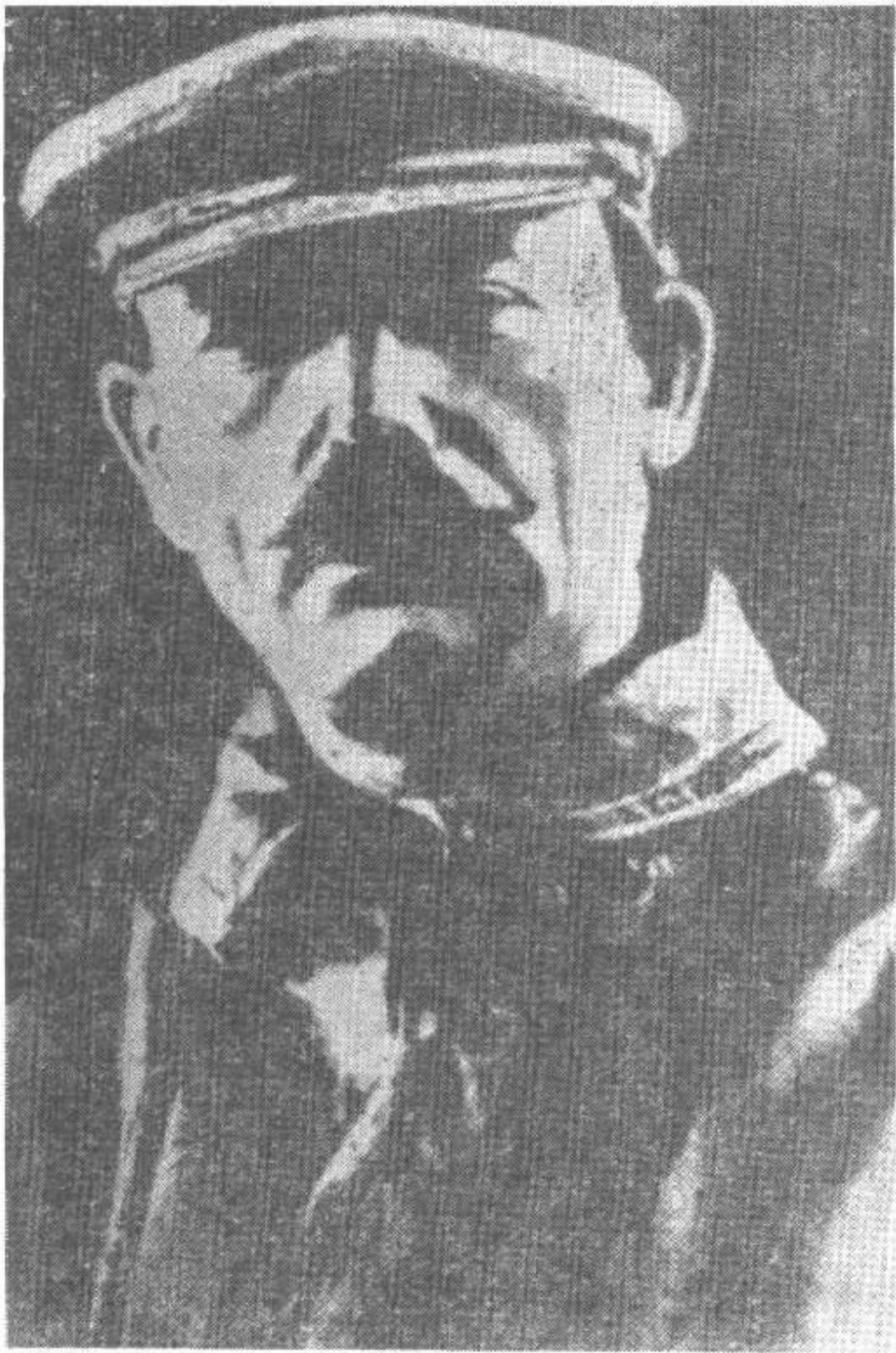
1927年9月回莫斯科后的鲍罗廷