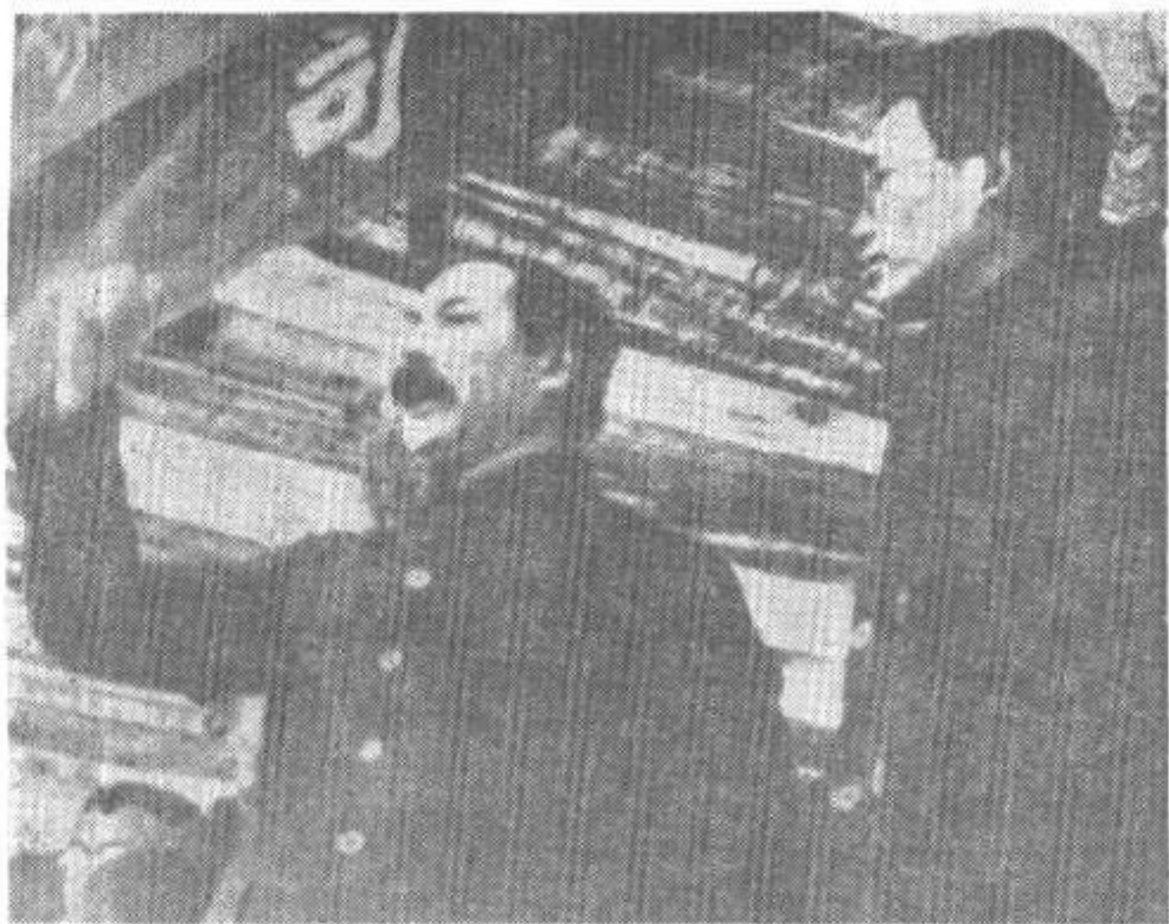
鲍罗廷 在武汉群众大会上 演说 (1927年)