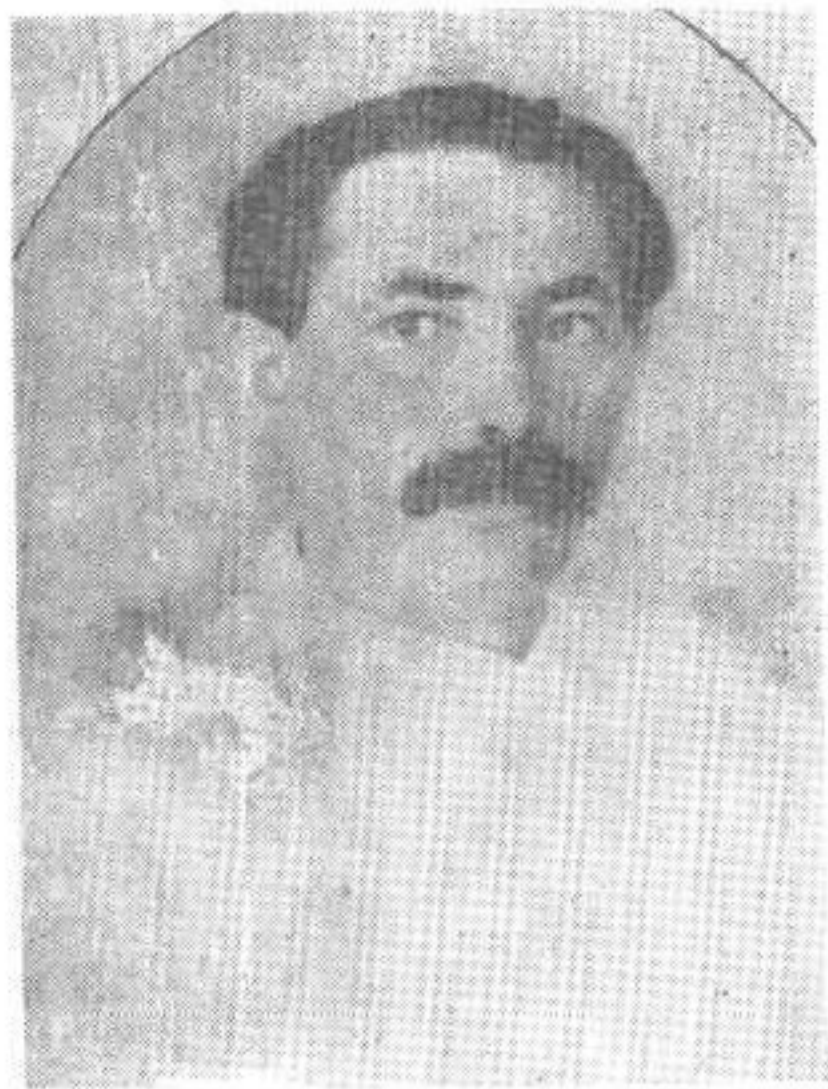
在广州时的鲍罗廷（1925年）