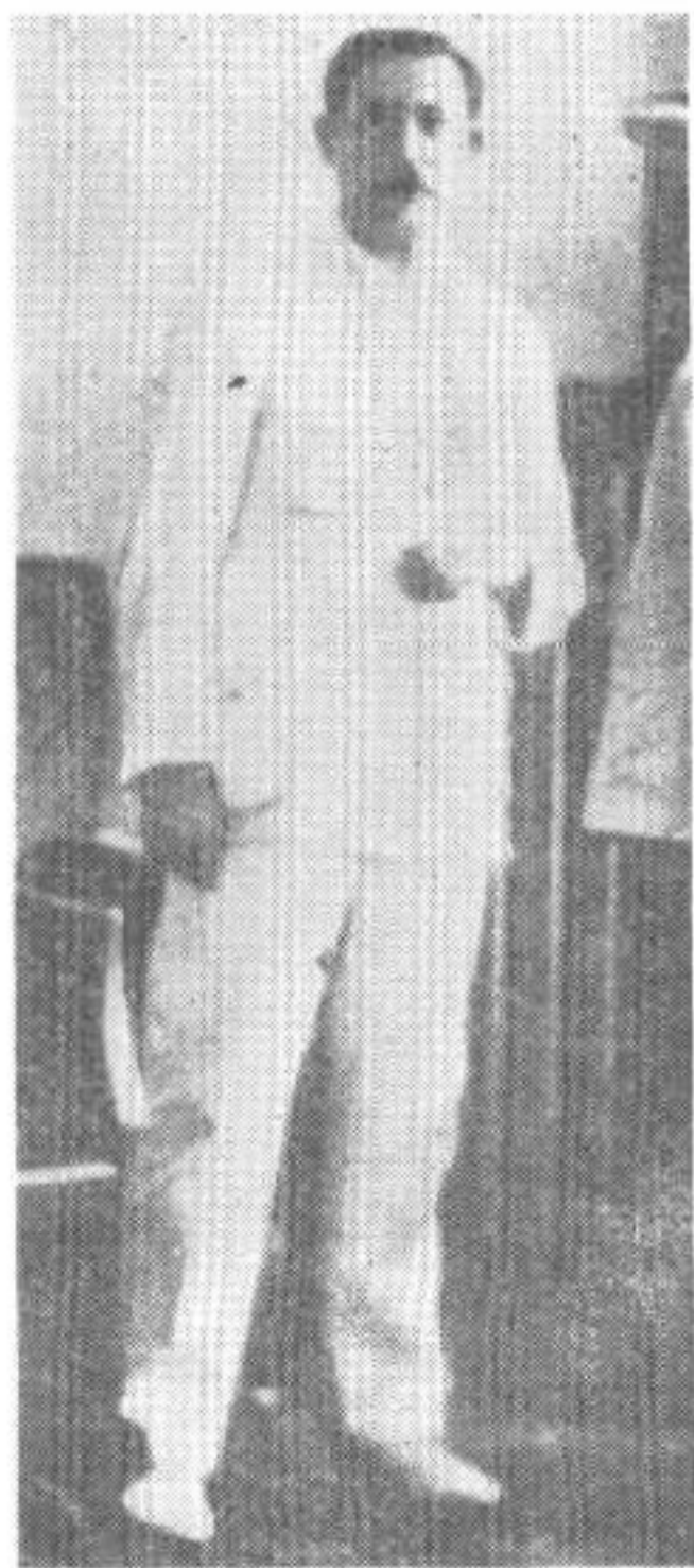
鲍罗廷在武汉住所，左臂因 骑马摔伤 (1927年)