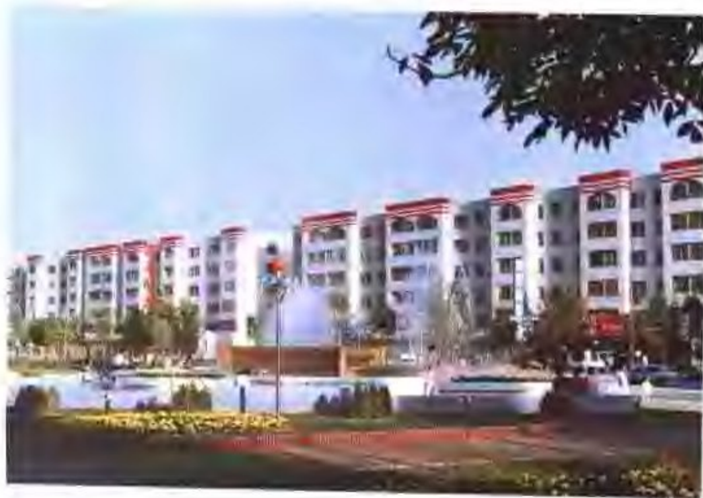
包头居民住宅小区 外景

生物高技术工程 内蒙古有丰富的地产植物资源，麻黄、甘草、党参、沙棘、枸杞、苁蓉等，还有丰富的动物骨脏资源，要充分发挥这些资源优势，利用生