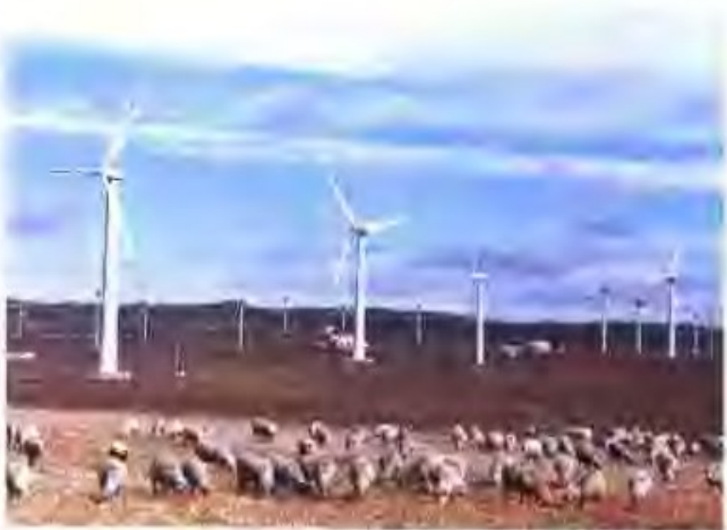
内蒙古风力资源占全国1/3，年发电量54亿千瓦时

个经济区。在对内经济联系上，承东启西，既与西部地区构成密不可分的经济发展整体，又与东中部地区形成比较紧密的经济技术合作关系，是东中部地区的资源腹地，直接融入东中部区域市场体系。在对外经济联系上，内蒙古已开通满洲里、二连浩特等18个边境陆路口岸，是“第二个欧亚大陆桥”的“桥头堡”。1978年改革开放以来，内蒙古坚持“北开南联、服务全国”的方针，边境贸易和