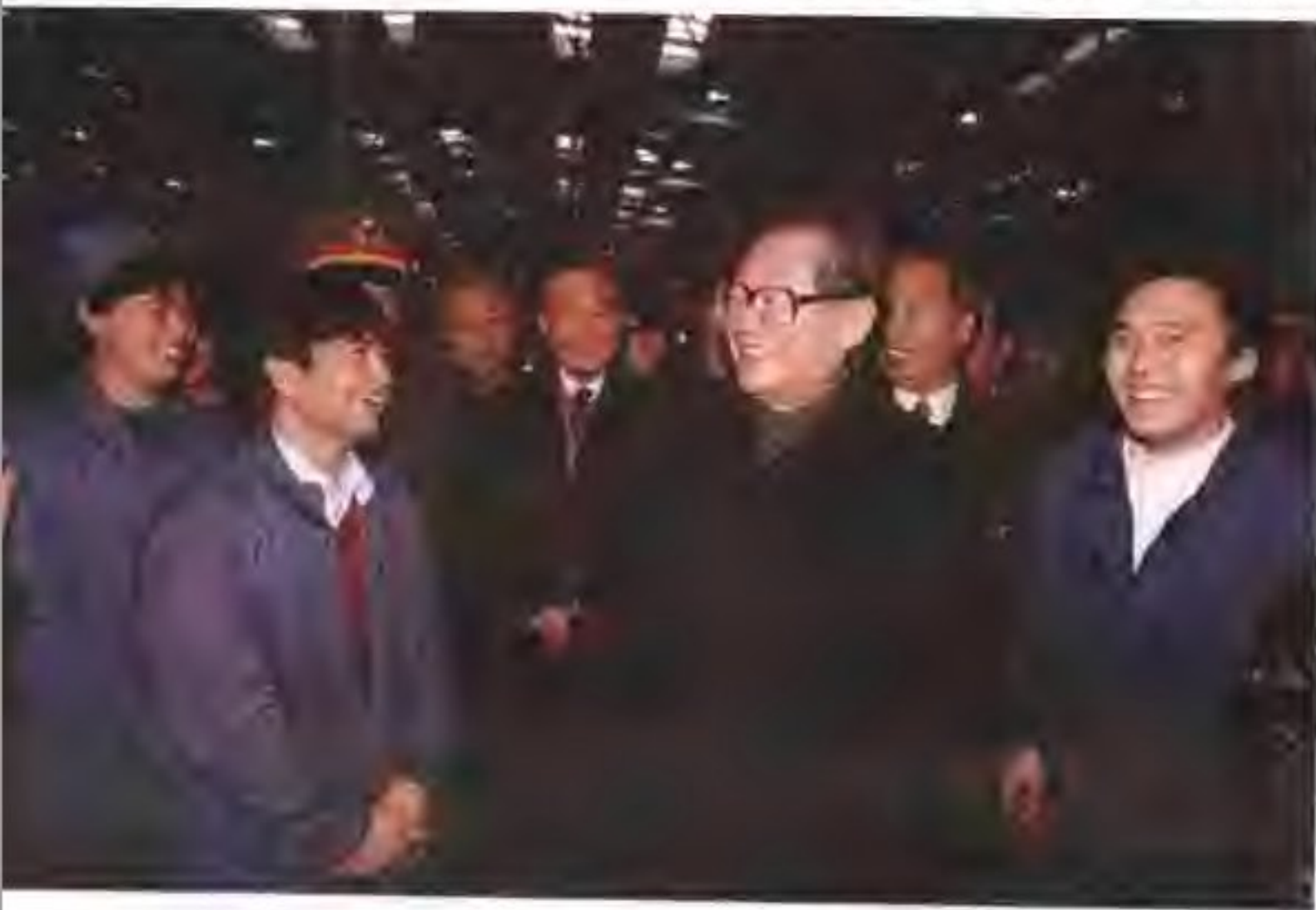
1999年6月29日，江泽民主席视察包头北方奔驰重型汽车厂。