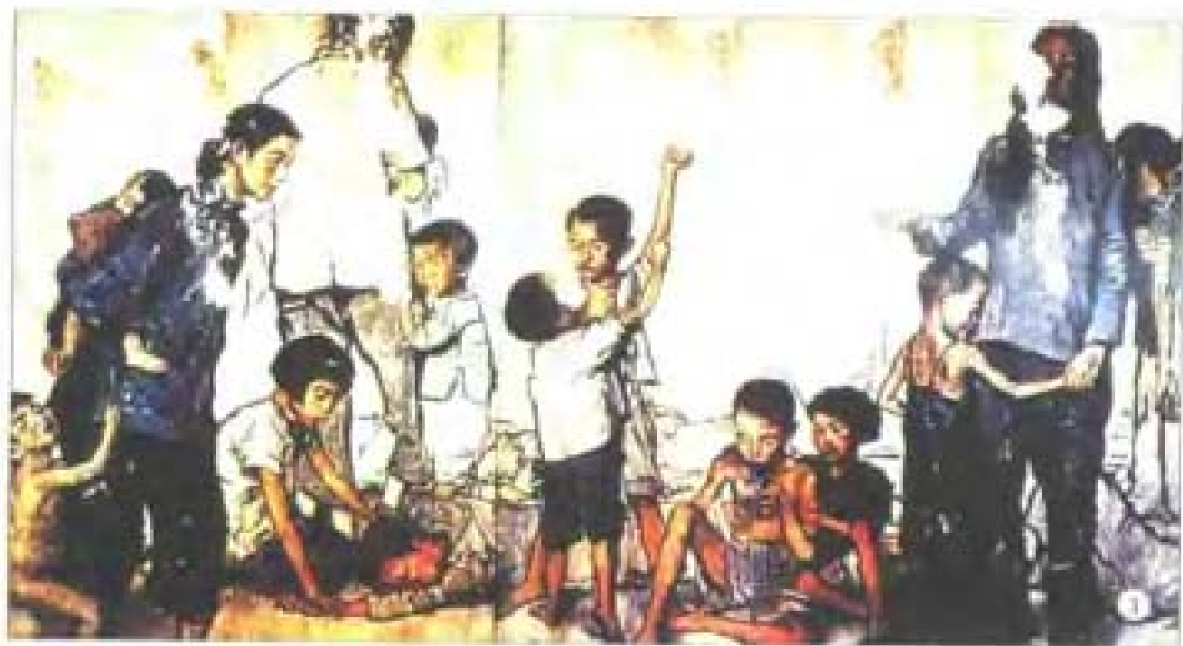
◎ 袁忠恺《胡同孩子在玩》