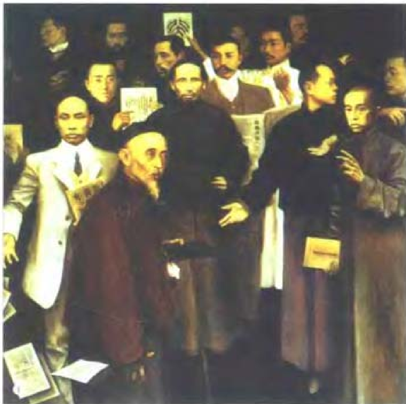
◎ 袁文生画袁世凯等 ◎ 刘青寒 袁世凯与白朗 ◎ 徐行书之章