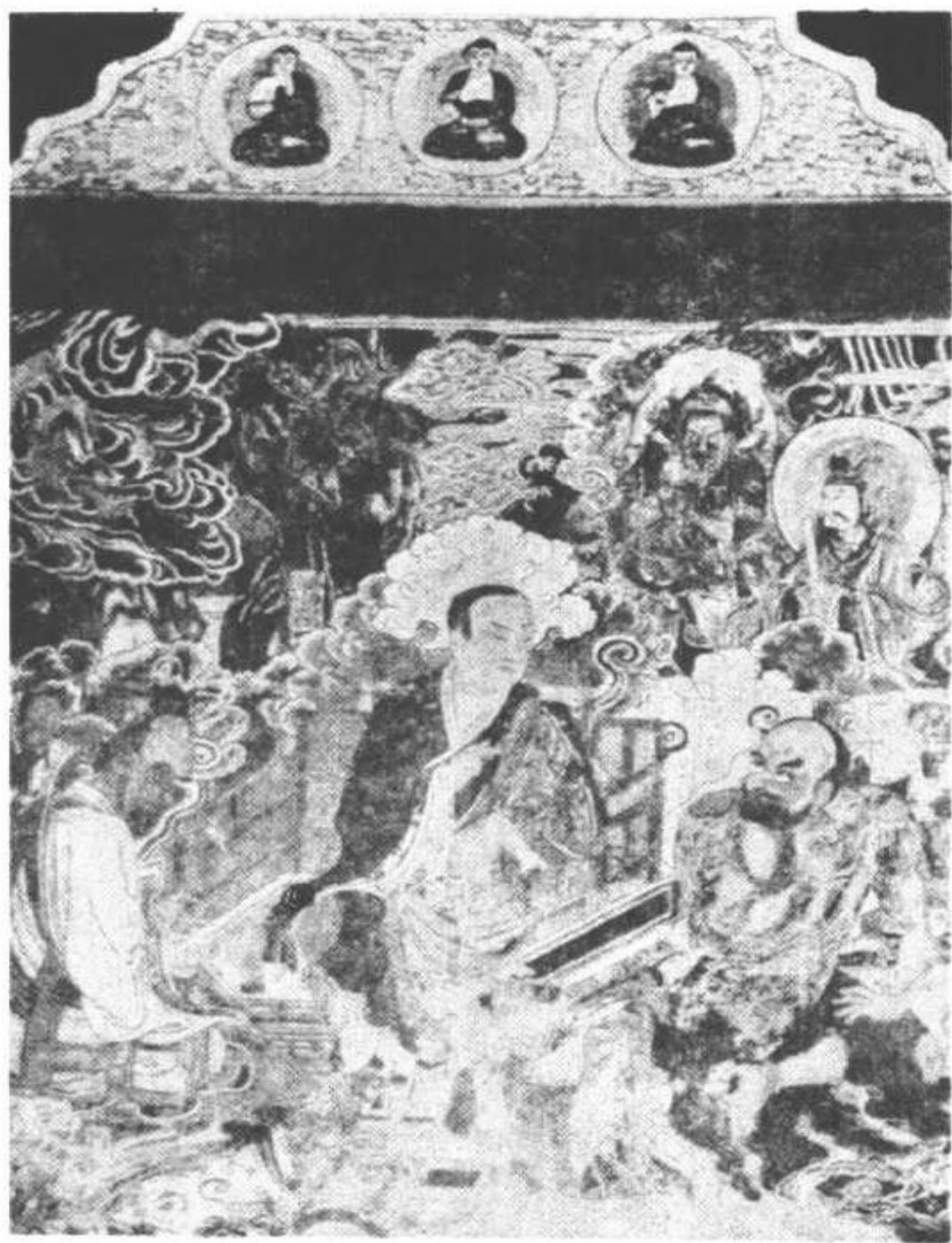
第八圖 四川蓬溪縣寶亮寺古壁畫