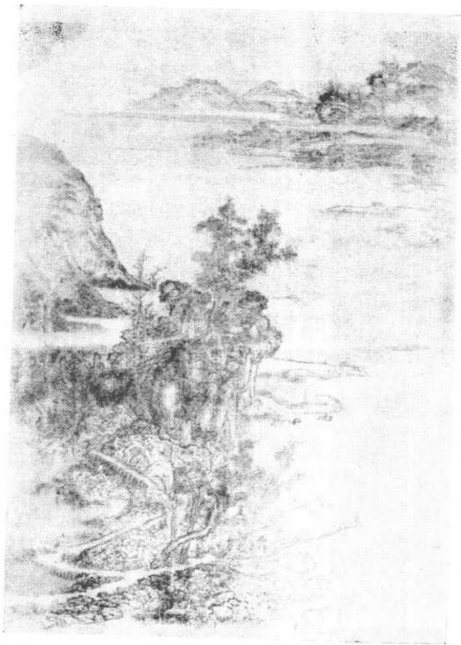
第九圖 五代荆浩山水