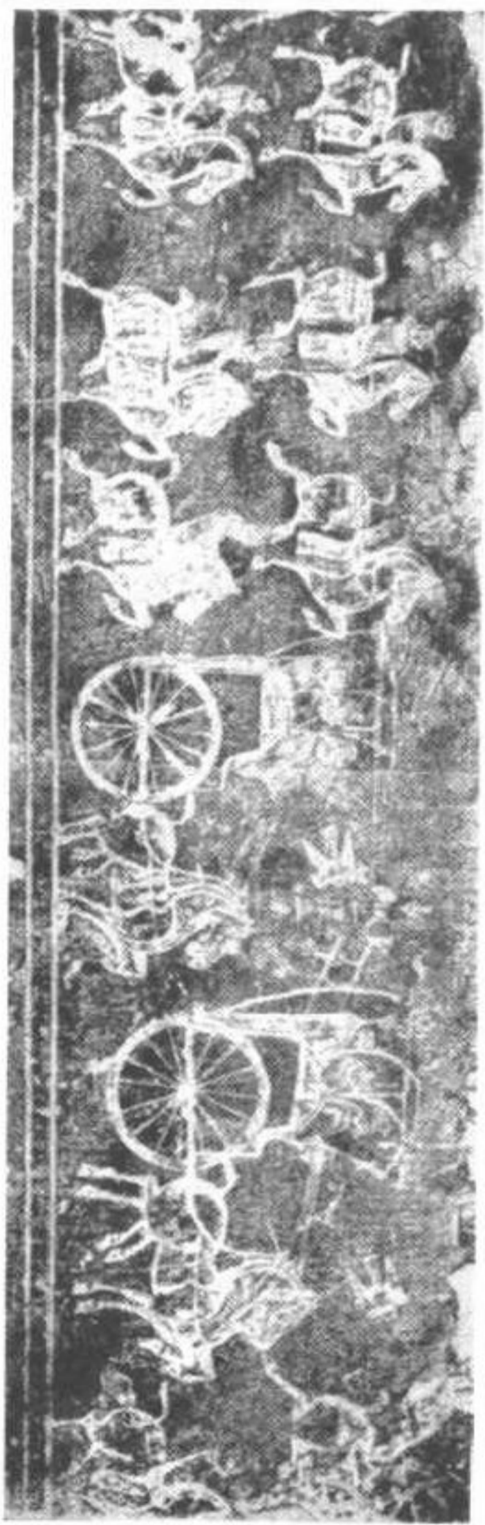
刻石山堂孝漢圖一第