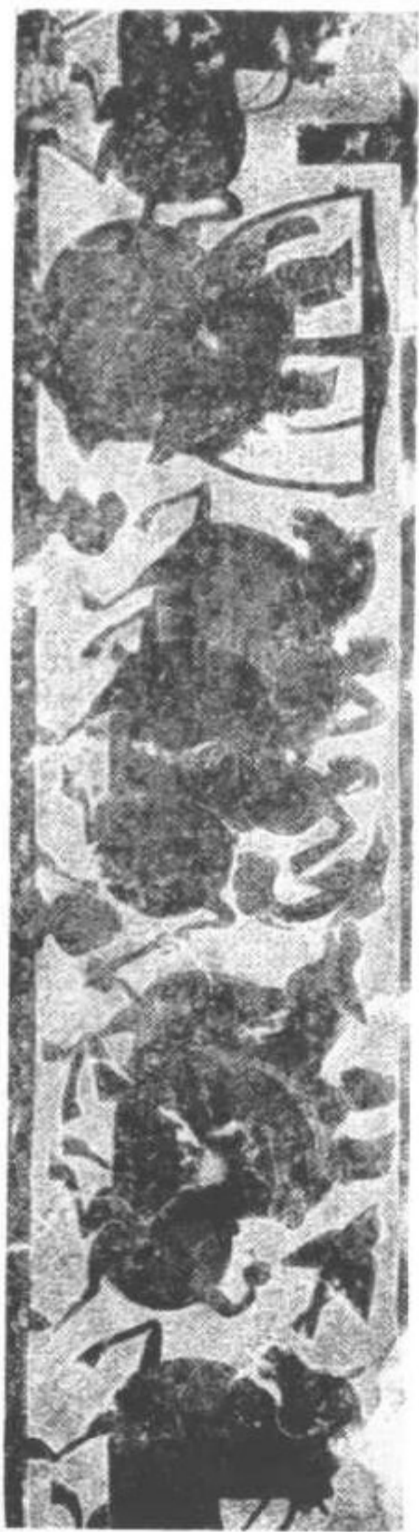
刻石祠梁武漢圖二第