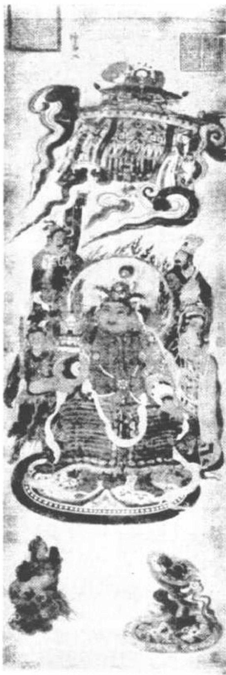
第五圖 唐尉遲乙僧天皇像