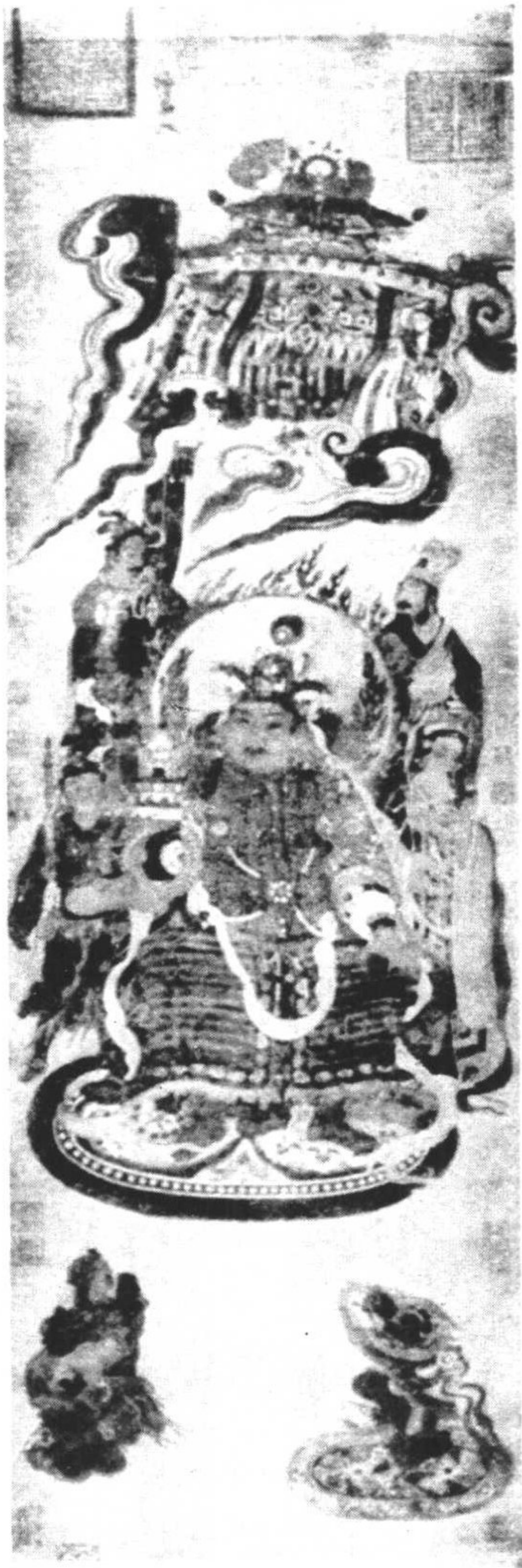
第五圖 唐尉遲乙僧天皇像