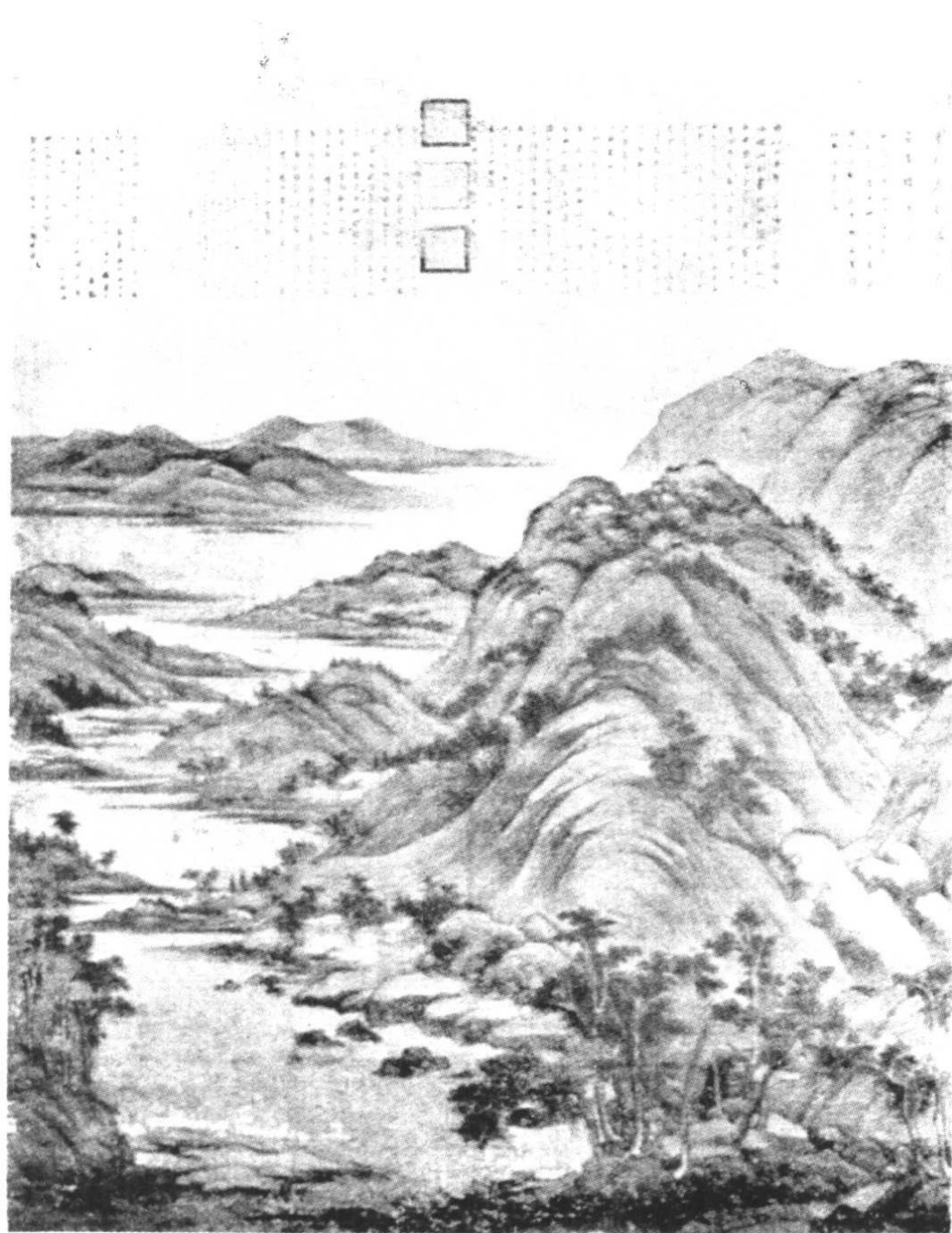
第十圖 宋董源龍宿郊民圖