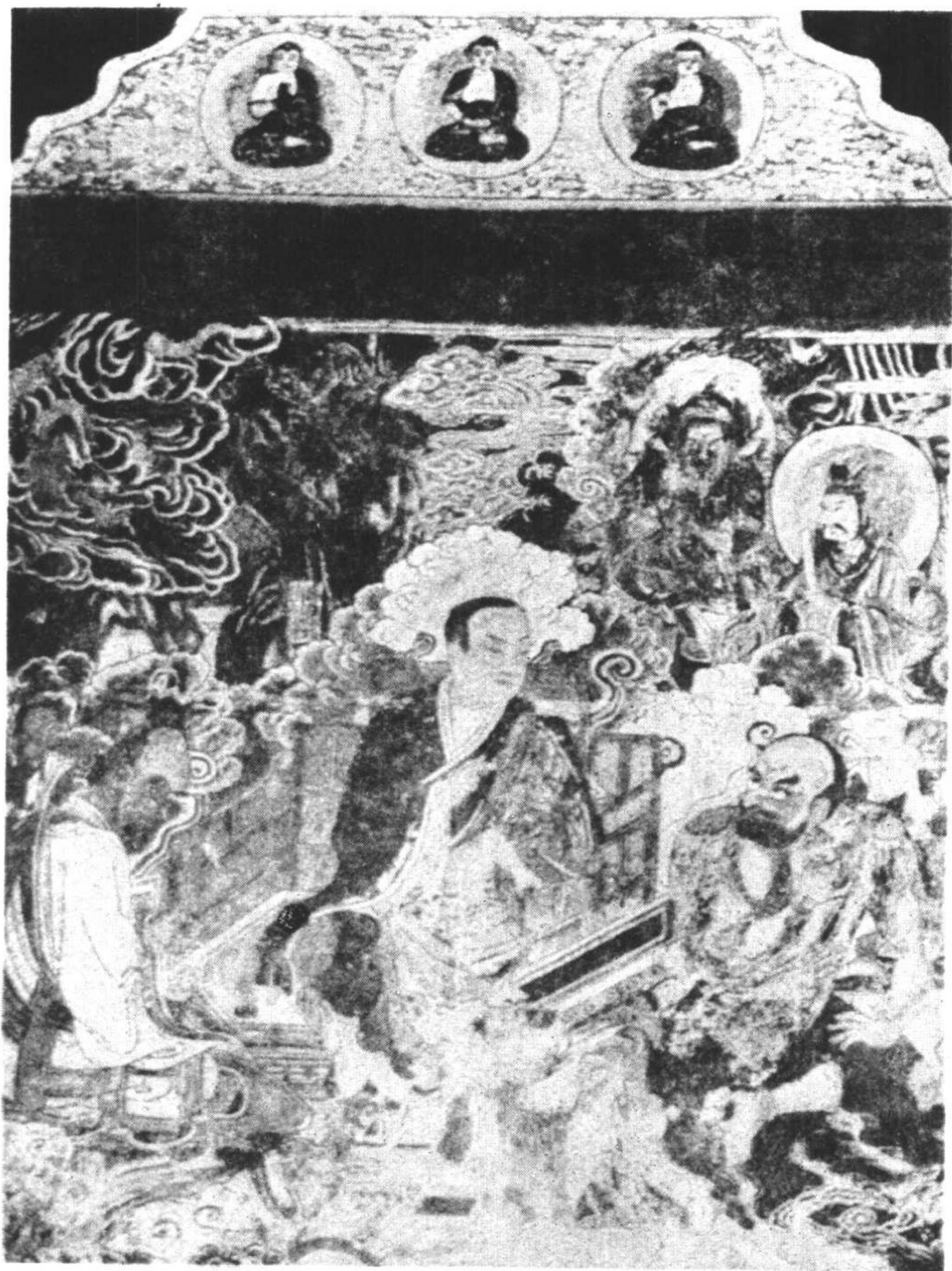
第八圖 四川蓬溪縣寶亮寺古壁畫