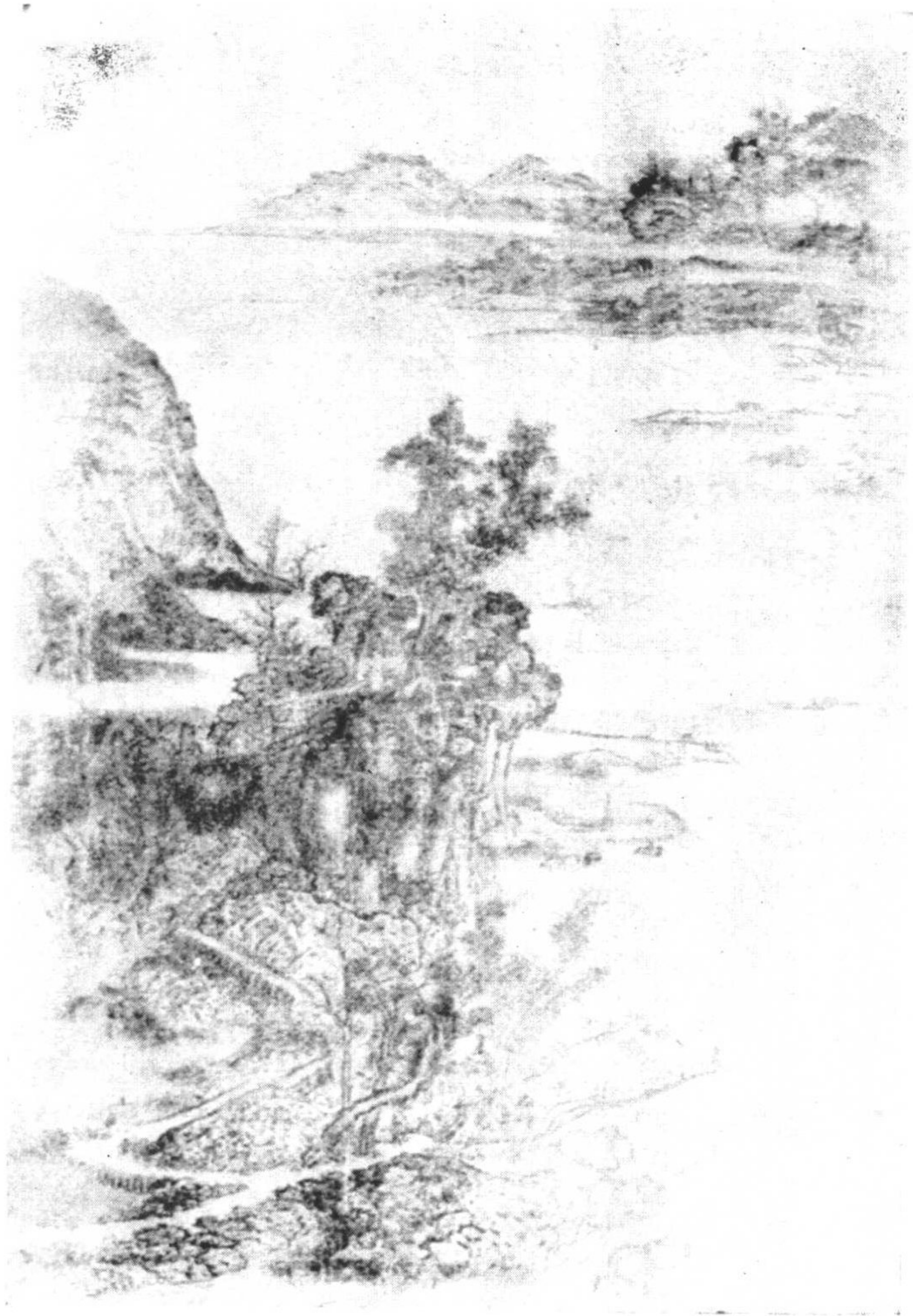
第九圖 五代荆浩山水