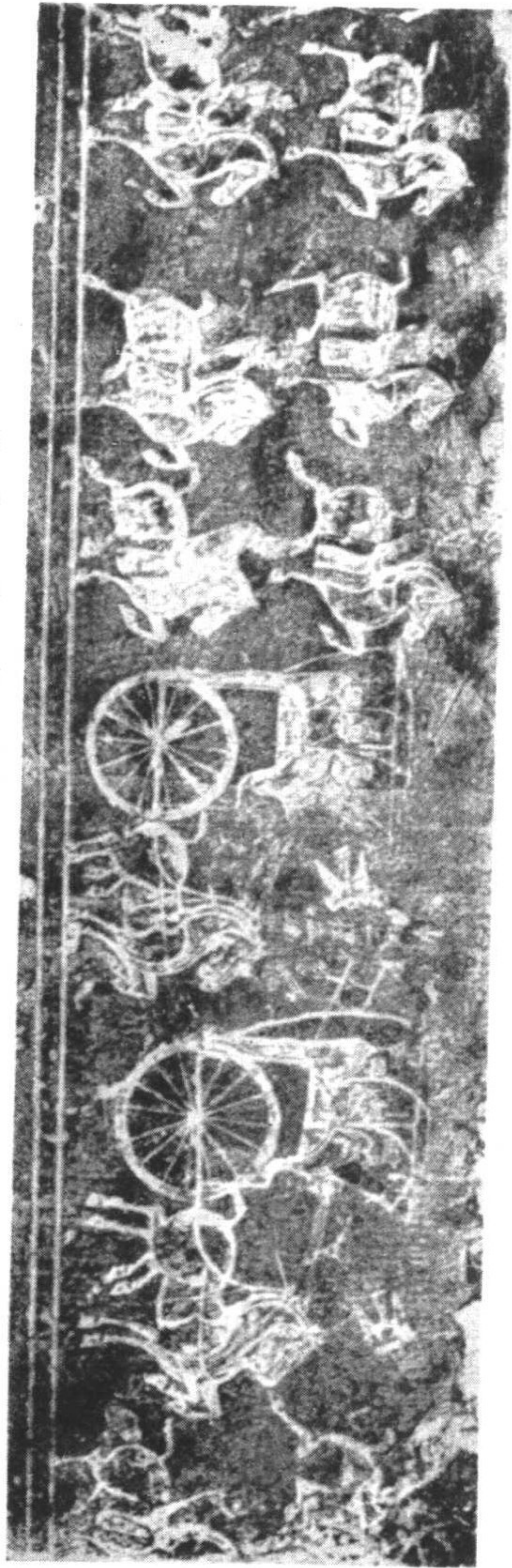
刻石山堂孝漢圖一第