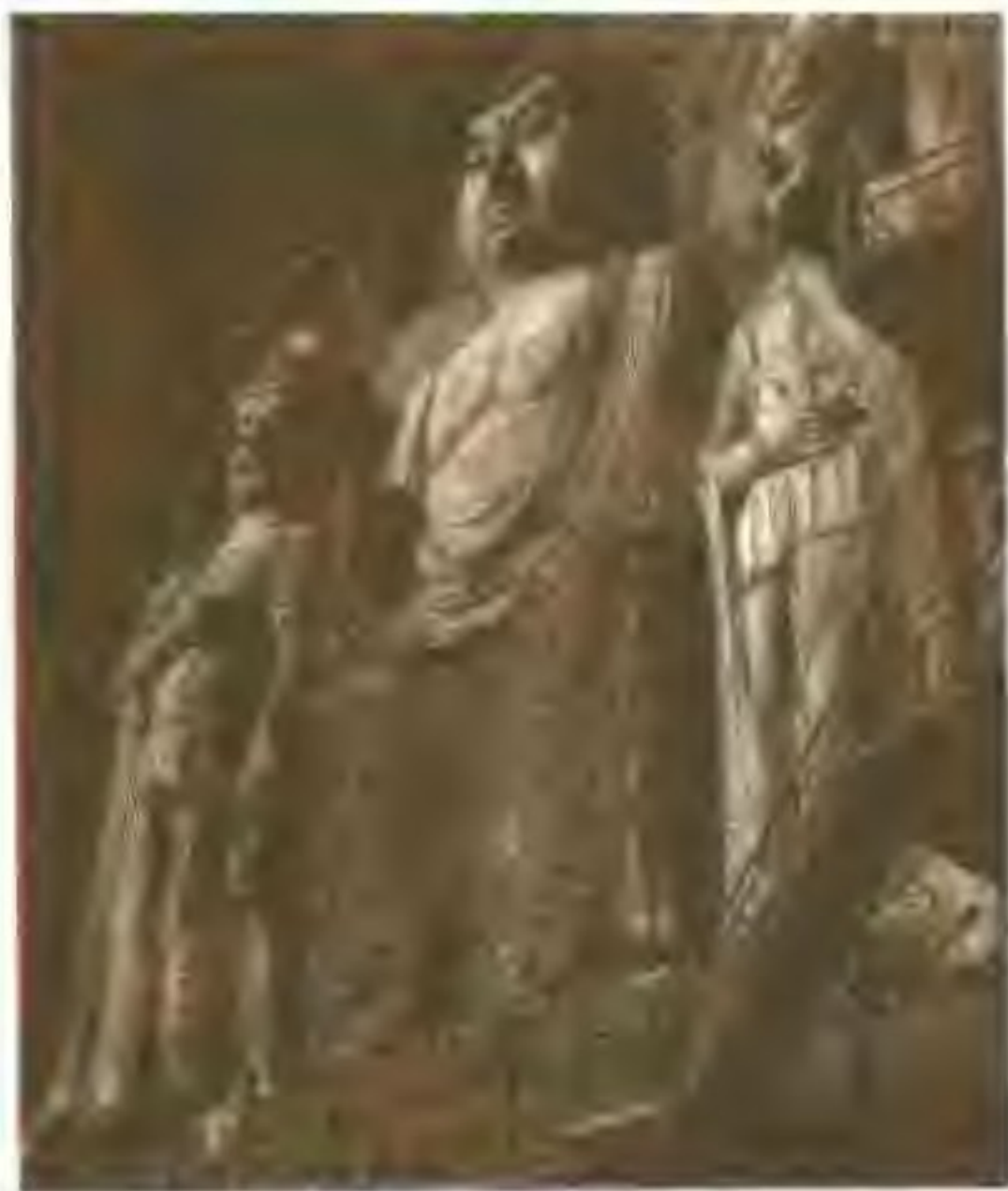
隋代赵州桥的浮雕

石板加楸，在券和楸之间又加若干横向铁条把各券拉在一起。可见李春在拱桥建造工艺上费了不少心思进行革新创造。赵州桥是我国古代跨度最大的单孔桥。但它的桥面坡度却十分低缓，这当然和设计者的独具匠心分不开。在此之前，我国石拱桥高度与跨度的比一般为1:3，为了利于车马通行，李春等匠师把比例改为1:5，即从拱顶至拱脚仅高7.23米，而拱券跨度达37米多，使桥面几乎没有坡度，整座桥看上去轻盈利落，简洁明快。李春等工匠还在