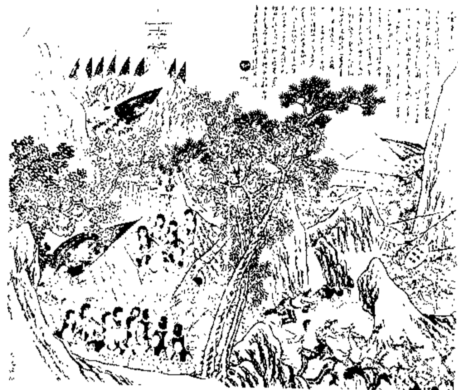
台湾军民抗击日军侵略