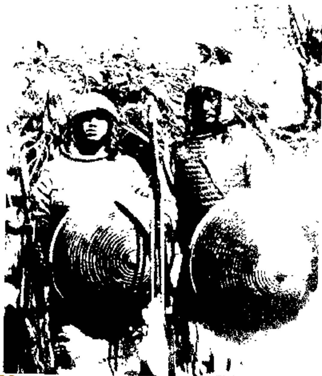
1904年抗击英军侵略 西藏的藏族战士