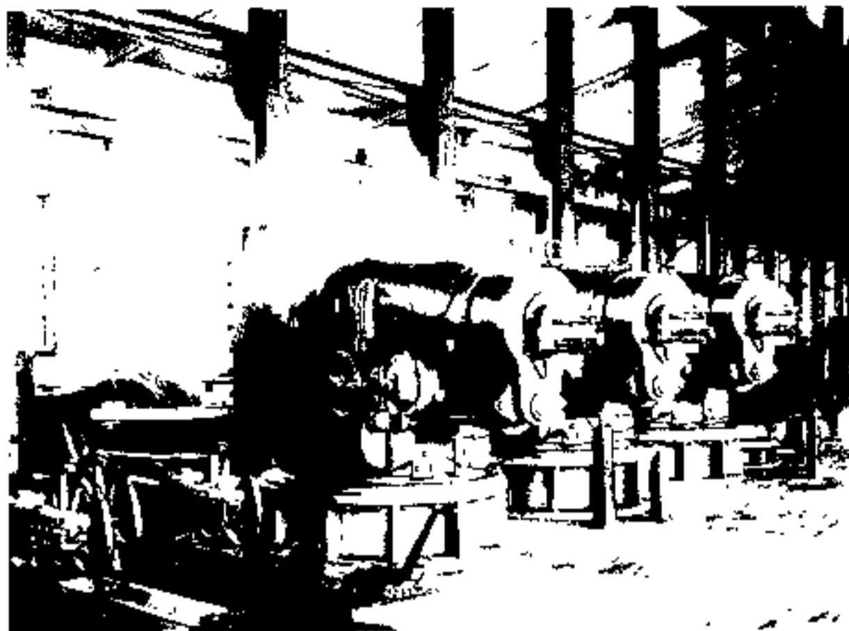
江南制造总局炮厂