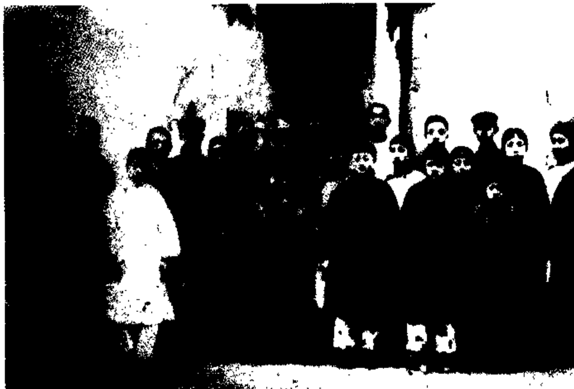
上海爱国女校师生