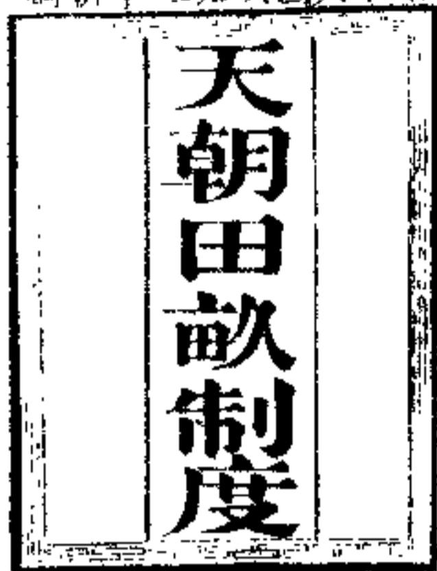
《天朝田亩制度》封面