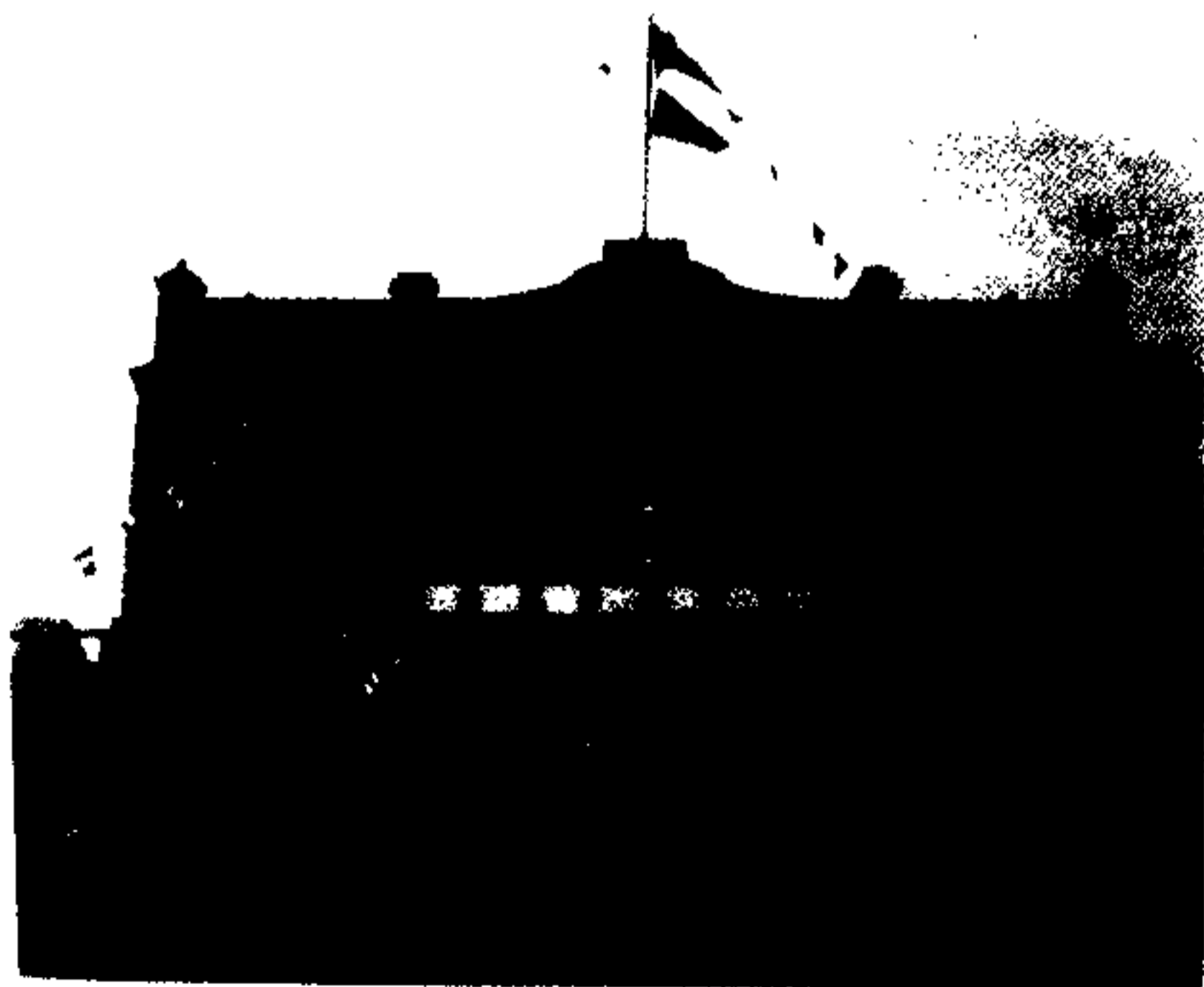
清朝户部银行大清银行哈尔滨分行(1910)