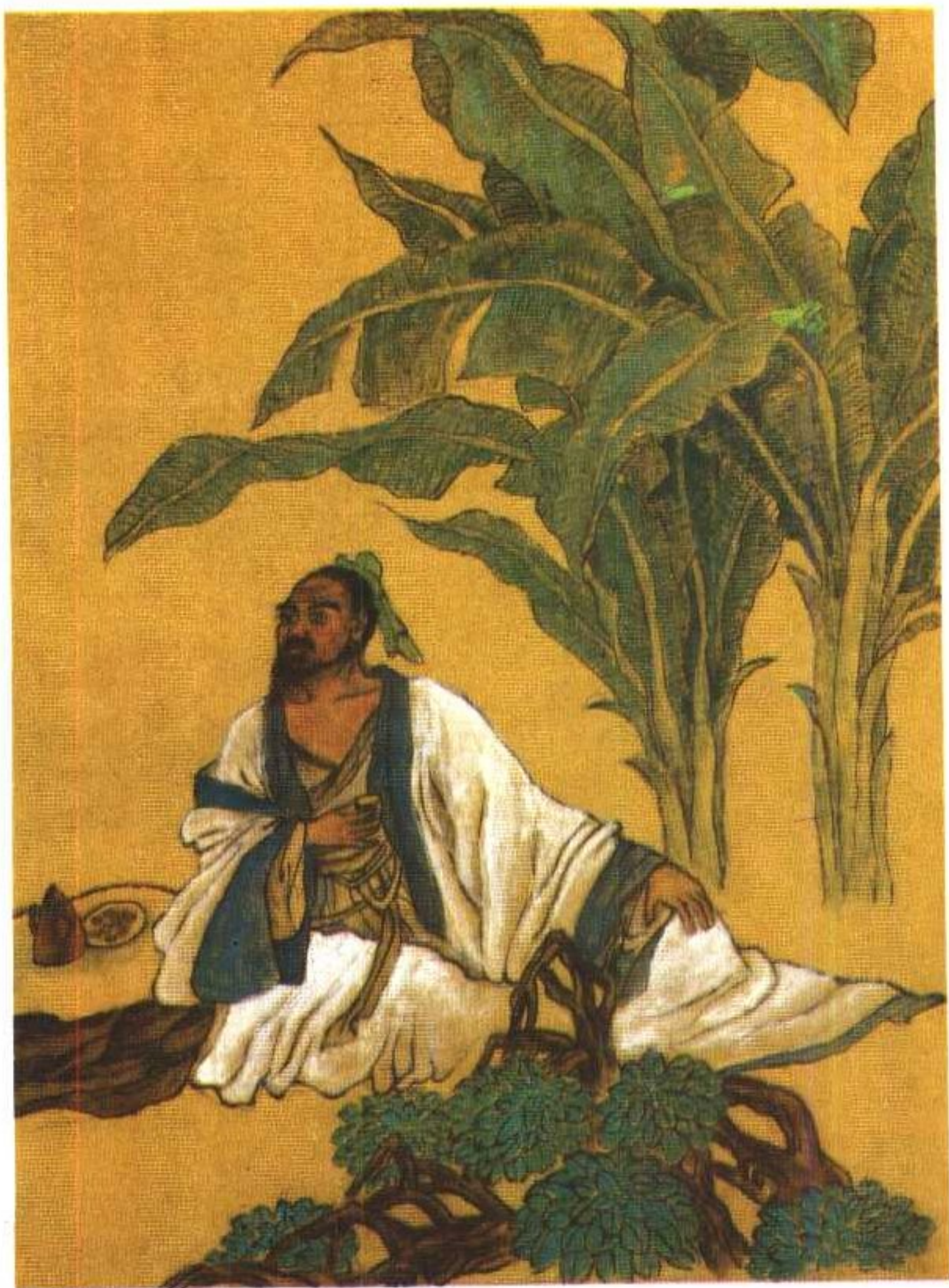
阮籍饮酒图 唐建绘