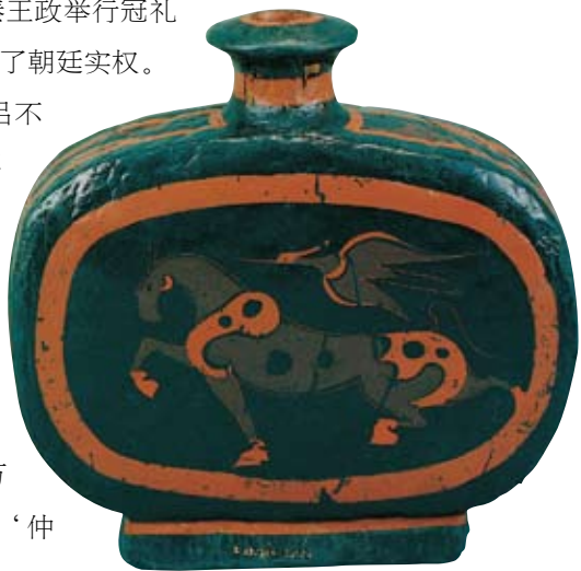
· 彩绘牛马纹扁壶 ·

除掉了嫪毐，秦王的下一个目标就是吕不韦。秦王政十年（前237），吕不韦因为嫪毐案的牵连，被罢免了丞相职务，凄凄惶惶回到封地洛阳。然而他名声在外，虽然闲居洛阳，门客依旧上千，各国诸侯还纷纷派使臣来请他出山。秦王政恐怕生出变乱，就写信给吕不韦说：“你对秦国有什么功劳，竟然封在河南好地，食邑十万户？你对秦王室有什么恩情，竟然号称‘仲父’？”勒令他全家都迁居到偏远的蜀地去。