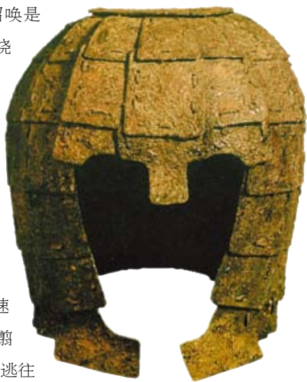
· 河北易县燕下都出土的铁兜鍪 ·

秦王政杀了荆轲、秦舞阳以后，命令王翦快速进兵，攻掠燕地。秦王政二十一年（前226），王翦攻克燕都蓟（今北京西南部），燕王喜、太子丹等逃往辽东地区（今东北地区的沈阳、丹东、营口等地）。