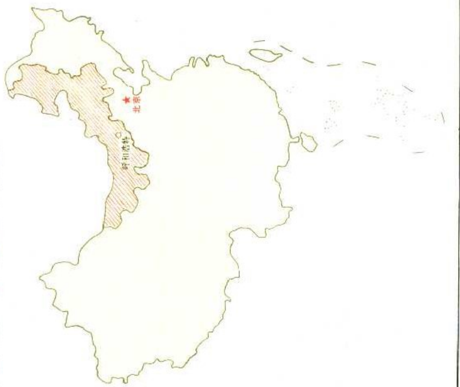
内蒙古自治区在祖国的位置