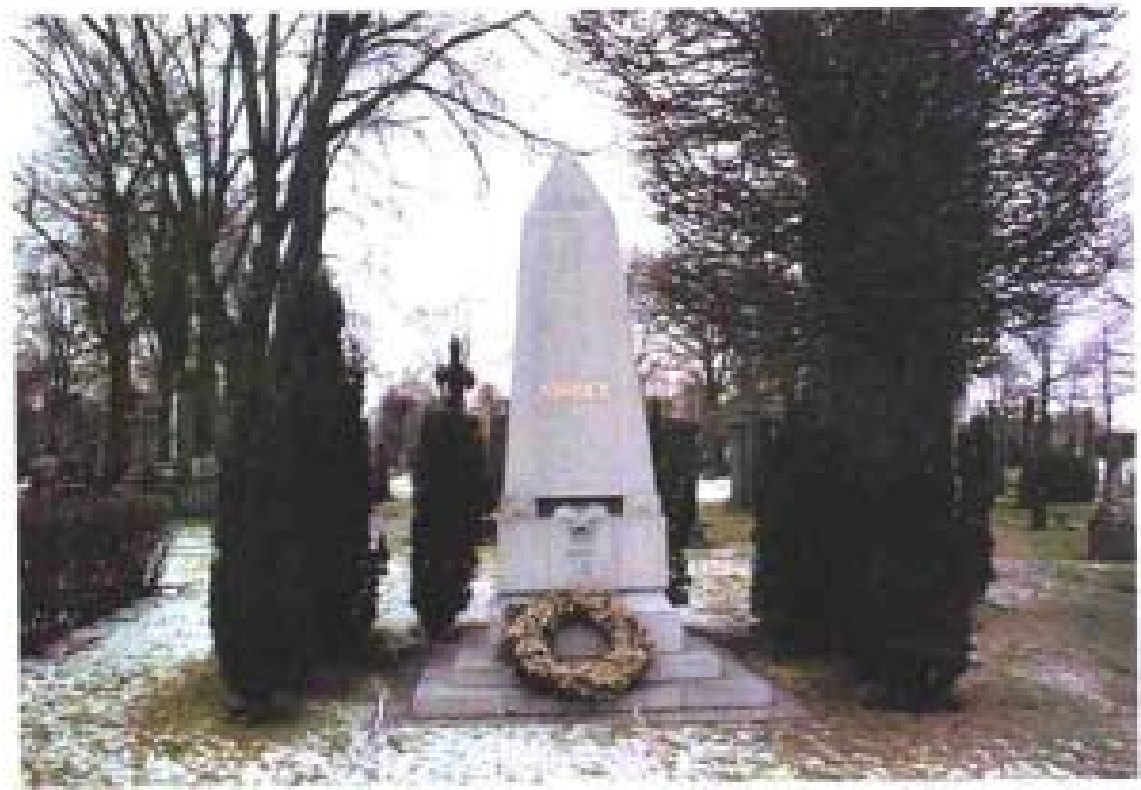
诺贝尔就长眠在这样肃穆的墓地里