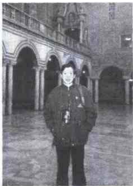
作者在举行“诺贝尔晚宴”的市政厅内

促使我对诺贝尔和诺贝尔奖深入了解的一个重要因素，是在诺贝尔奖设立 100 年的时候，我有幸访问了诺贝尔的故乡——瑞典王国。我用两个月的时间走遍了瑞典王国首都斯德哥尔摩的大街小巷、城镇乡村，找到了许多诺贝尔的痕迹，有的在当地人看来也鲜为人知。特别是站在诺贝尔那极为普通的墓地前，我的心灵被深深地震撼了；我偕夫人及孩子登上斯德哥尔摩音乐厅那颁发诺贝尔奖的大舞台的时候，我憧憬着作为领奖的中国科学家辉煌世界的那一天。回国后，我写了一篇名为《寻访诺贝尔》的文章，被多家报刊刊用或转载。文章在新华社《环球》杂志刊登时，编者加上了按语：“今年是诺贝尔奖设立 100 周年。1896 年 12 月，当诺贝尔离开人世时，他决不曾想到他留下的那个遗嘱，身后会被世界知识界视为至高无上的荣誉，百年‘诺贝尔奖’展示了百年科技发展的脉络和人类对自然认知的轮廓。让我们以此文来纪念伟大的发明家诺贝尔及他对后人的激励”（此文经过修改作为本书的第九章）。《人民日报》也发表了我纪念诺贝尔的文章。但我对自己的这些文章，总感到有一