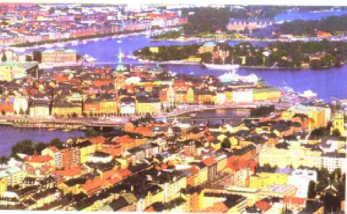
诺贝尔的美丽故乡，一个神话般的国度 (瑞典首都斯德哥尔摩局部鸟瞰)