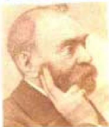
ALFRED NOBEL 1833 — 1896