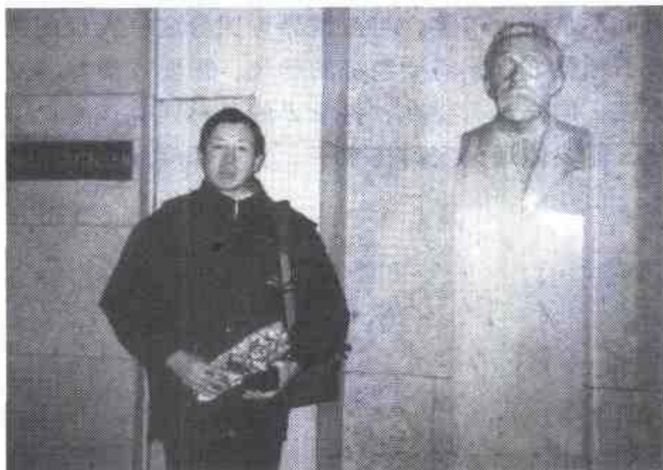
作者在诺贝尔基金会

对于诺贝尔奖，近几年在我国越来越受到人们关注，媒体也不时议论纷纷。越来越多的中国人清醒地认识到，一个缺少强大科技实力的国家，是不可能屹立于世界民族之林的。因此不少中国人心中有一种隐痛：我们是个科技大国，还远称不上科技强国。在国民关注诺贝尔奖的背后，其实反映的是中国人处在当前这个经济全球化的进程中，渴望被承认、被认可，渴望祖国全面繁荣强盛的一种积极心态。应该说，这是民族精神的一种表现。但人们也看到了一些不正常的情绪：有的不认真分析我国科学技术发展的背景、条件和水平，盲目地断言，中国人在短期内能够拿到诺贝尔奖；有的不负责任，轻率地否定中国科学技术的发