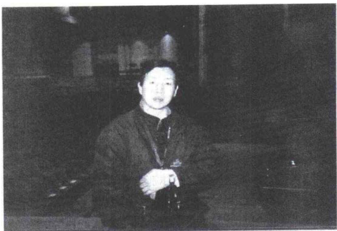
作者在颁发诺贝尔奖的股票哥尔摩音乐厅大舞台上

的速度发展的世纪，从世纪初的相对论和量子论的诞生，到中叶以来的半导体、原子能、航空航天、微电子与信息、生物工程等技术的巨大发展，都标志着人类认识和改造自然的能力有了极大的提高。诺贝尔奖伴随着科学技术日新月异的发展度过了整个世纪，有力地促进了人类的文明进步，它已被全球的知识界视为至高无上的荣誉，其影响之广、魅力之大，是其他任何奖励都无法比拟的。这就是为什么每年的10月，无数位科学家期盼着那一生向往的、激动人心的、来自斯德哥尔摩的电话的最终原因。