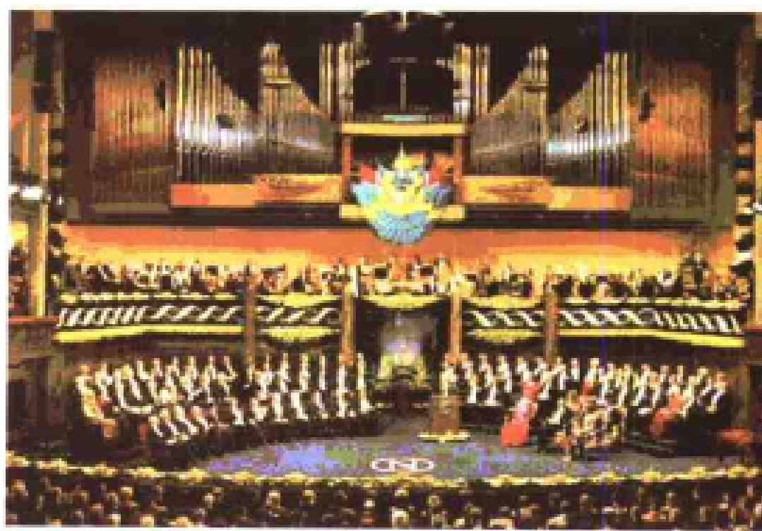
2002年诺贝尔奖颁奖典礼盛况。