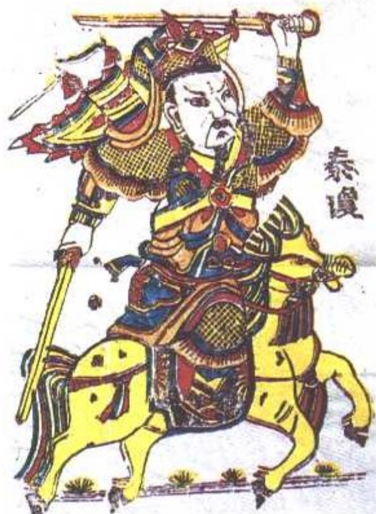
门神(陕西凤翔年画)