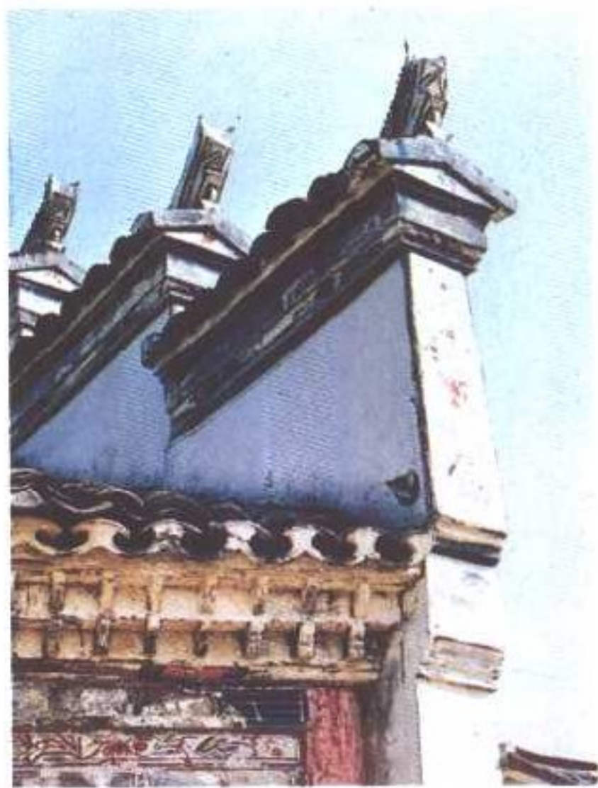
封火墙上的牙脊(江苏溧水)