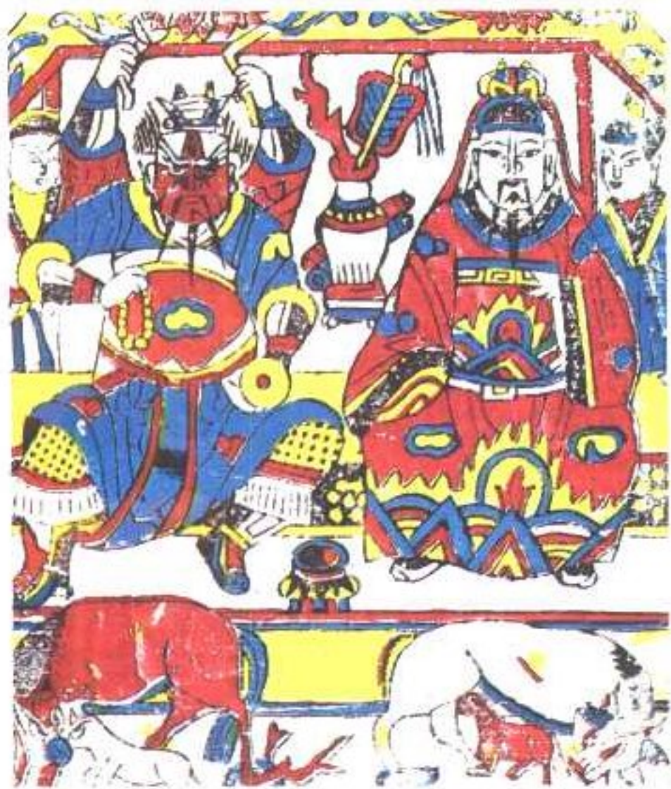
牛王马王(民间纸马)