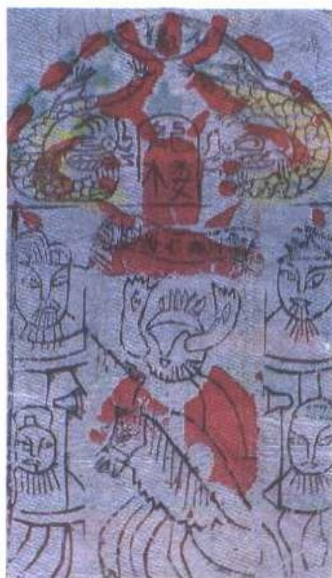
太岁纸马(江苏南通)