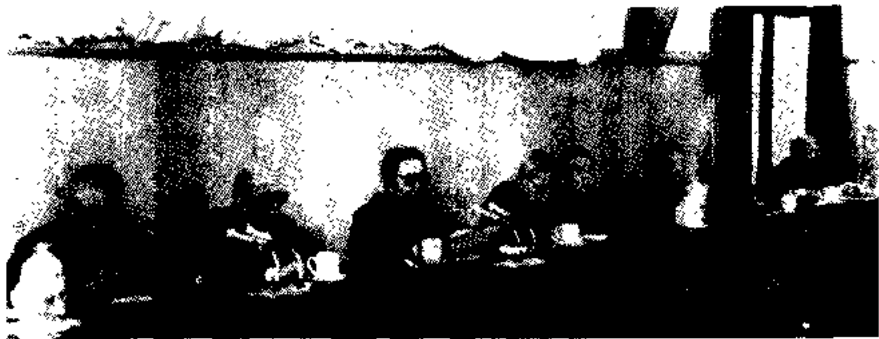
中国史学会第三次代表大会主席团主持会议