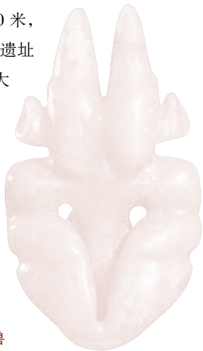
◆红山文化·玉雕神兽

除 了牛河梁的女神庙和积石冢，考古工作者还在喀左县（喀喇沁左翼蒙古族自治县）的东山嘴发现了距今 5000 年的祭坛遗址，这是目前中国发现的最早的宗教遗存。遗址坐落在山梁正中缓平突起的台地上，长约 60 米，宽约 40 米，四周是开阔的平地。遗址的核心部分是一座大型方形台基，东西长 11.8 米，南北宽 9.5 米。在祭坛上部，堆积着黑灰色的碎石片层，下部用黄土堆积，底部为平整坚硬的黄土层和大