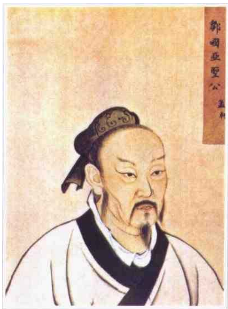
孟轲（约前372—前289）清殿藏本