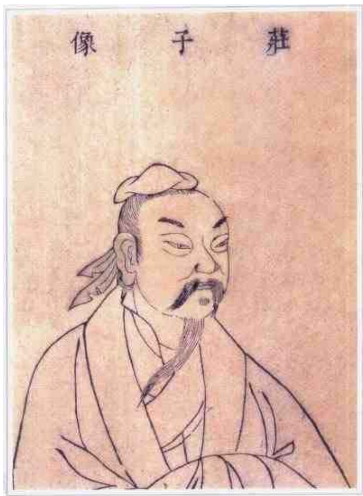
庄周 （约前369—前286； 明万历《三才图绘》刻本

战国时期的哲学家、文学家。宋国蒙（今河南商丘东北）人。曾任漆园吏，后居家讲学，家境贫寒，楚威王闻其贤名，两次厚禄聘请任其相，都被拒绝。在哲学思想上，继承和发展了老子提出的“道法自然”的观点，把道看作是超自然的神秘精神，并认为人对自然灾是毫无能为力的。而且一切事物都处在“无动而不变，无时而不移”中，倡导一种安时处顺、逍遥自乐的思想，对后世影响很大。《汉书·艺文志》著录《庄子》五十二篇，现存三十三篇。