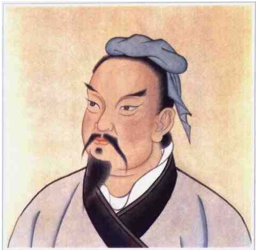
孙武（春秋末）明万历《三才图绘》刻本

春秋末期军事学家，中国古代军事学的奠基人。字长卿，也称孙武子。齐国乐安（今山东）人。生卒年不详，约活动于前六世纪末至前五世纪初。因齐国内乱，孙武出走吴国。以《兵法》十三篇向吴王阖闾进见，被任为将，率吴军攻破楚国。所著《孙子兵法》八十二篇，总结了春秋时期军事战争经验，揭示了“知彼知己，百战不殆”这一指导战争的普遍规律，是中国不朽的军事名著，对后世产生了广泛而深刻的影响。