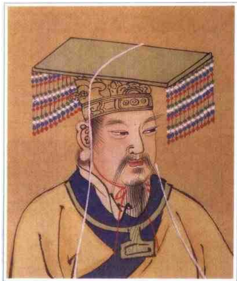
黄 帝（远古） 明人绘

黄帝轩辕氏，三皇之一。本姓公孙，改姬姓，号轩辕氏、有熊氏。少典之子，生于寿丘，建都有熊。是传说中中原各族的共同祖先。黄帝部落原定居西北高原，在向中原地区发展的过程中，与相邻的炎帝部落发生冲突，阪泉（今河北涿鹿东南）之战，炎帝部落被击败，炎黄两部落由此联合。后又与蚩尤的东方九黎族战于涿鹿之阿，击杀蚩尤，从此黄帝成为华夏诸部族联盟的领袖。后世认为养蚕、文字、舟车、历法等创造发明均始于黄帝时期。