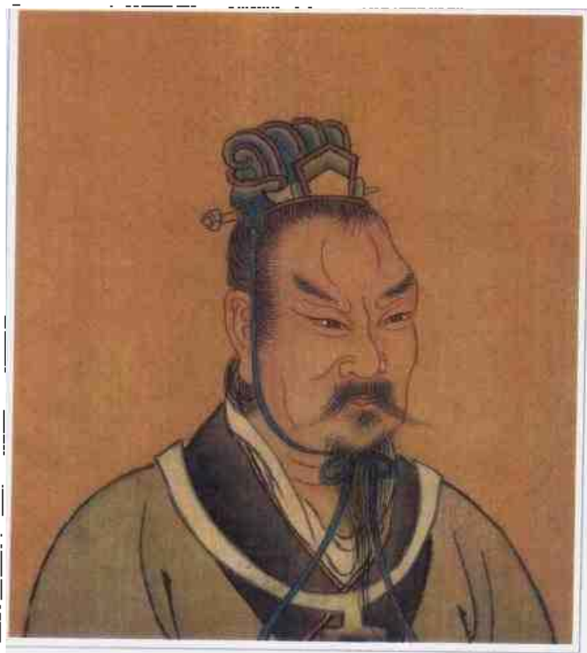
颛顼 (远古) 清人绘

五帝之一。姬姓，号高阳氏。相传生于若水，居于帝丘(今河南濮阳东南)，后徙高阳，继黄帝为首领。史载：“颛顼高阳者，黄帝之孙而昌意之子也。静渊以有谋，疏通而知事；养材以任地，载时以象天，依鬼神以制义，治气以教化，絜城以祭祀。”