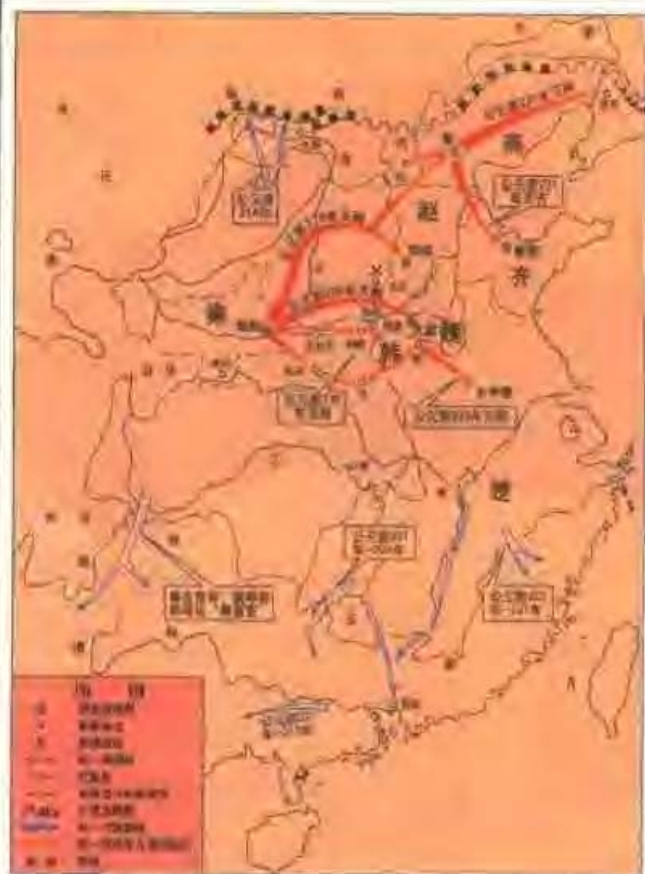
▲秦始皇统一六国示意图