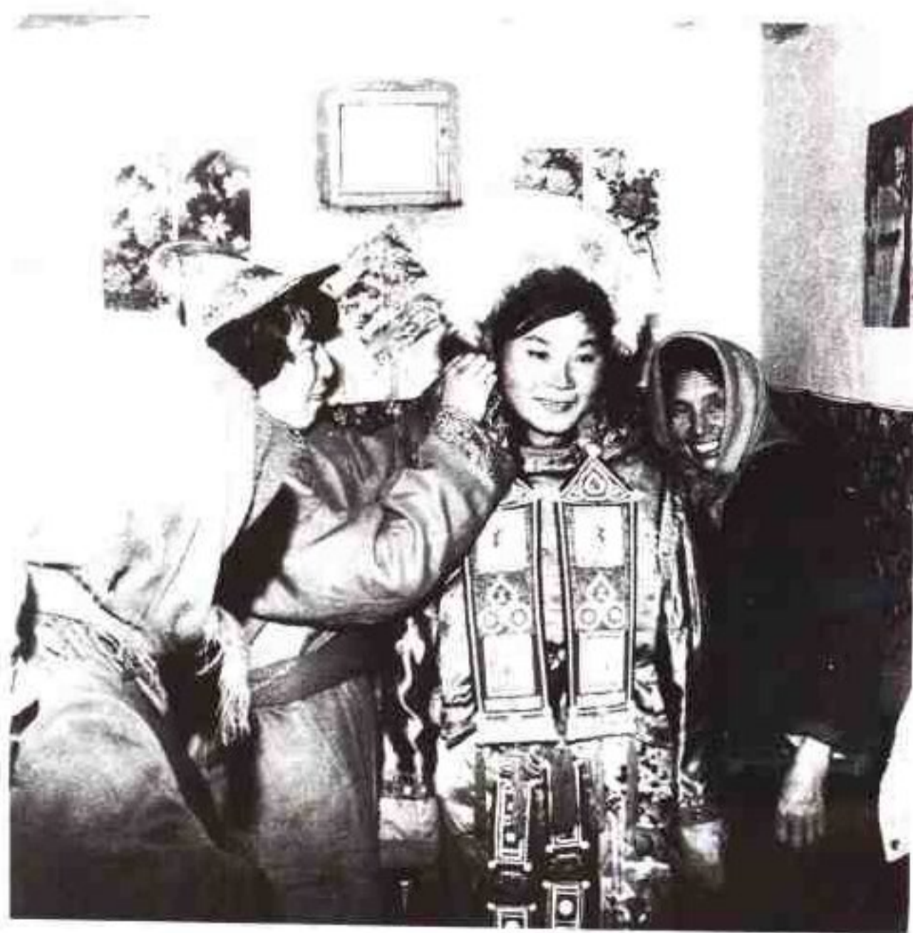
裕固族婚礼戴头面