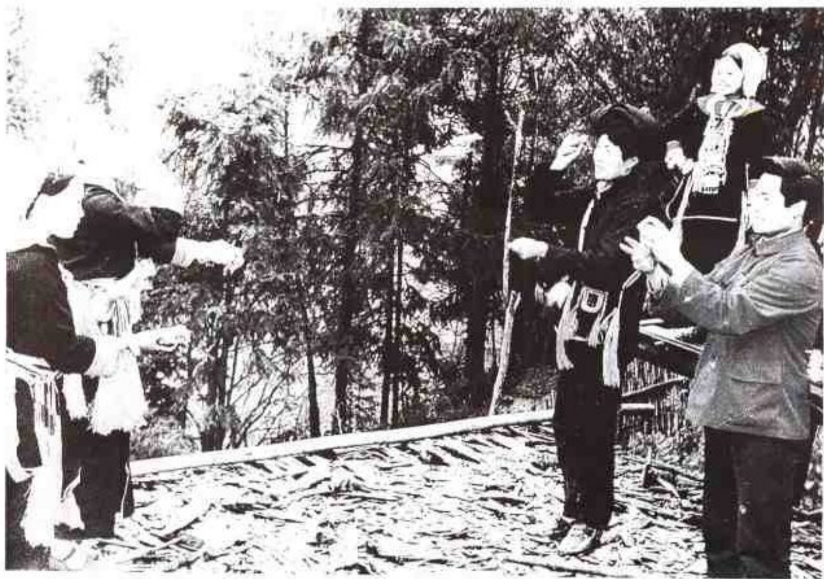
云南瑶族“丢包”游戏