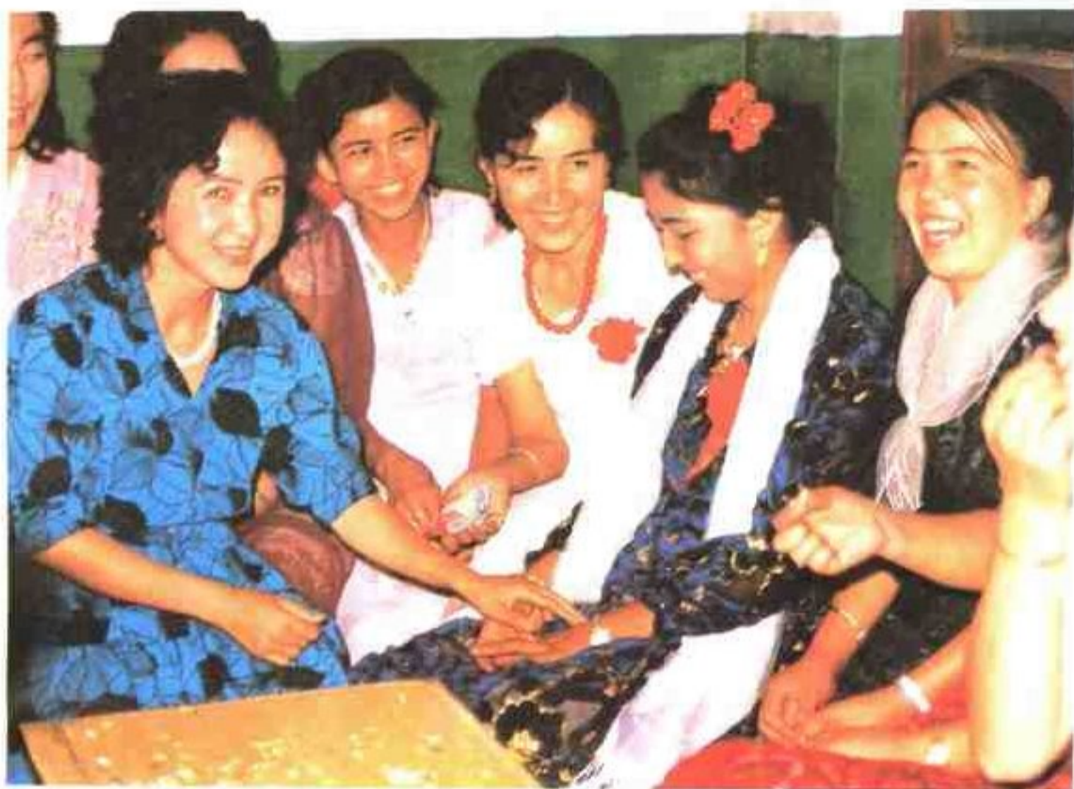
维吾尔族的正婚日——新娘与女伴话别