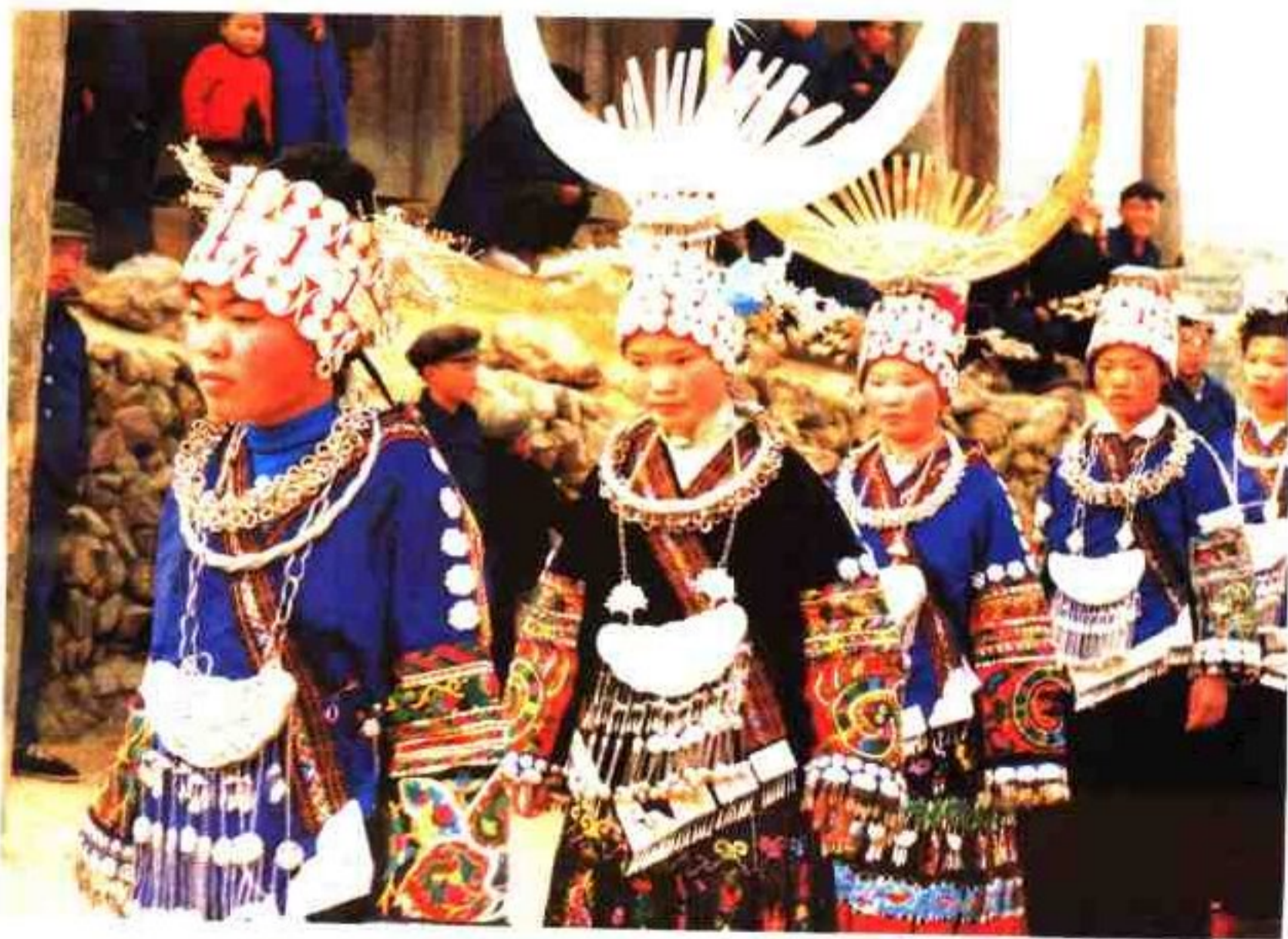
China 州苗族姑娘在芦笙场上