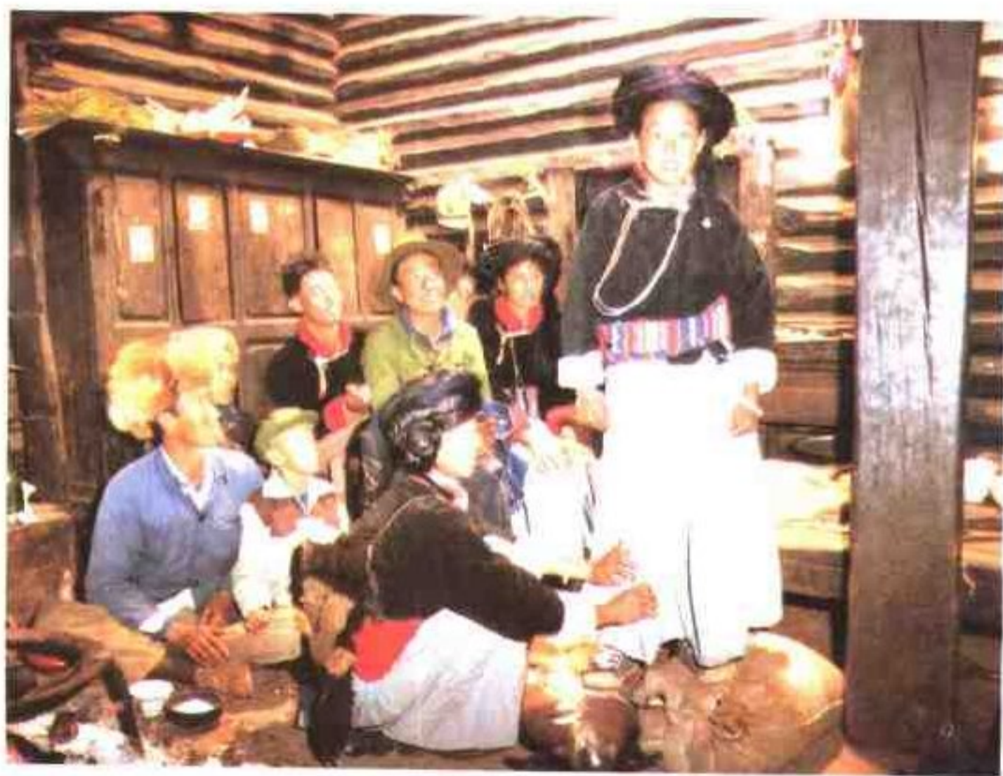
摩梭少女十三岁穿裙子(成年礼)