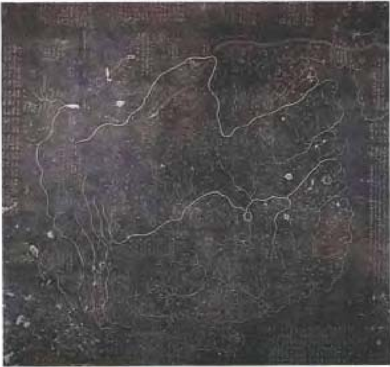
图三 年表图（北京图书馆藏） 图四 年表图（北京图书馆藏）