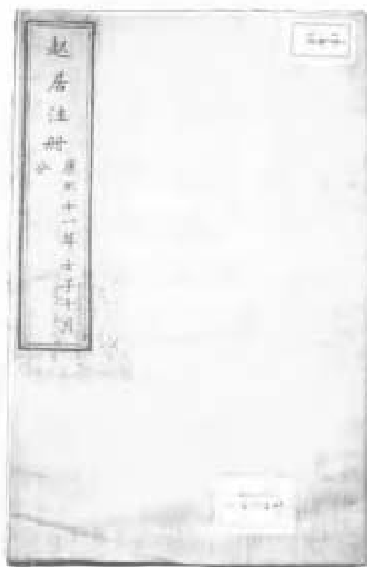
起居注冊。是記康熙皇帝日常起居的相冊。圖為康熙二十一年十月十日康熙帝和保和殿恩慶親王、忠王、溥良的御飯桌等。