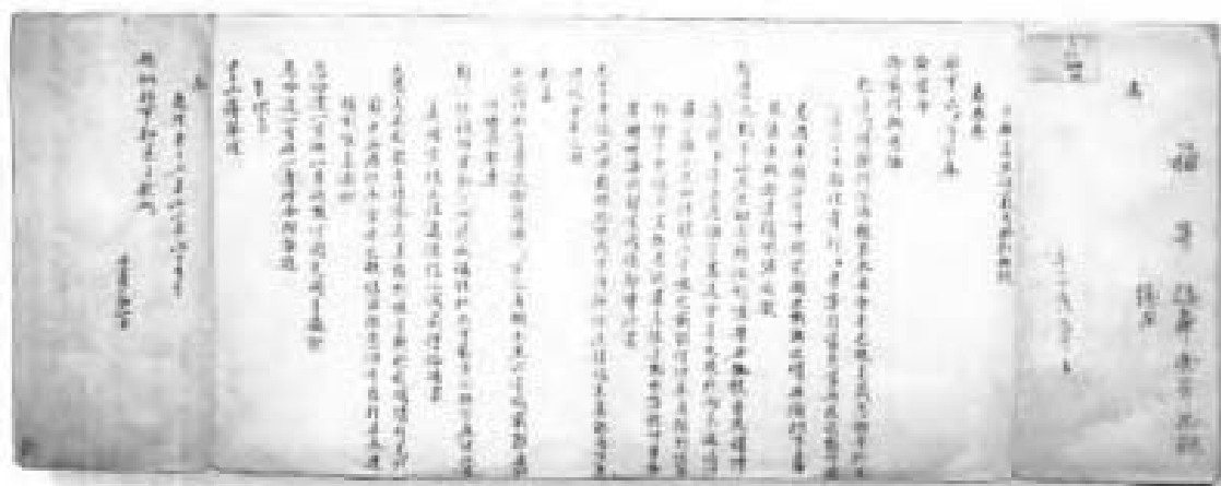
录副奏折。官员上报皇帝的奏折经皇帝批阅后由军机处抄录存查的副本。乾隆五十七年十二月初一日福康安等为报全本巴瓶送达西藏时达赖喇嘛率僧俗接奉情形奏折