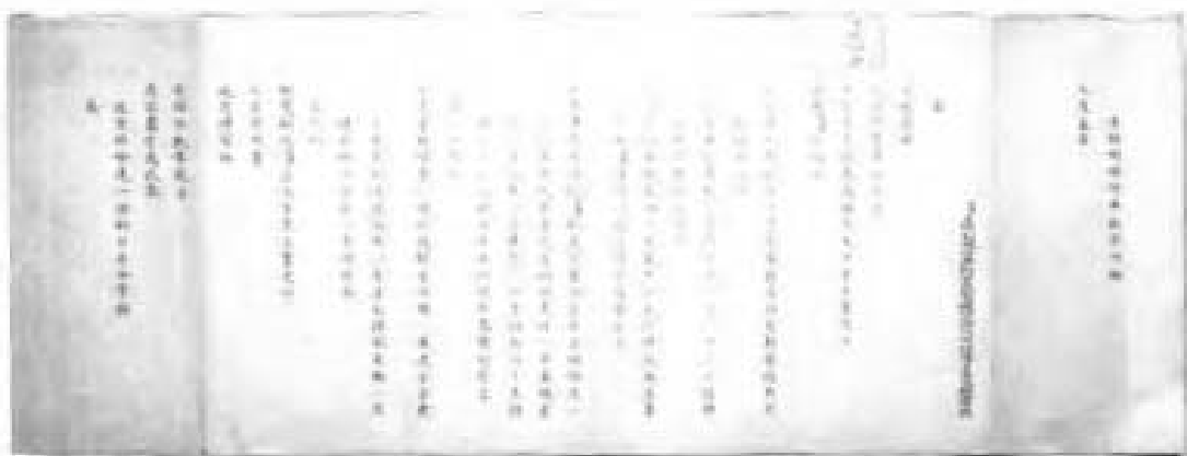
达赖喇嘛谢恩奏书