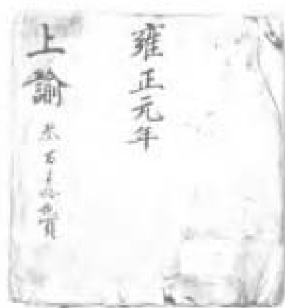
上諭。是康熙皇帝發布命令 指示的相冊。因為雍正皇帝為什 至給所圍坐面圍桌給儲仁送： 御飯注冊前。