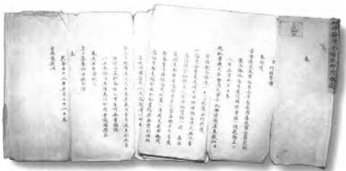
乾隆五十八年正月二十一日军机大臣阿桂等遵旨会议福康安等所拟西藏善后事宜应行办理章程奏折