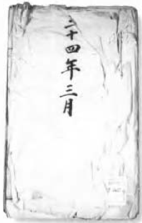
电报档。清末，各地官员致军机大臣或请军机处代呈代转电报译稿的汇集。图为光绪三十四年三月二十六日驻藏大臣联豫为班禅大师愿愿进京觐见请代奏电