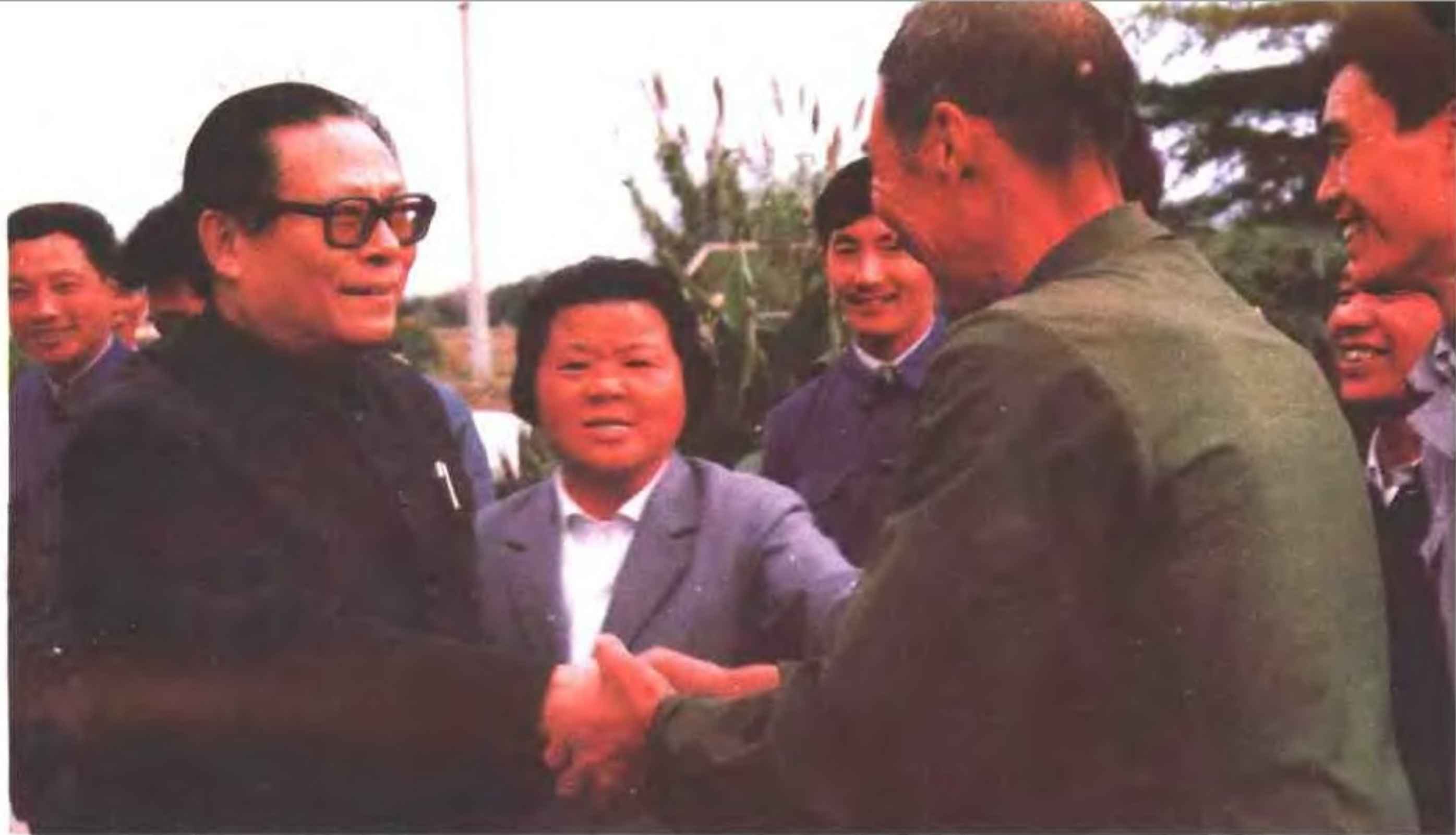
▲江泽民市长视察川沙时接见劳动模范(1985. 10)