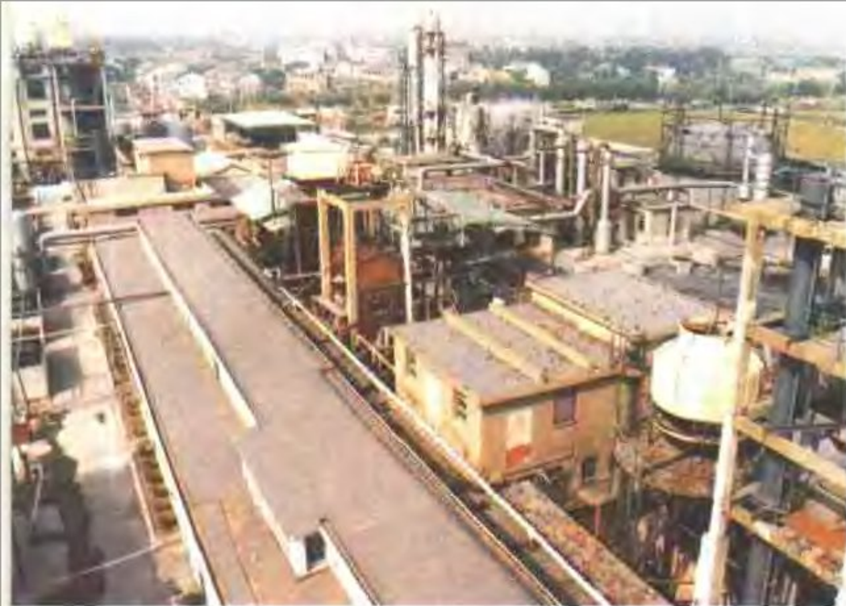
◀ 川沙化肥厂一角 ▲ 浦东煤气厂 ▼ 川沙自来水厂