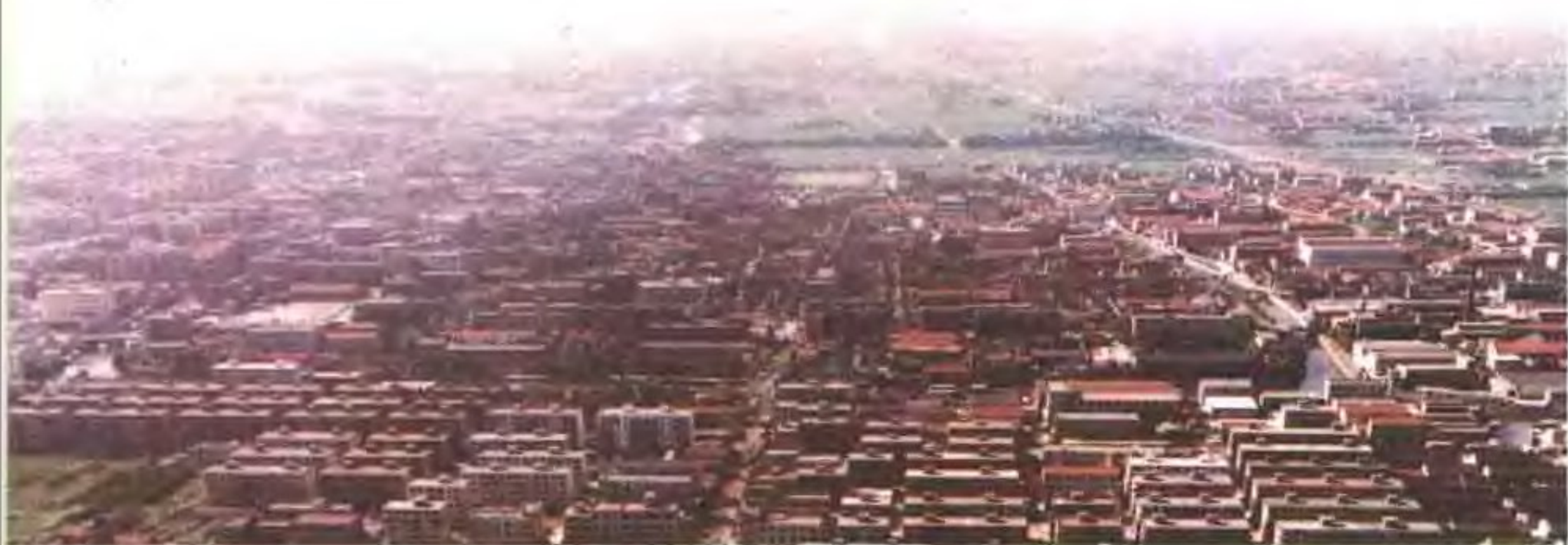
▲ 县城老区(护城河内) ▼ 县城鸟瞰