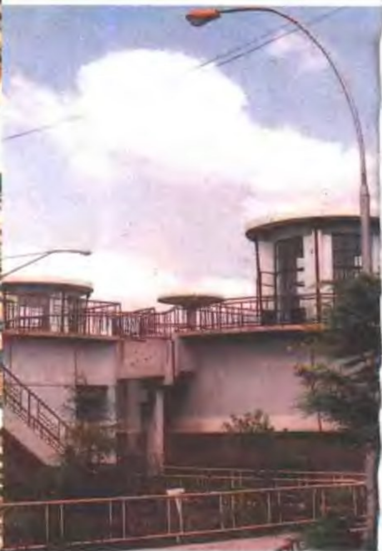
▼ 川沙水泥厂 ▼ 川沙油脂厂