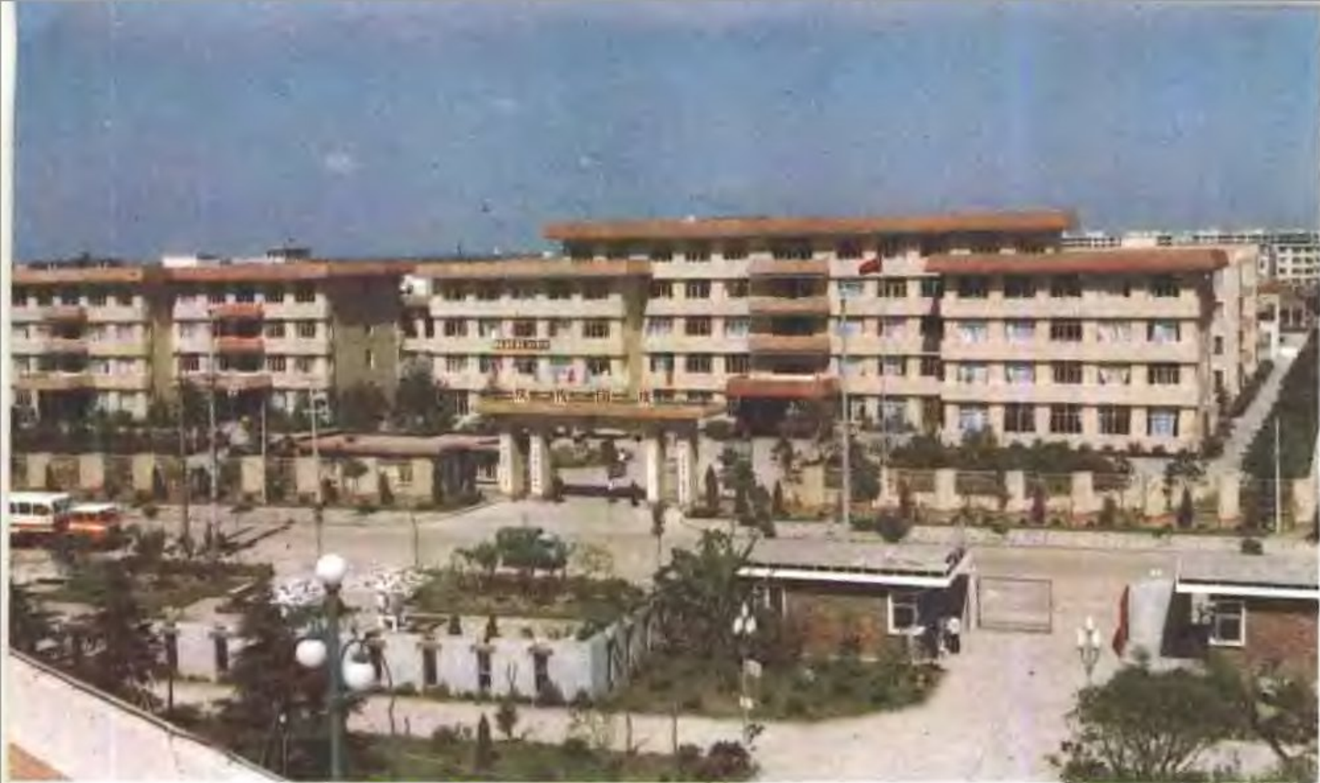
▲ 中共川沙县委、县人大、县政府、县政协机关