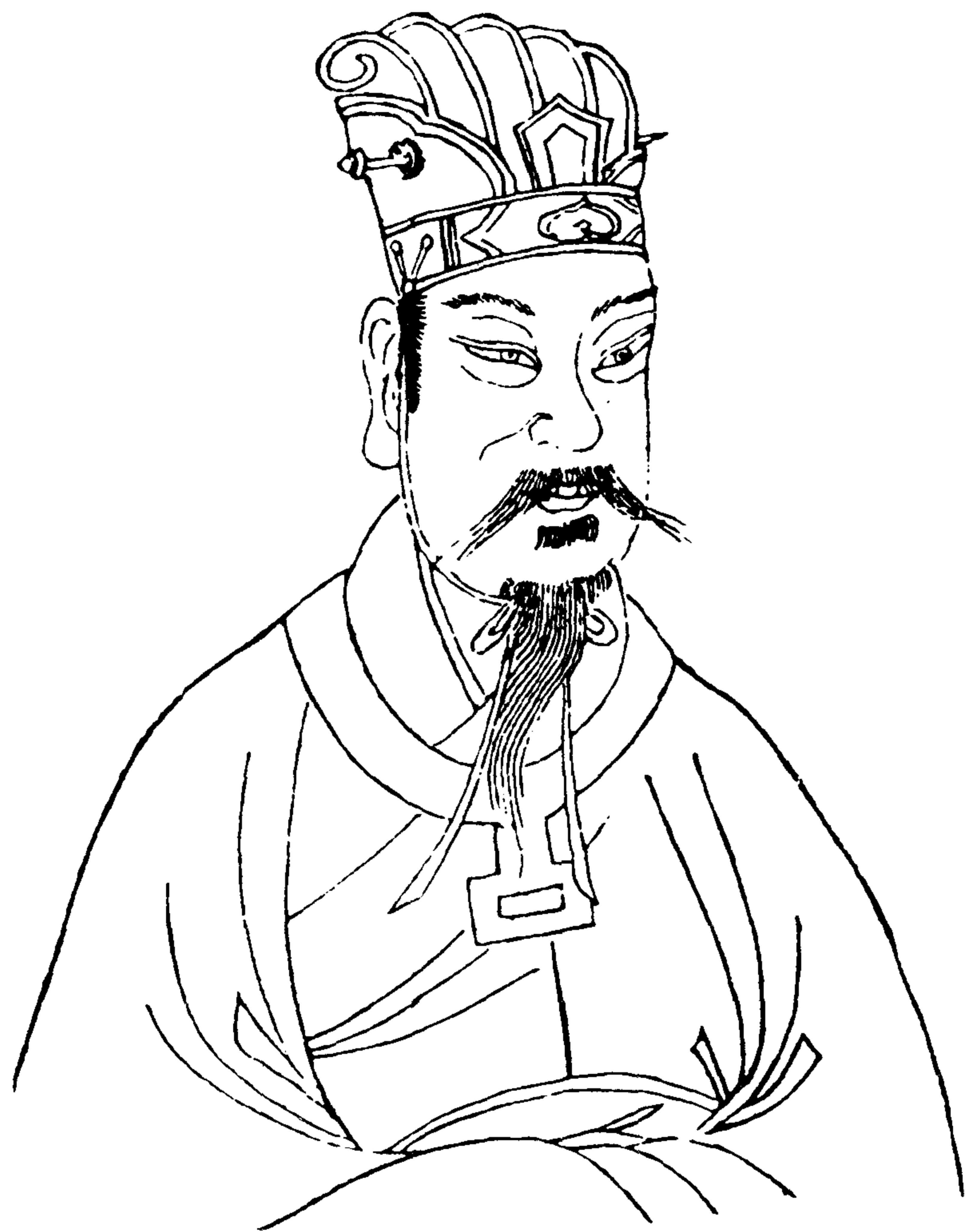
少 皞 金 天 氏