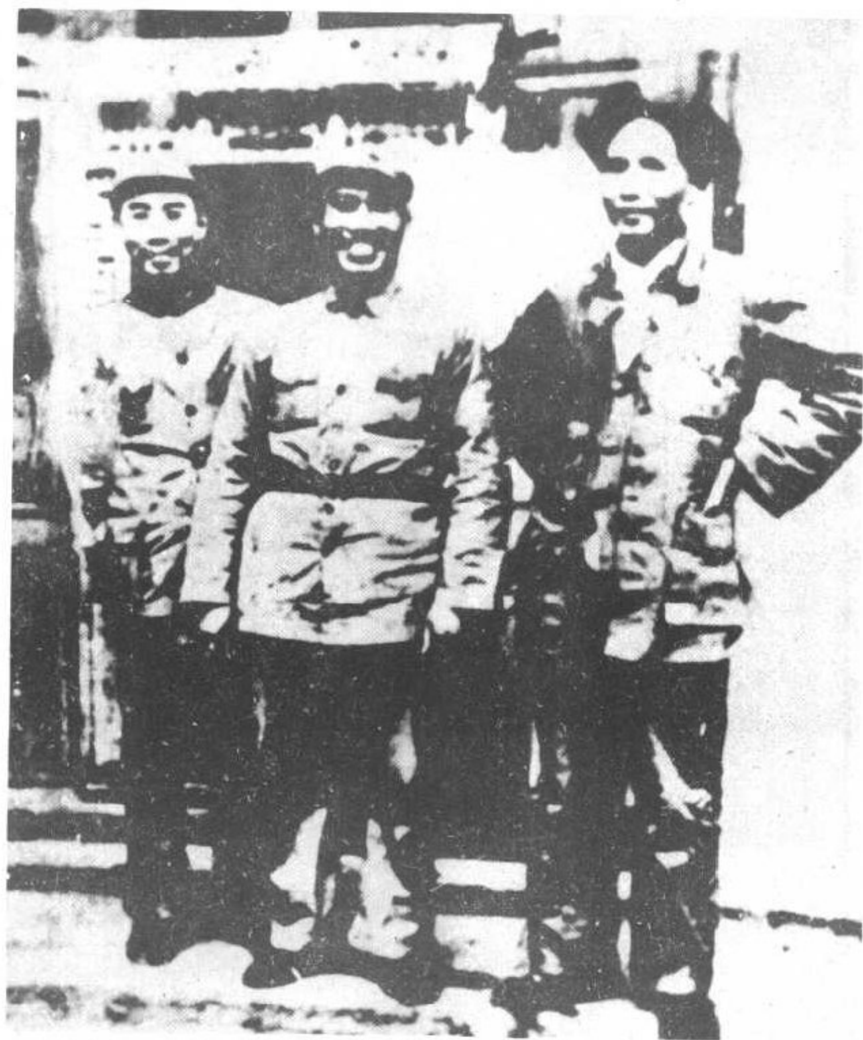
毛泽东、周恩来、朱德同志在长征到陕北 合影。