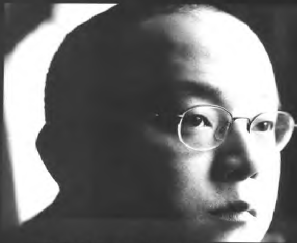
19. 晏 唯：当今中国较重要的实验音乐家，其思想以酷冷、逐豫著称。