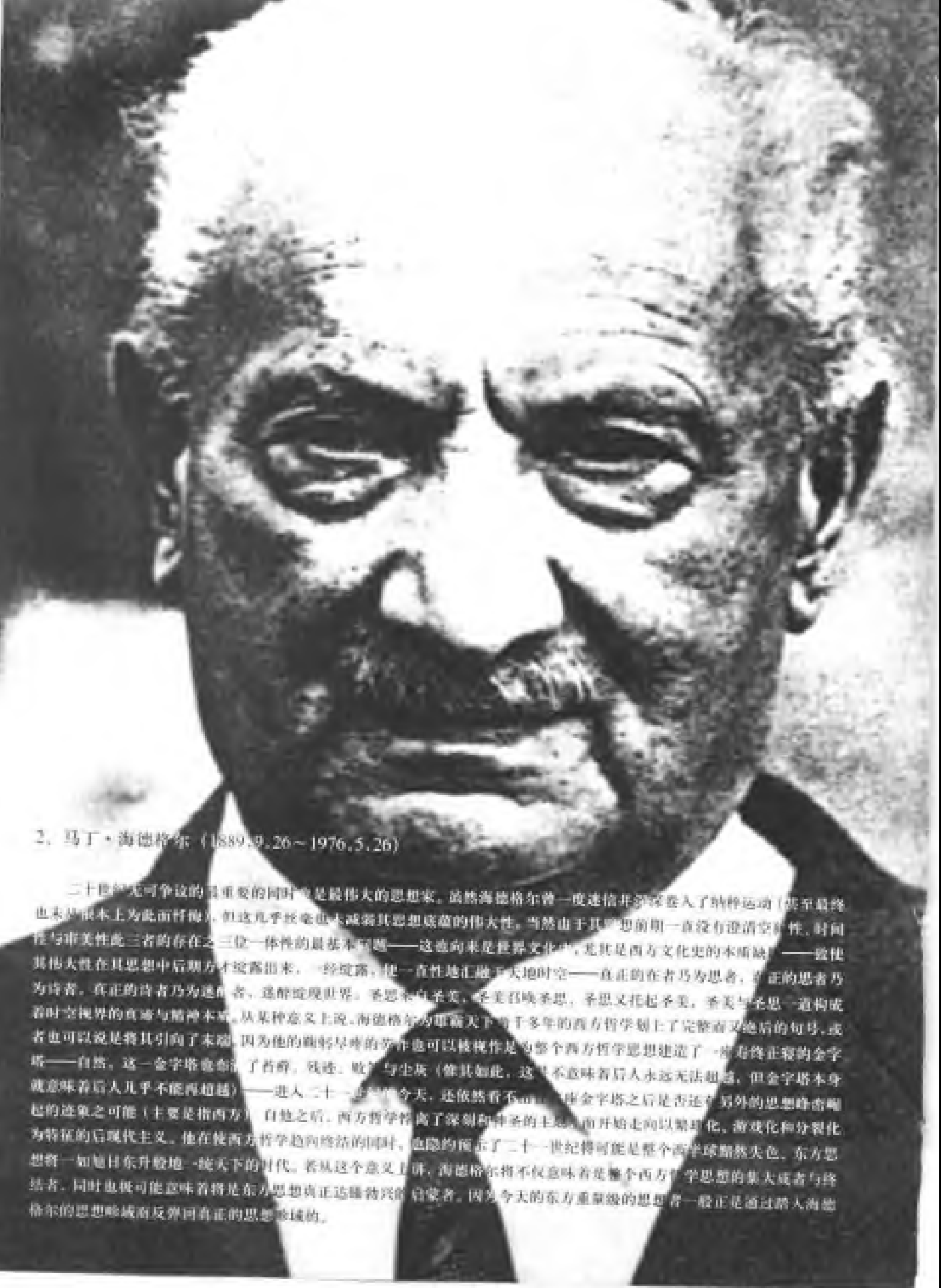
2. 马丁·海德格尔 (1889.9.26~1976.5.26)

二十世纪无可争议的最重要的同时也是最伟大的思想家。虽然海德格尔曾一度迷信并深深卷入了纳粹运动（甚至最终也未从根本上为此而忏悔），但这几乎丝毫也未减弱其思想底蕴的伟大性。当然由于其思想前期一直没有澄清空时性、时间性与审美性此三者的存在之三位一体性的最基本问题——这也向来是世界文化史，尤其是西方文化史的本所缺——致使其他大性在其思想中后期方才绽露出来。一经绽露，便一直性地汇融于大地时空——真正的在者乃为思者，真正的思者乃为诗者，真正的诗者乃为思者，这醉醒观世界。圣思来自圣美，圣美召唤圣思，圣思又托起圣美，圣美与圣思一道构成着时空境界的真谛与精神本质。从某种意义上说，海德格尔为喧嚣天下若干多年的西方哲学划上了完整而又绝后的句号，或者也可以说是将其引向了末路，因为他的鞠躬尽瘁的劳作也可以被视作是为整个西方哲学思想建造了一座寿终正寝的金字塔——自然，这一金字塔也亦添了首碑、残迹、败笔与尘埃（惟其如此，这并不意味着后人永远无法超越，但金字塔本身就意味着后人几乎不能再超越）——进入二十一世纪（今天，还依然看不到，这座金字塔之后是否还有另外的思想峰峦崛起的迹象之可能（主要是指西方）自他之后，西方哲学背离了深刻和神圣的主题，而开始走向以繁理化、游戏化和分裂化为特征的后现代主义。他在使西方哲学趋向终结的同时，也隐的预示了二十一世纪将可能是整个西半球黯然失色，东方思想将一如旭日东升般地一统天下的时代。若从这个意义上讲，海德格尔将不仅意味着是整个西方哲学思想的集大成者与终结者，同时也就可能意味着将是东方思想真正达臻勃兴的启蒙者。因为今天的东方重新崛起的思想者一般正是通过踏进海德格尔的思想领域而反弹回真正的思想领域的。