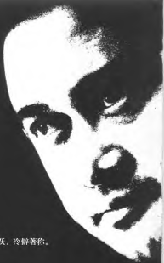
20、张元：当今中国较重要的另类电影艺术家，其思想以闪跃、冷僻著称。