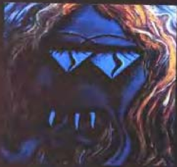
10. 《空间与时间》5号(上)、6号(下) 布面油画