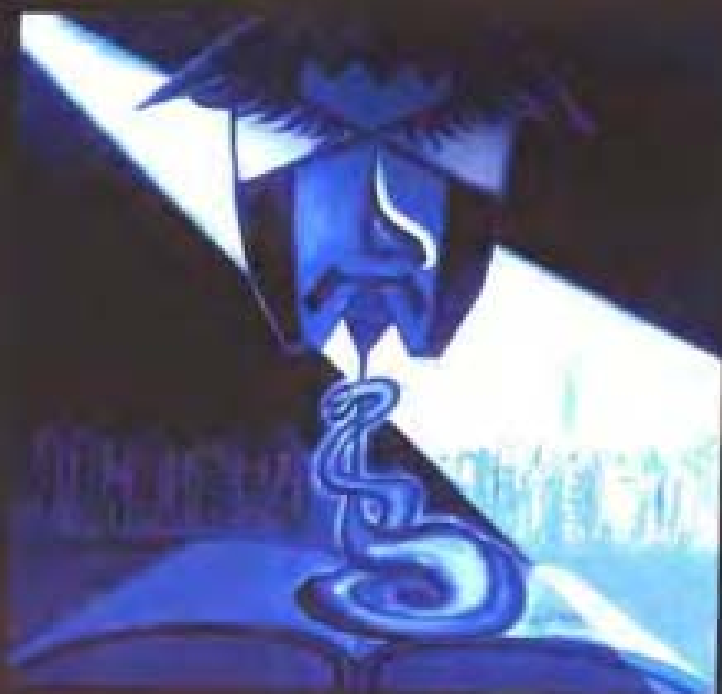
9. 《空间与时间》1号 木板油画