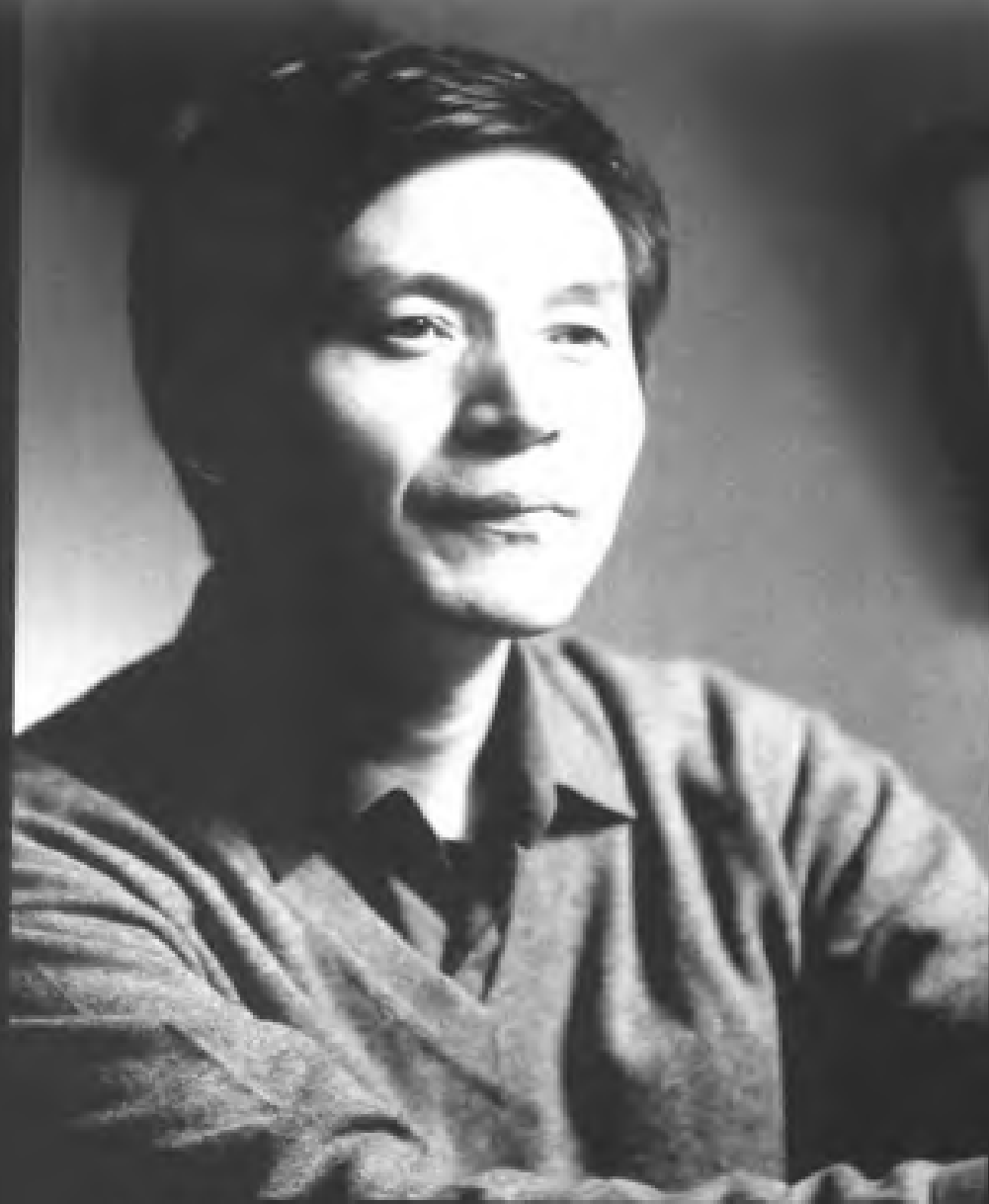
14. 贺卫方：当今中国较重要的诗性法学家，其思想以飘逸、浪漫著称。