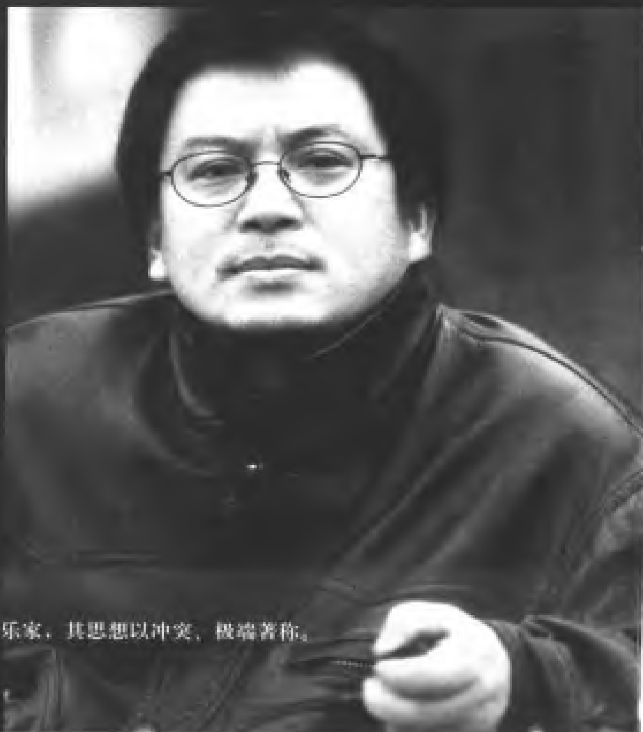
21、郭文景：当今中国较重要的现代音乐家，其思想以冲突、极端著称。