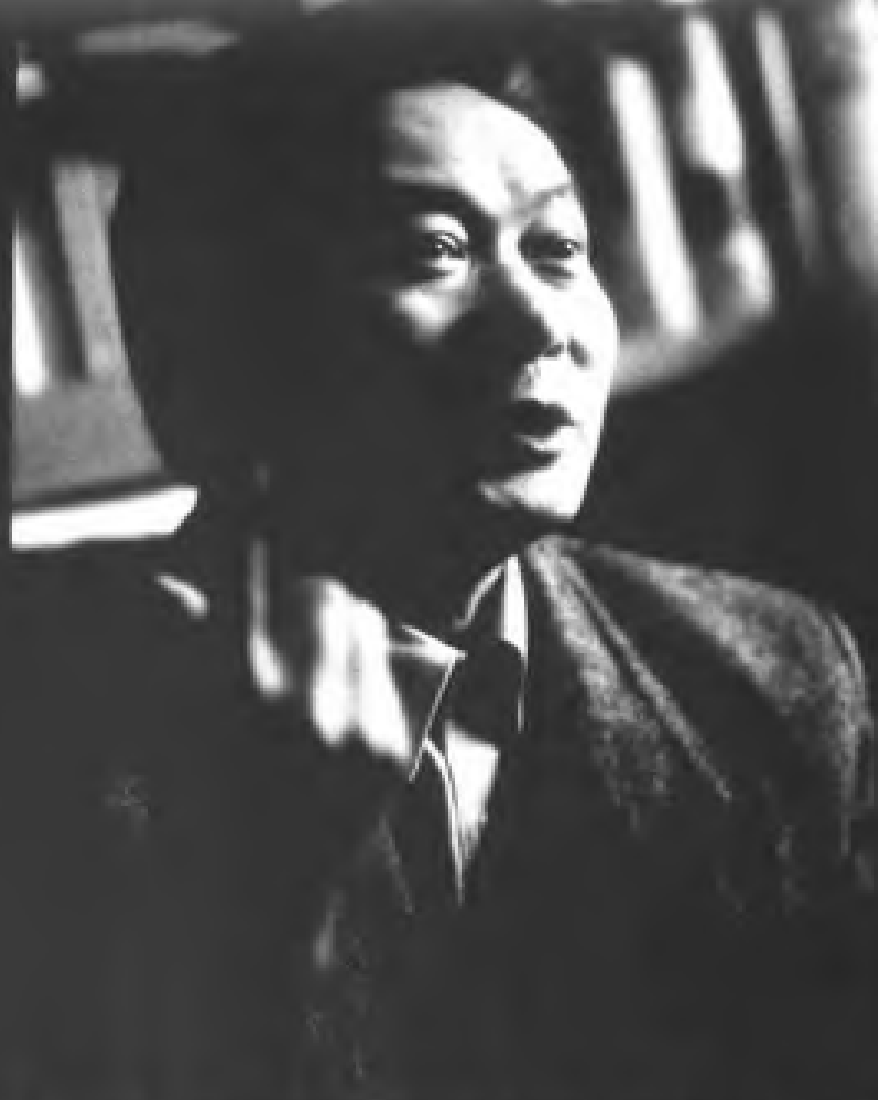
16. 李正坤：当今中国较重要的文化批评家，其思想以大胆、先验著称。