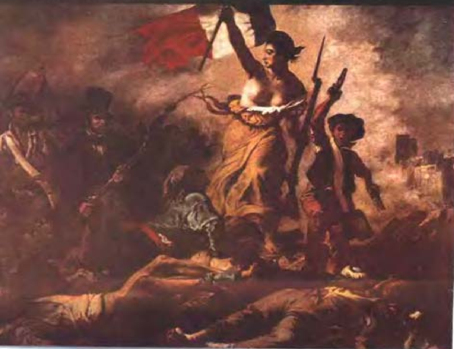
13. 空间、时间与创造 空间、自由与死亡（德拉克洛瓦《自由引导人民》 1830年 油画）

诞生于火红年代的芭蕾舞剧《红色娘子军》很可能是二十世纪（世纪末除外）中国能留给后世的精神性艺术