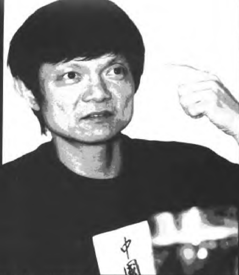
18. 曹 斌：当今中国最重要的现代舞先驱，其思想以理性、梦幻著称。