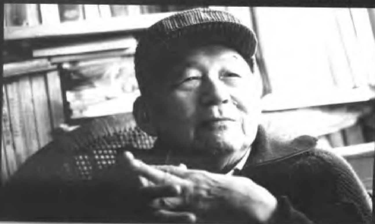
15. 何兆武：当今中国较重要的历史哲学家、翻译家，其思想以深刻、睿智著称。