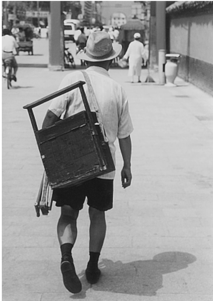
“面人汤”老人拎着小马扎背着箱子行走在沈阳街头

他住的屋子的门上贴着门神，门缝处用一把斧子塞着。将斧子放到地上，说明一种希望——“斧”同“福”吧？！地上还有一个伴随他走街串巷多年的小马扎。那是可以折叠的凳子，凳面是草绿色绑带，软的，一条条均匀地固定着，折叠起来时，绷紧的绑带便松弛下来。正是这个