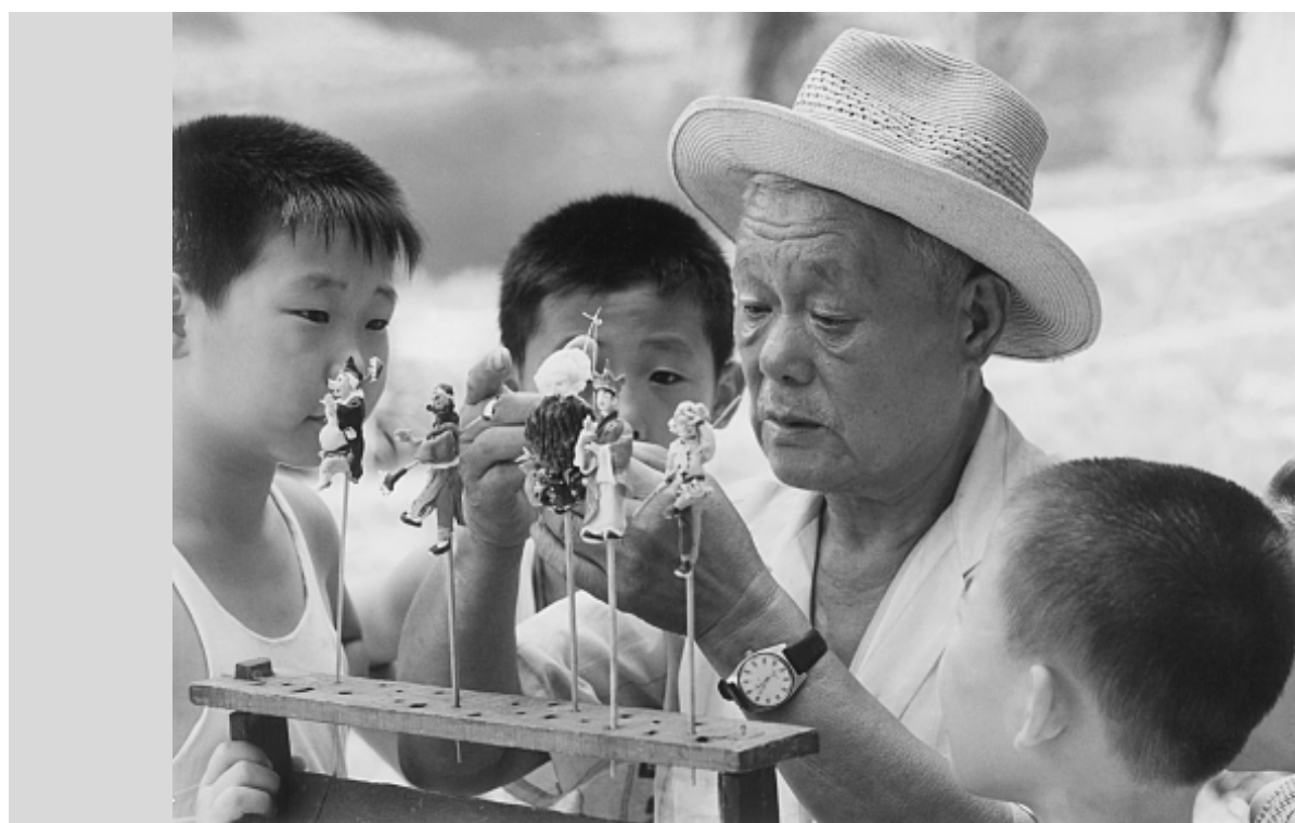
“面人汤”捏的面人，总是招来一双双好奇的孩子的眼睛