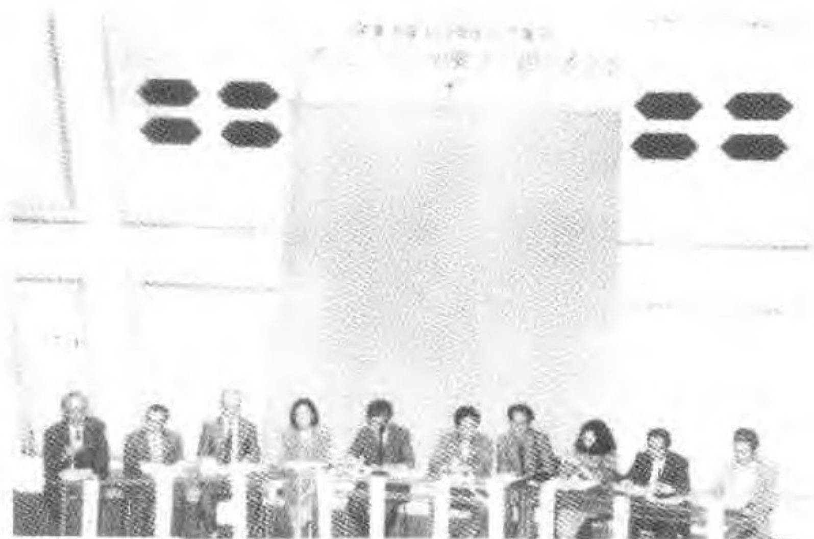
1993年9月11日,日本各界人士在东京山手教会会堂召开纪念会。