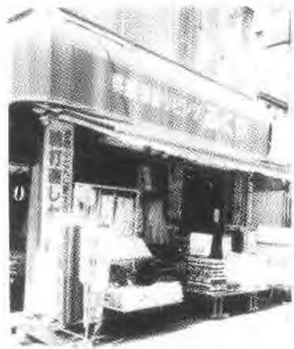
大岛町六丁目一小商店，大地震时青田县麻宅村 18 人被杀于此。