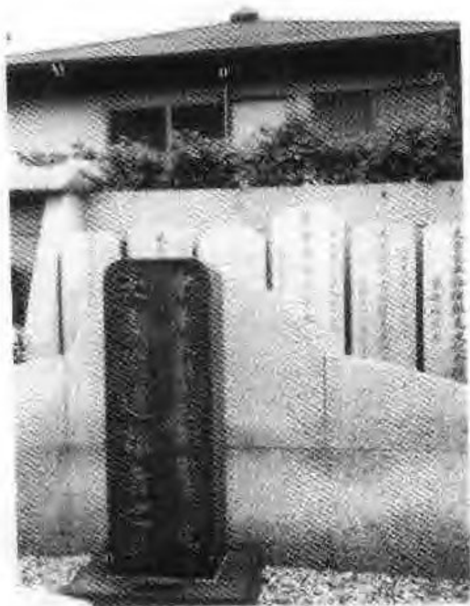
位于横滨的华人公墓中 1924年所立“大震灾遭难者之石碑”