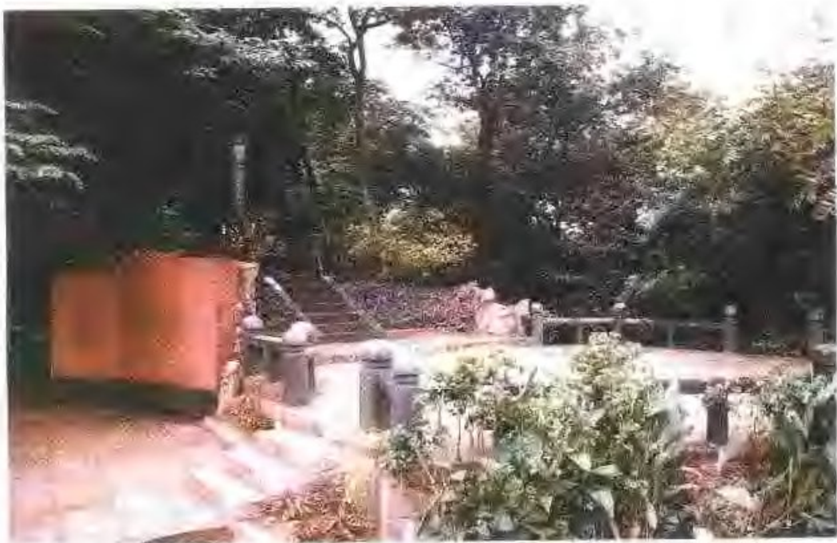
1993年9月,王希天烈士暨温处旅日蒙难华工纪念碑在温州市华盖山重树。图为纪念碑全景。