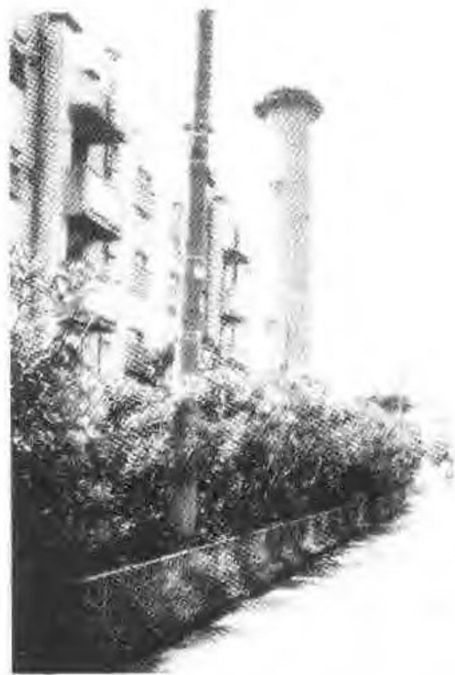
大屠杀旧址之一——大岛町六丁目原煤气公司。