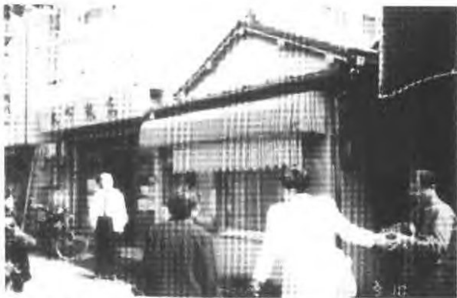
位于东京大岛町三丁目的“中华侨日共济会”原址。