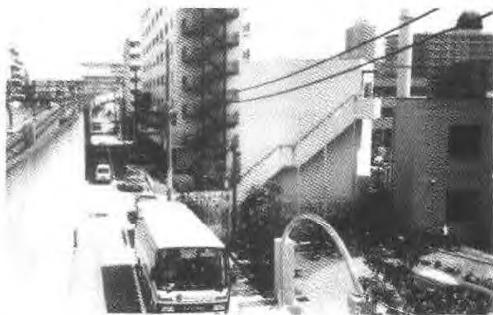
大岛町八丁目广场附近大地震时数百温处华工被集体屠杀原址。