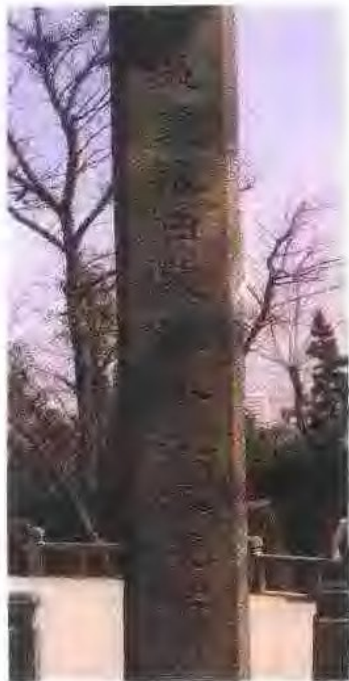
碑石背面加刻「溫處旅日蒙難華工紀念碑」。