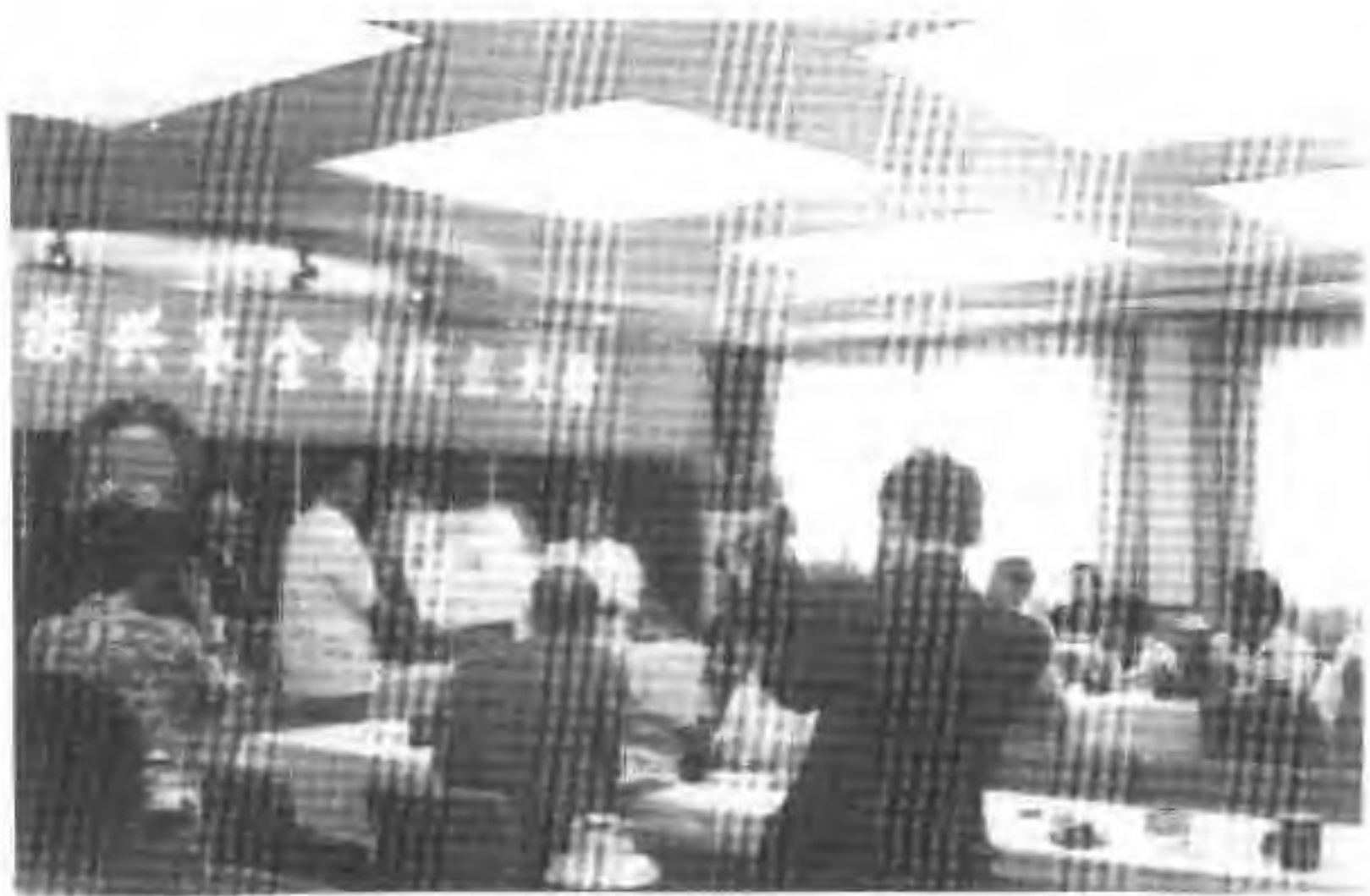
1993年9月3日,由日本友人捐资设立的“温州山区教育振兴基金会”成立。