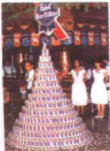
特色瀟灑的珠海藍帶啤酒城