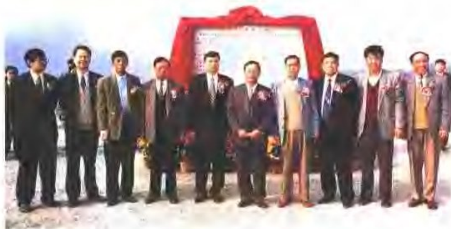
肇庆市委、市府领导及市交委、公路局领导为500公里大环市路纪念碑揭幕合照