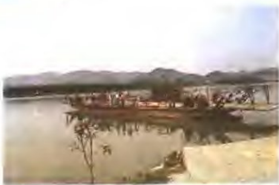
▲ 黄田渡口旧貌