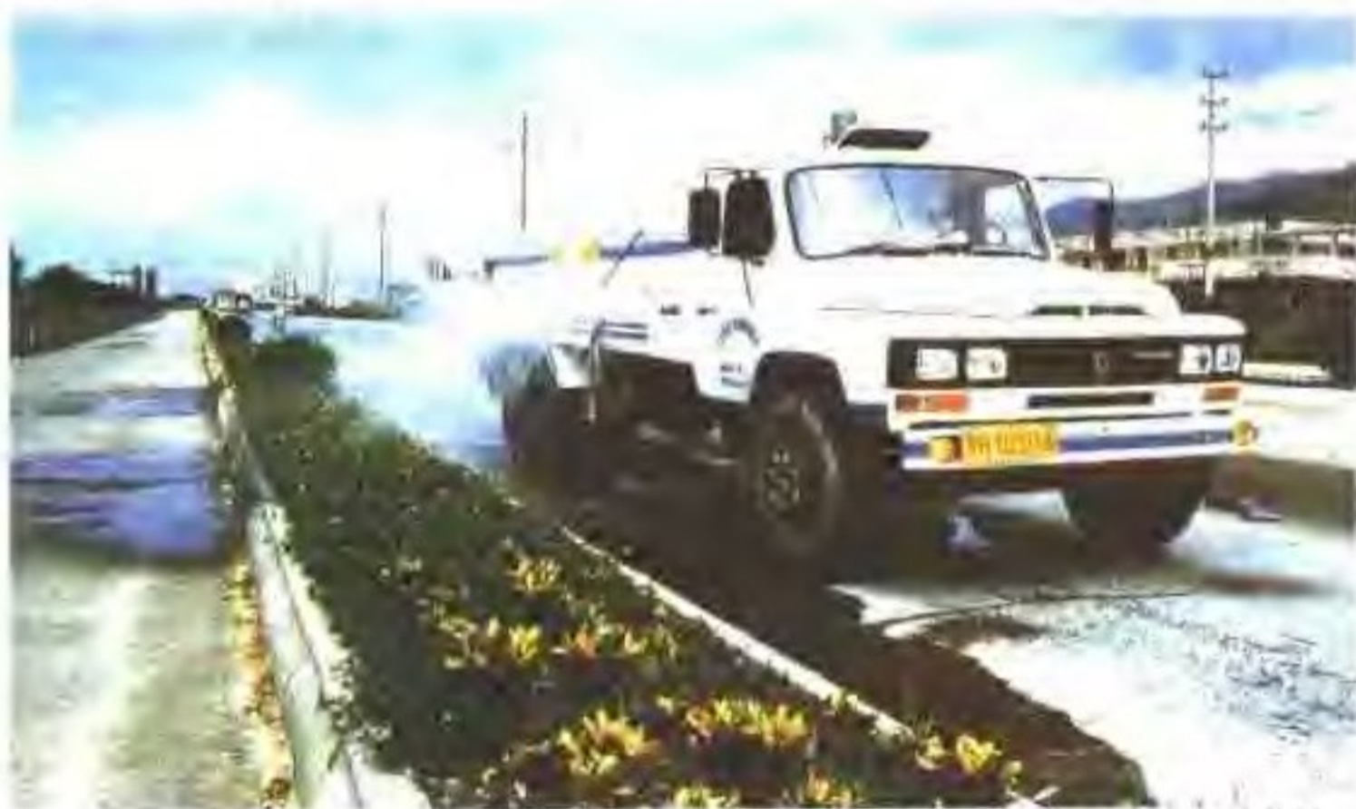
花基保养实现机械化