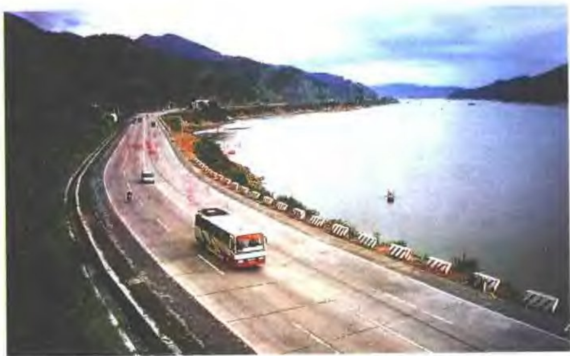
通过了交通部验收的国道321线文明样板路小湘路段