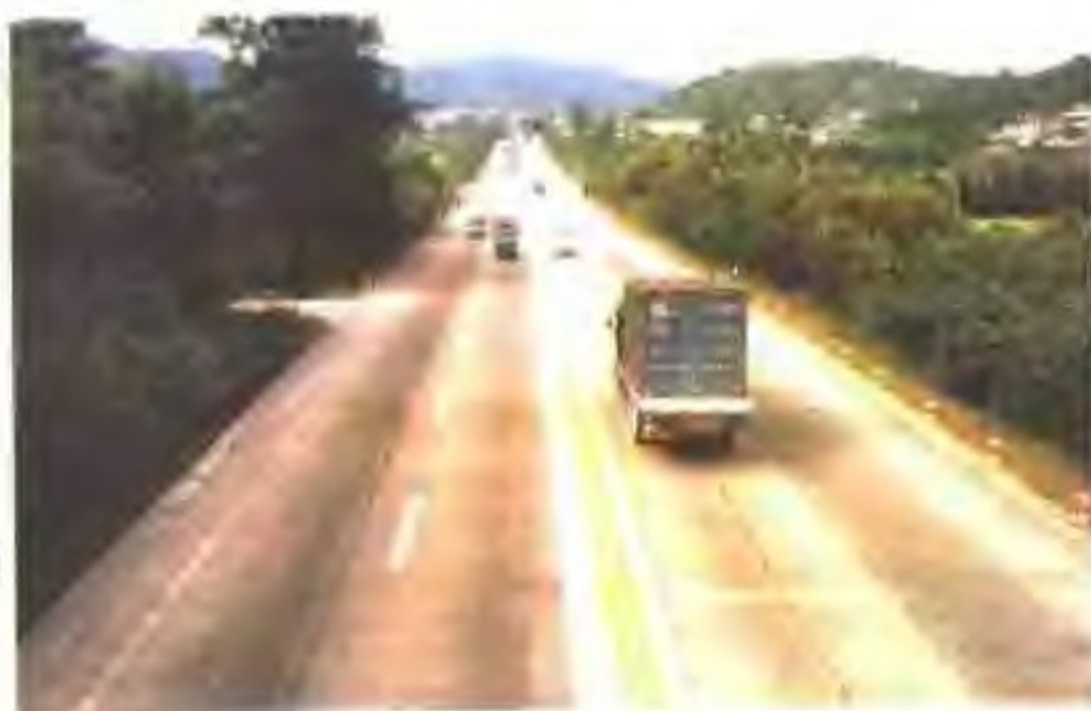
通过了交通部验收的国道 324线文明样板路高要路段