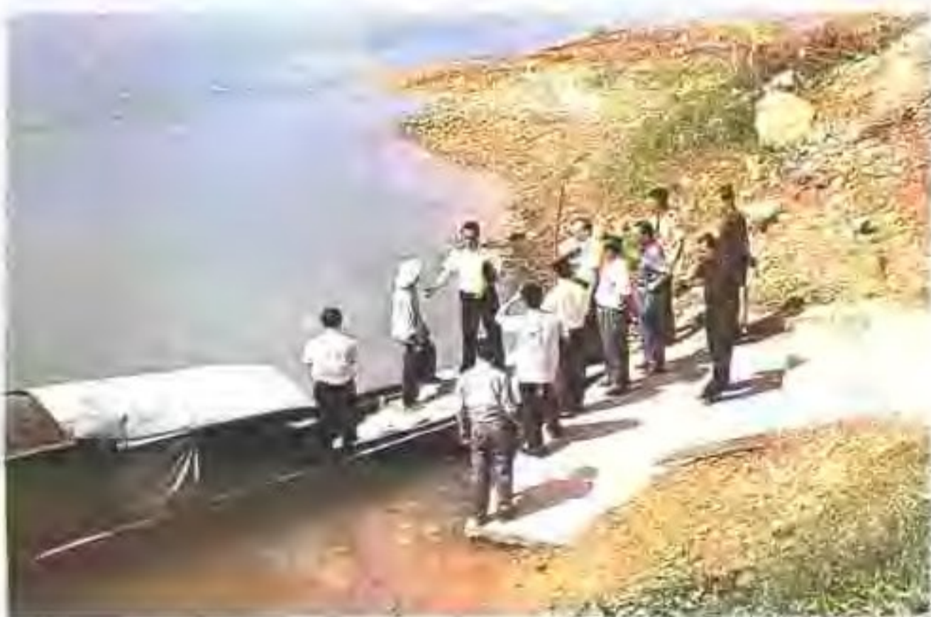
市交通局安全检查组深入广宁横水渡检查工作