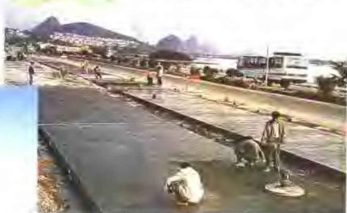
◀ 扩建中的马房北江公路大桥正在紧张地施工