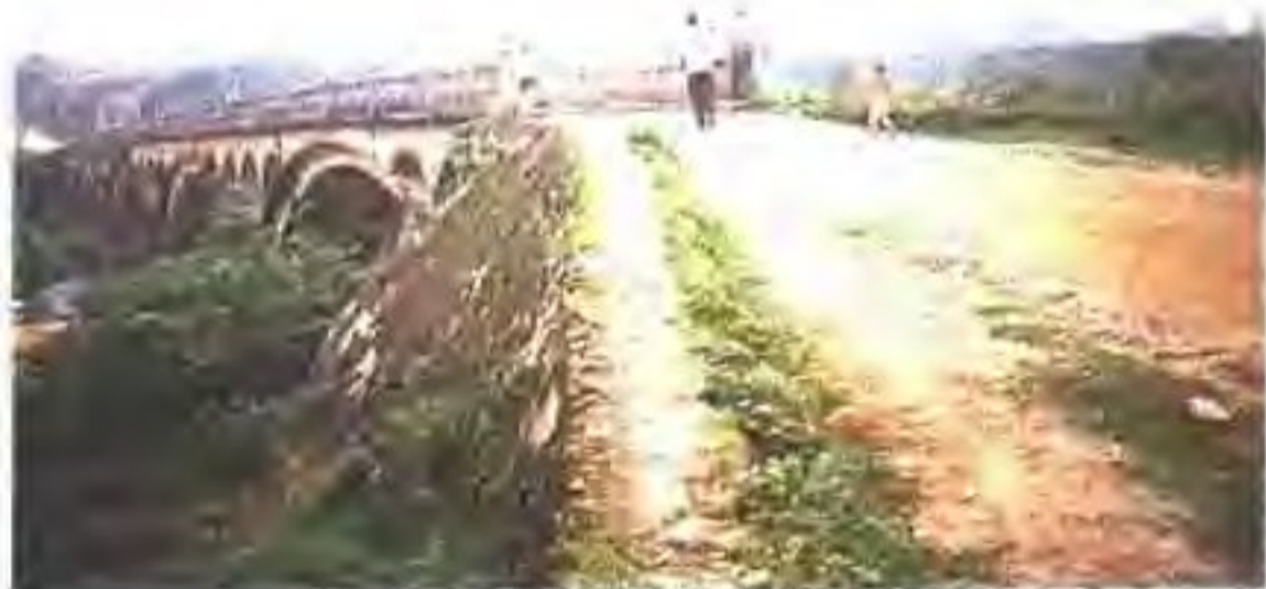
◀ 四会市威井瓦屋路桥旧貌