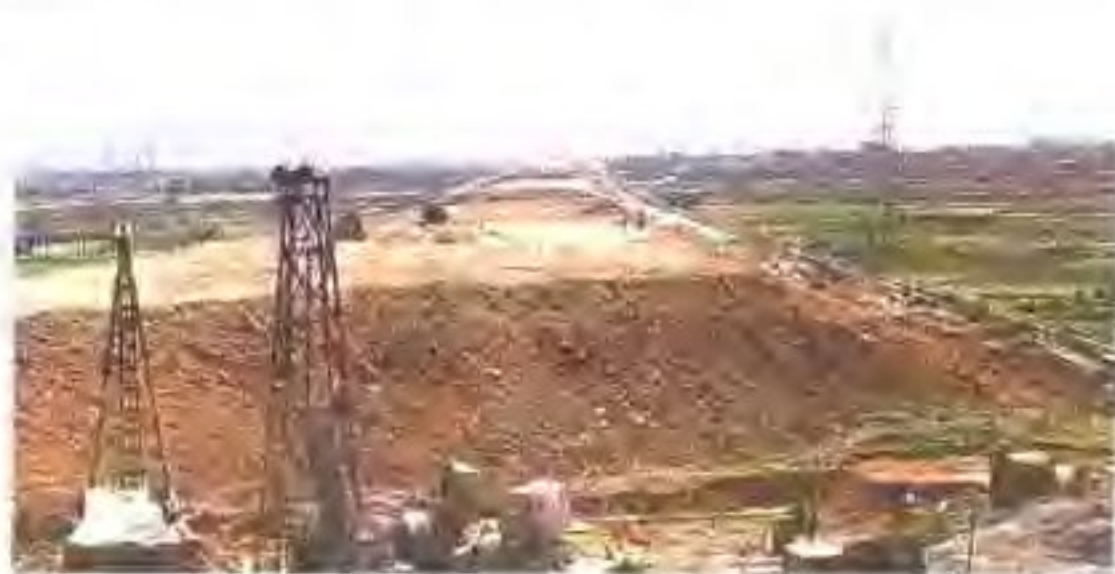
▶ 建设中的广肇高速公路