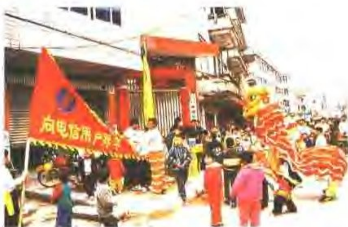
市电信局深入乡镇向用户拜年