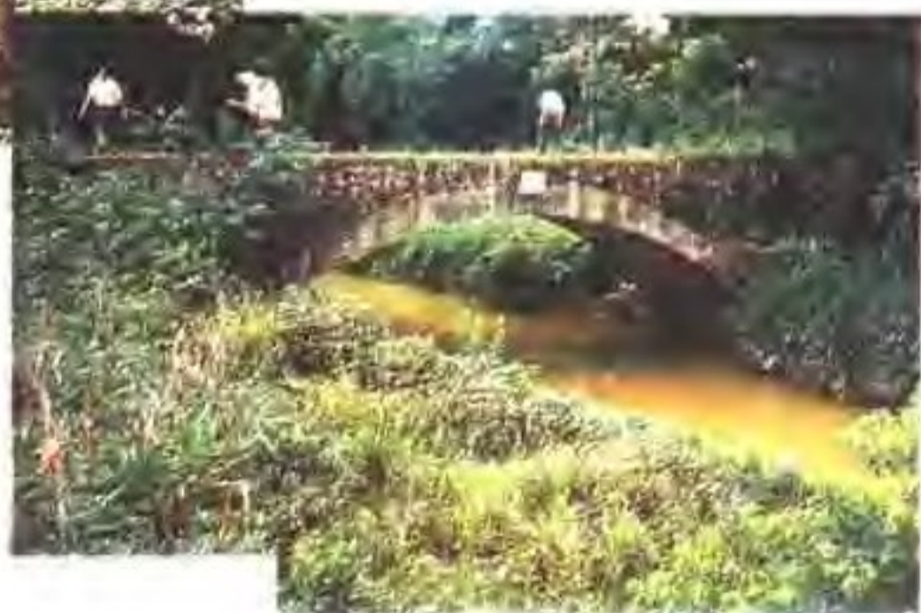
▶ 封开县古罗桥旧貌