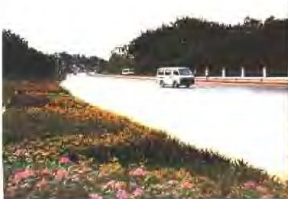
美化绿化肇庆公路