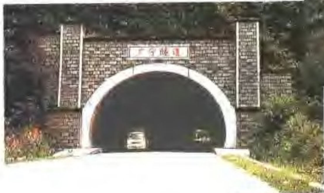
▼ 省道连大线公路隧道——广宁隧道