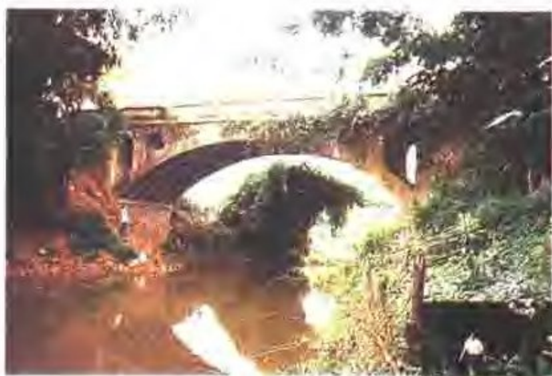
◀ 封开县赤聚桥旧貌