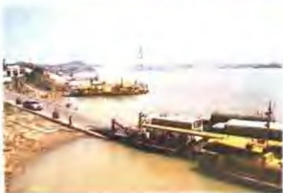
▲ 金利渡口旧貌