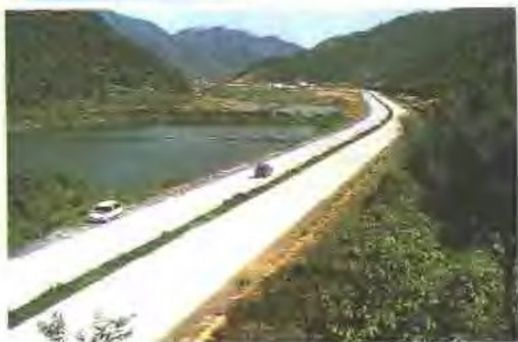
省道四莲线鼎湖路段