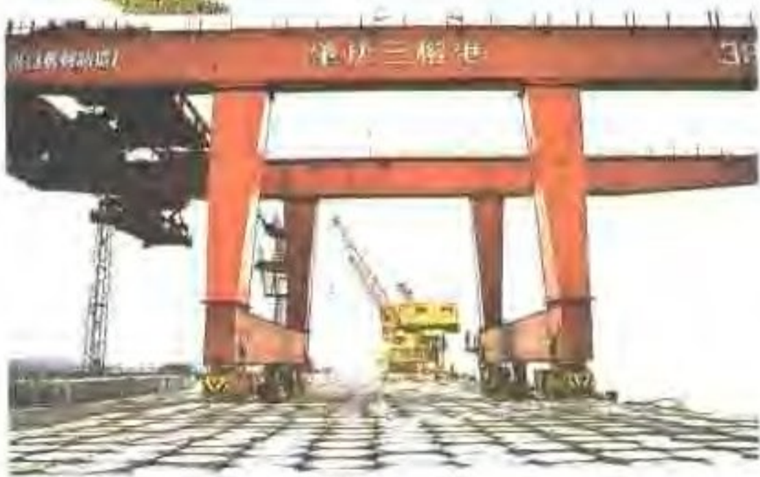
▶ 肇庆三榕港