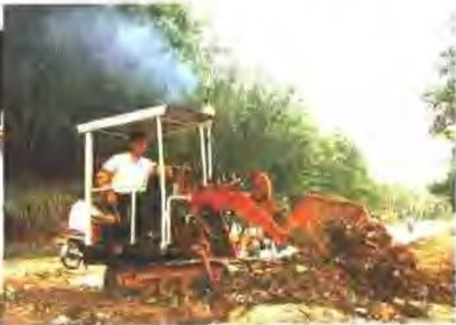
自制的小型铲车在清理路面淤泥