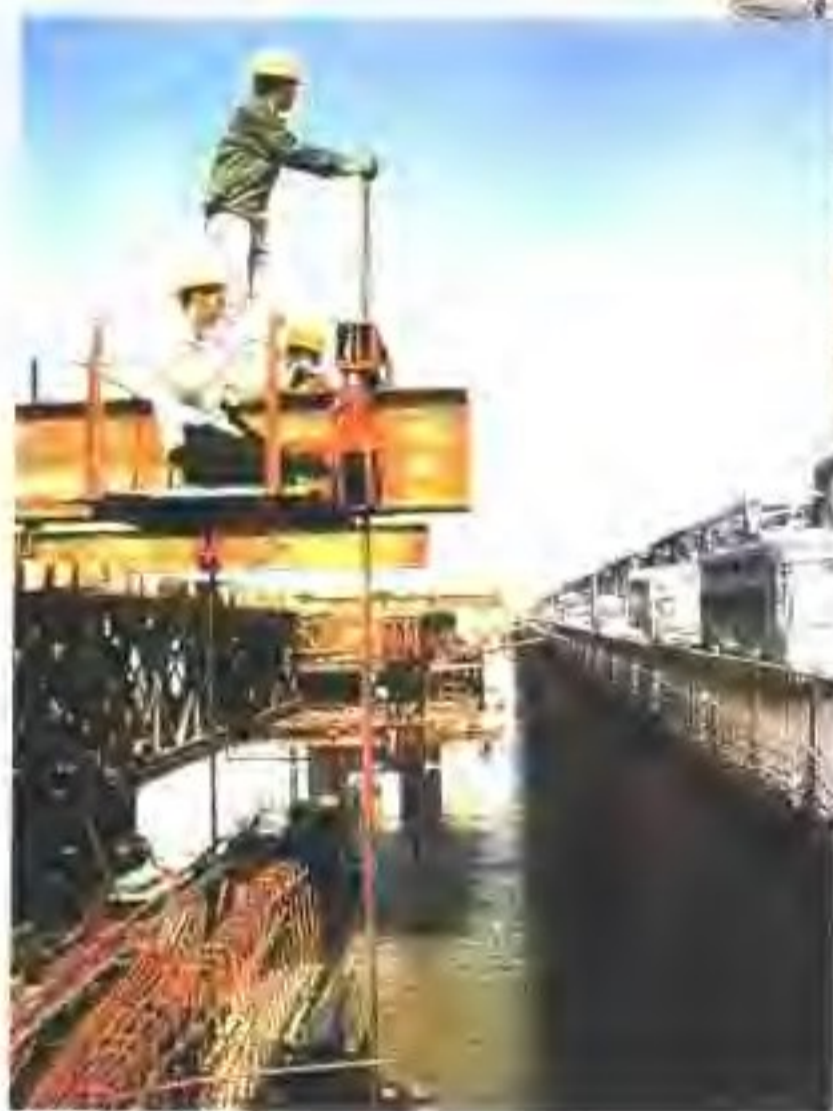
▲ 国道321星湖路段施工过程中