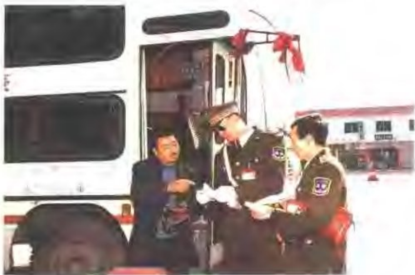
市交通局大冲稽查站检查321国道车辆的行驶