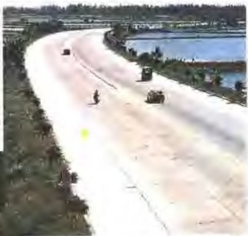
▲ 省道连大线四会路段