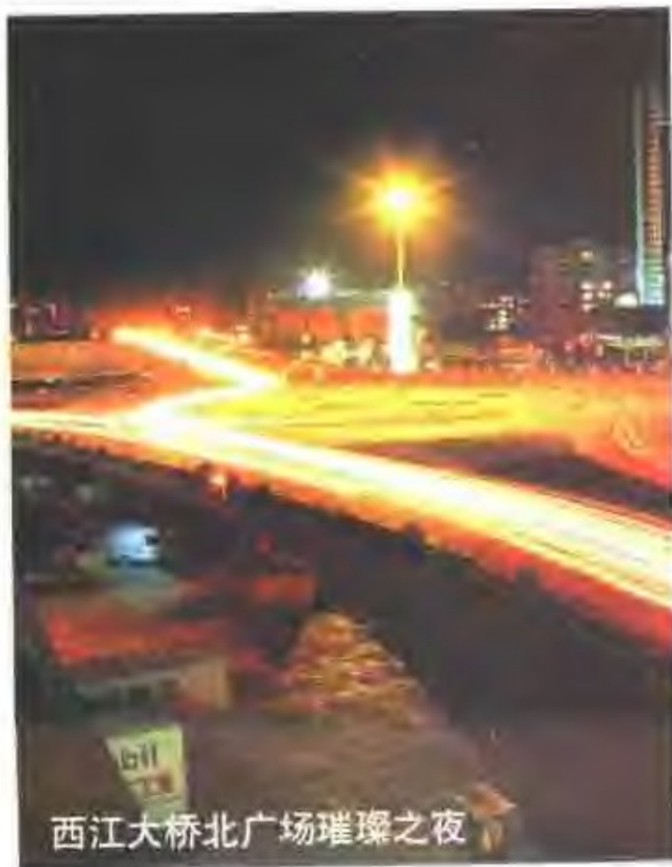
西江大桥北广场璀璨之夜