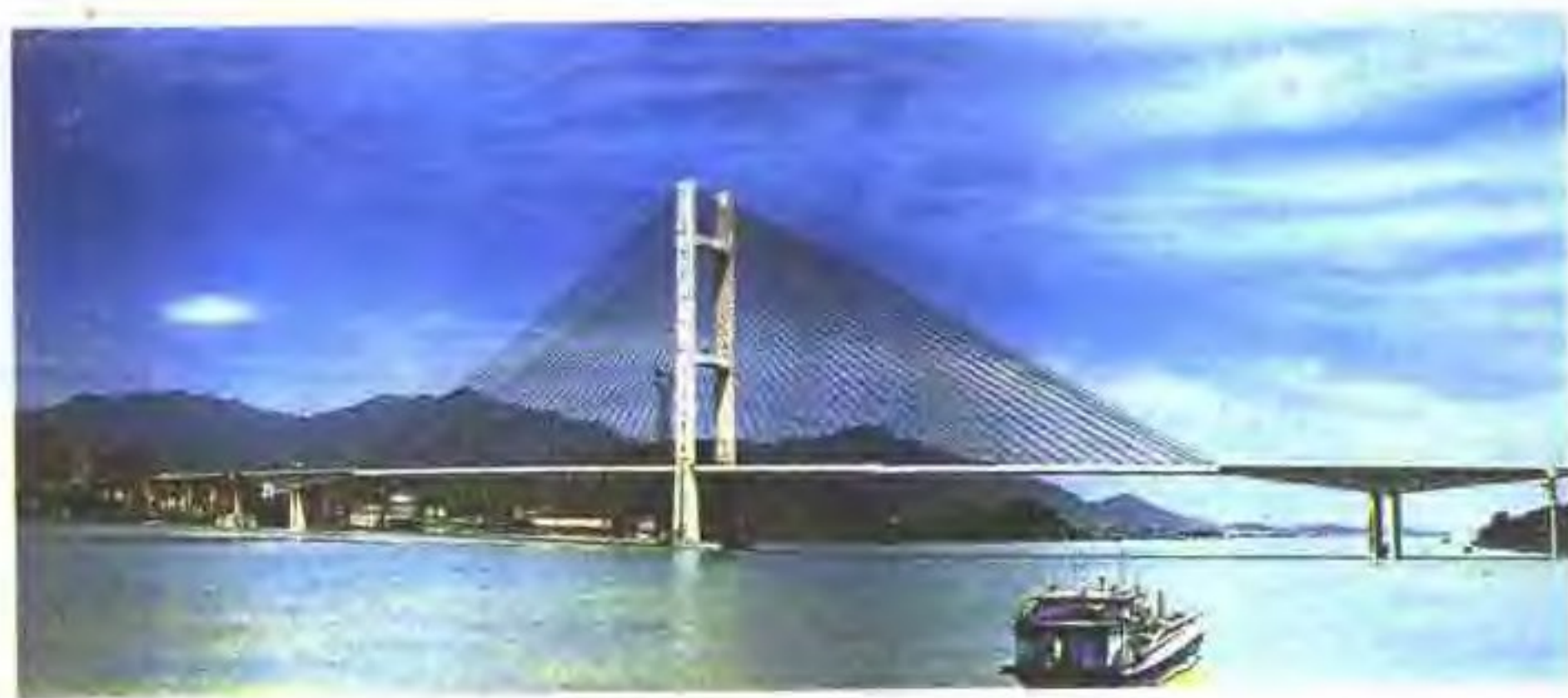
宏伟壮观的广肇高速公路金马大桥