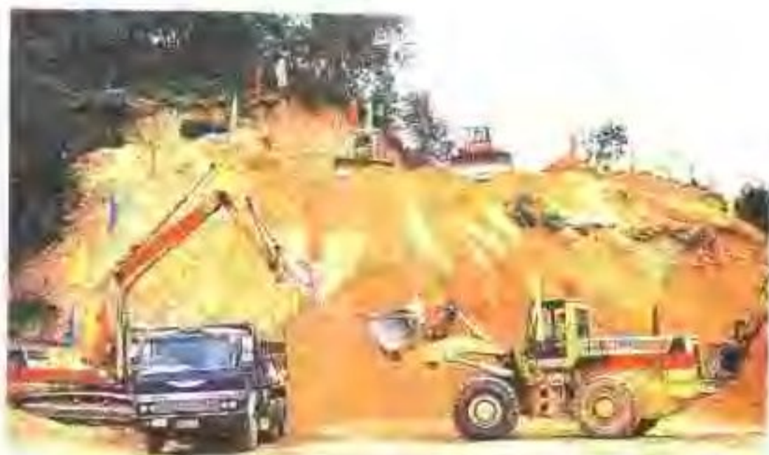
◀ 外引内联，省、市共同投资兴建的广肇高速公路肇庆路段正式动工