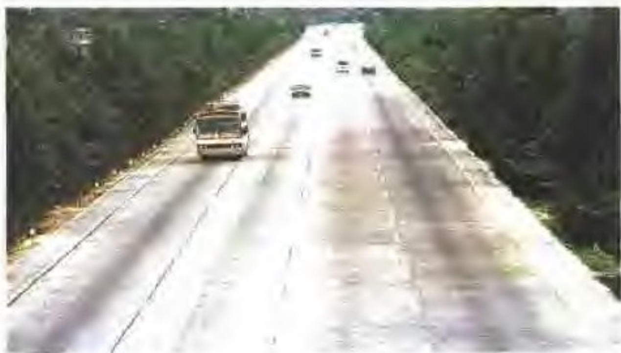
◀ 通过交通部验收的国道321线文明样板路德庆路段