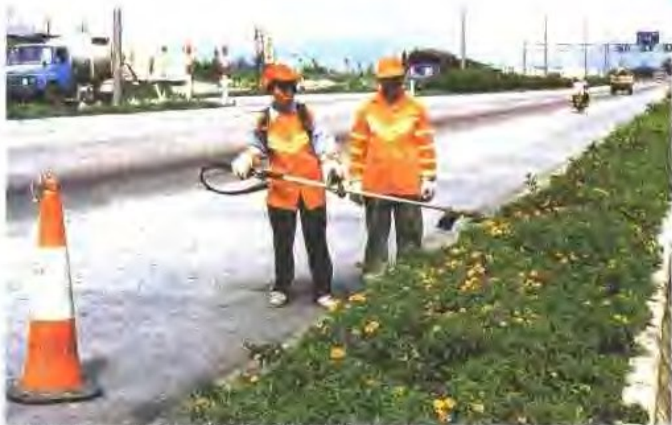
养护工人经常为道路“梳妆打扮”