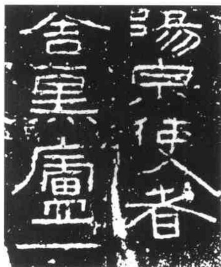
阳泉使者金熏炉铭