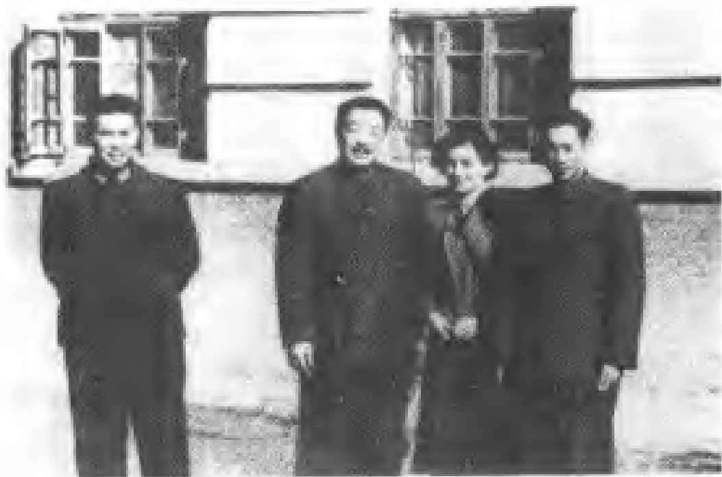
一九五八年，贺龙将军（左二）在张家口外语学院会见苏联友人考古学家伊万诺娃（左三）