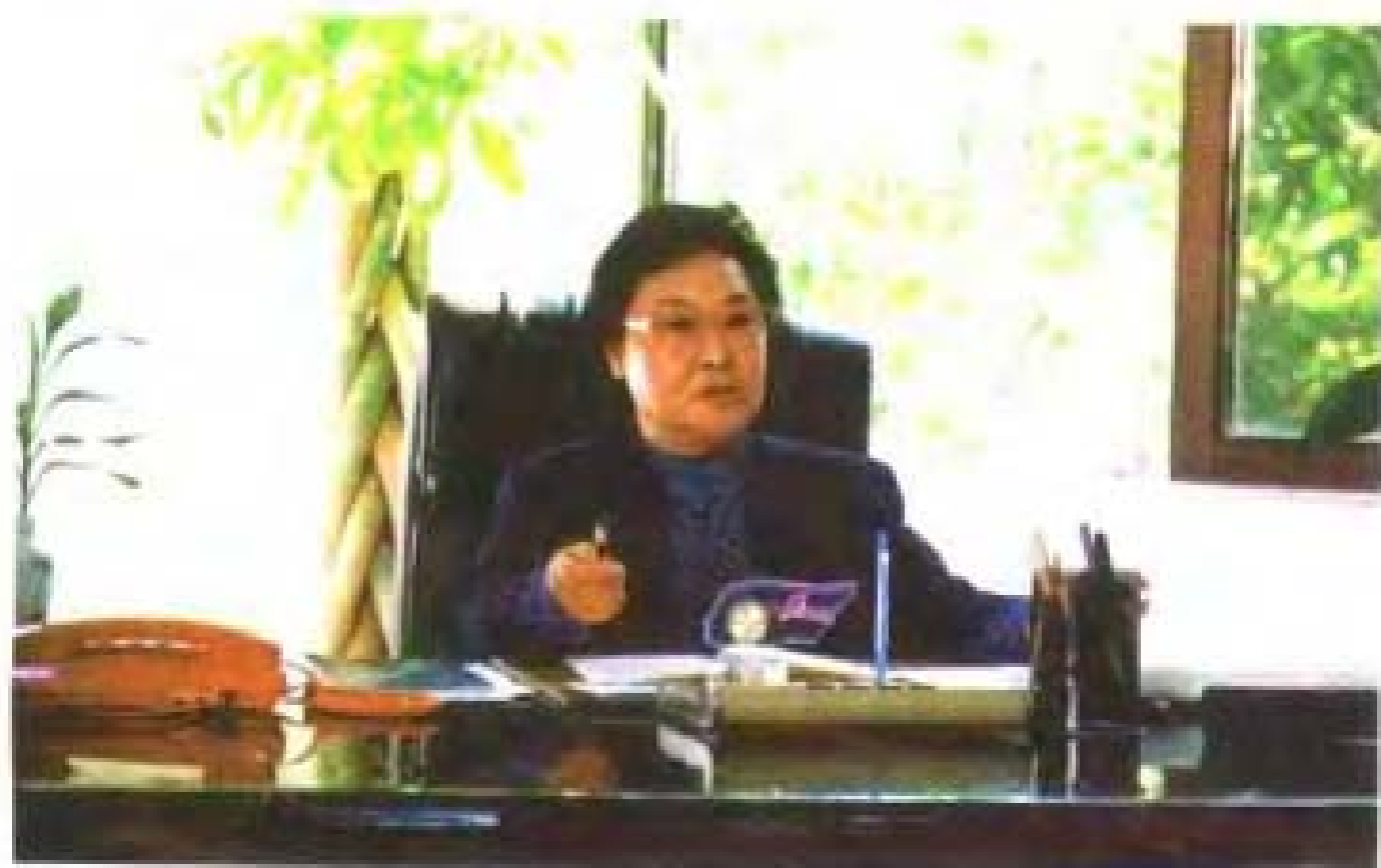
人民艺术家郭兰英在广东省佛山市顺德区文化艺术学校办公室留影。