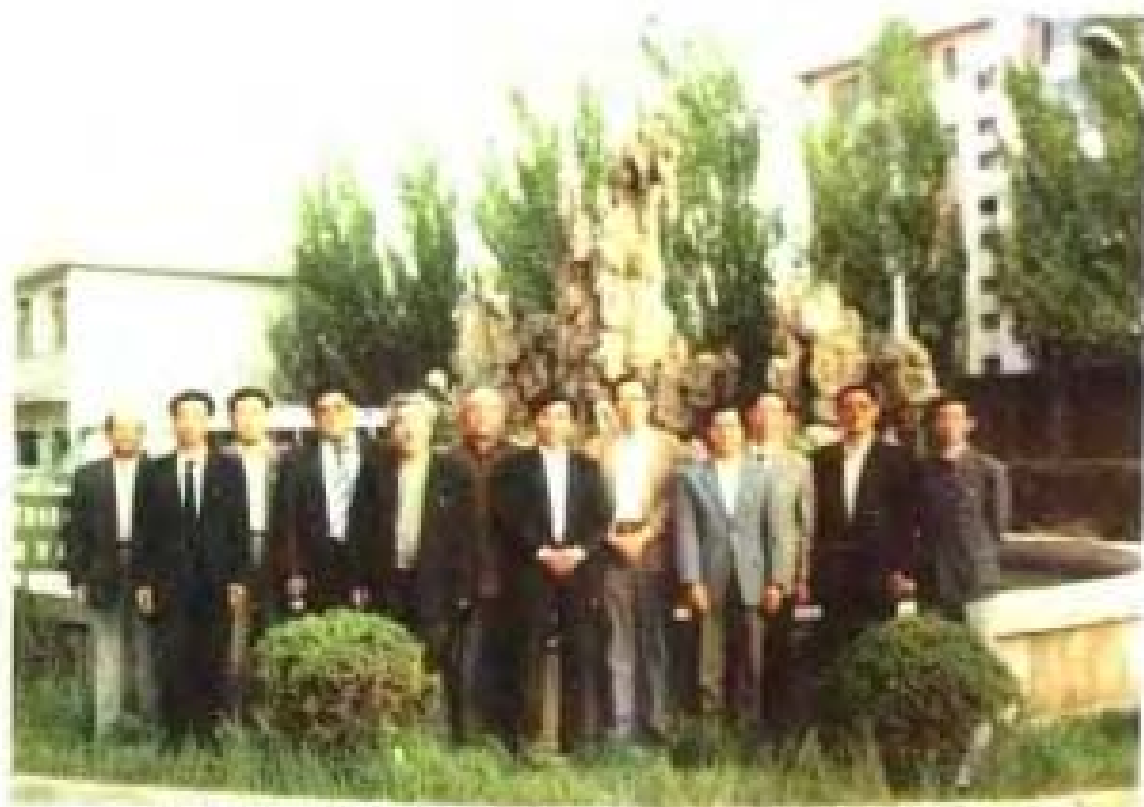
一九九三年五月二十二日，六届政协主席王蔚斌 与大家合影留念