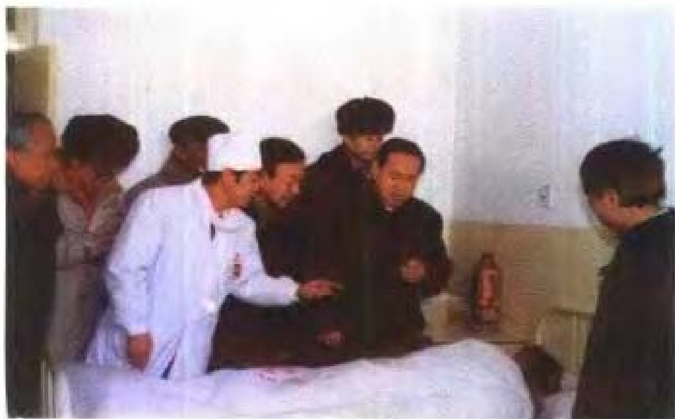
1998年1月，国务院副总理朱镕基亲临张北地震灾区看望受伤村民。