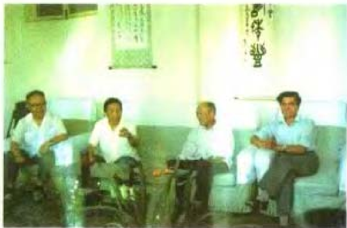
一九九零年七月，北京汪东兴、区原副司令员杨春 （左二）携军犬雄，赴杨成武副主席故居（左三）和 （左四）杨成武之子杨旭光（右二）与将军合影留念。