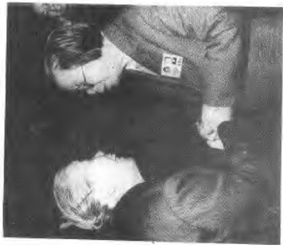
六屆全國政協主席郭穎超(右)祝賀李健生(左)當選全國政協常委。