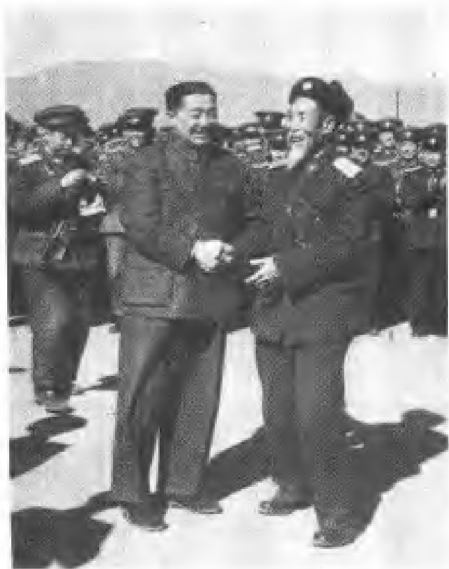
一九五八年四月，贺龙将军与受赠毛泽东主席嘉奖的陕甘宁边区劳动英雄、模范、解放军一五一医院副院长蒋雄平亲切握手 ——赵长海供稿