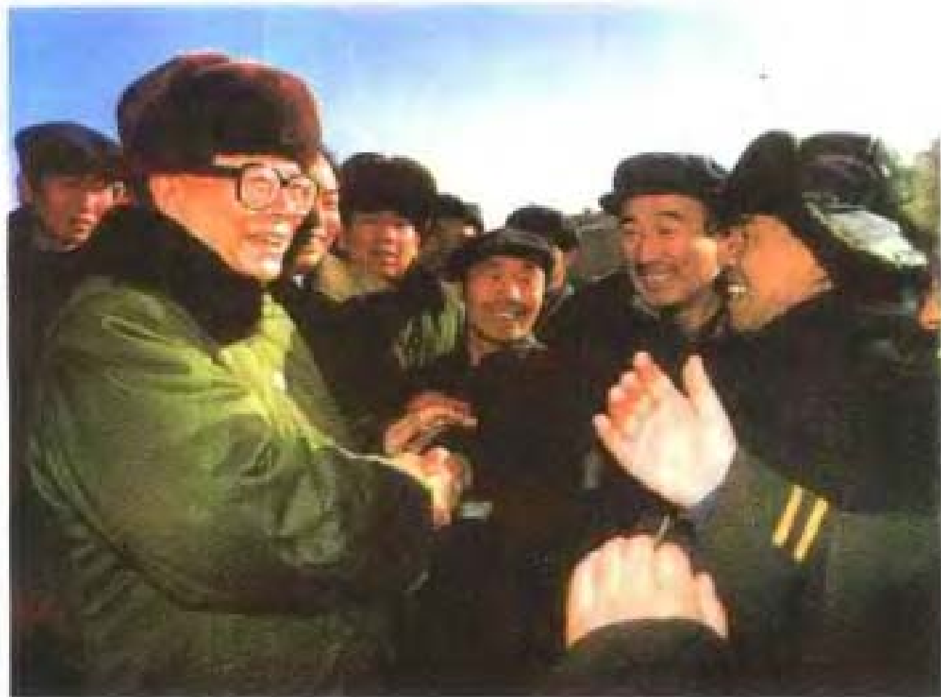
1995年11月24日，江泽民总书记视察湖北恩施省委干部培训中心时与村民亲切交流。