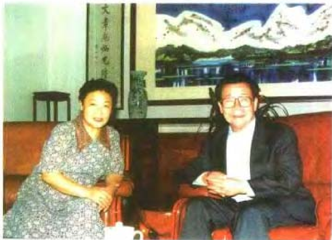
中共中央政治局常委、全国政协主席李瑞环在桂林与著名歌唱家郭兰英 开会，(左)是李瑞环，(右)是郭兰英。他们正在开会。