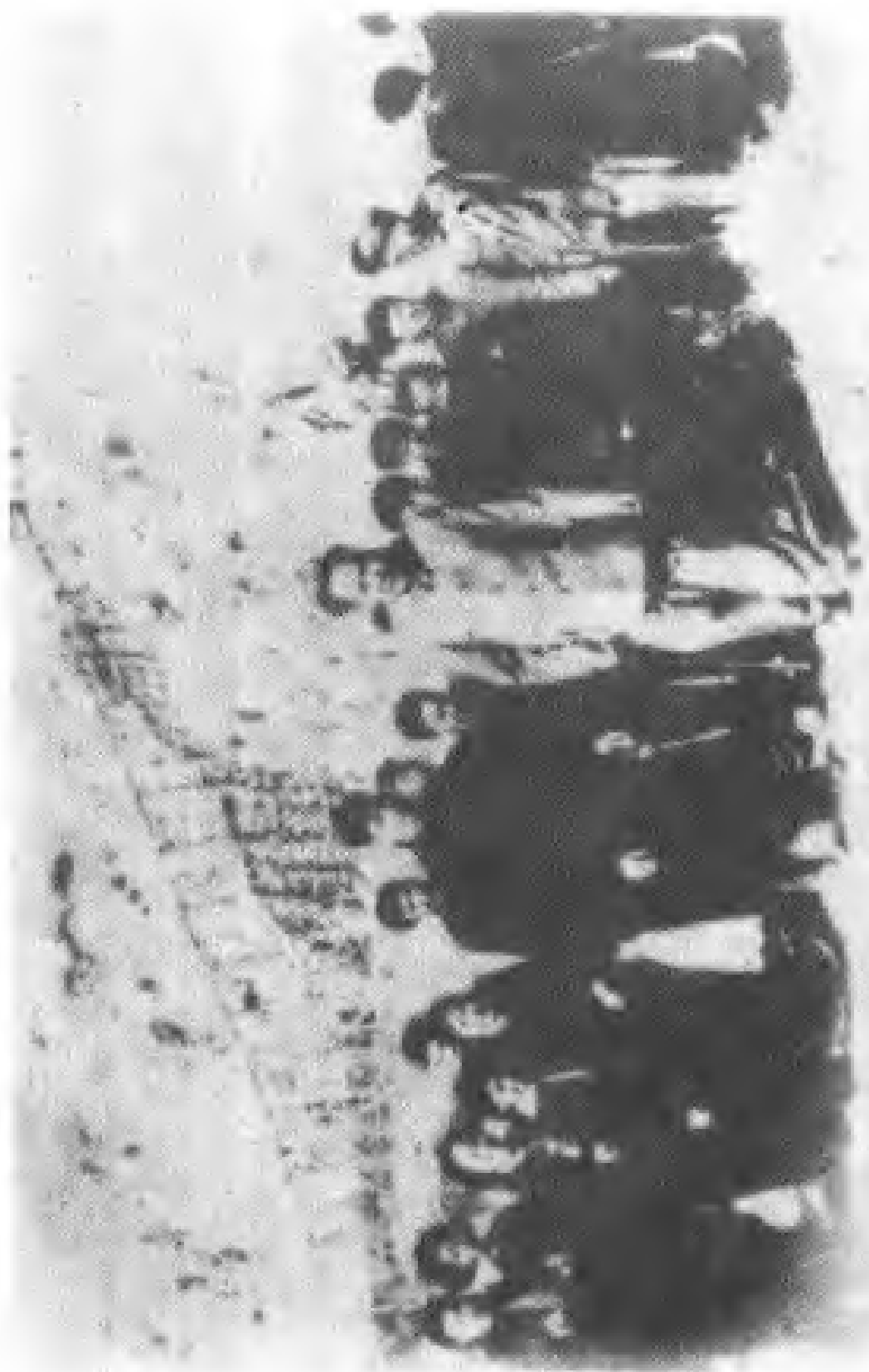
1954年4月12日，毛泽东主席视察官厅水库工程