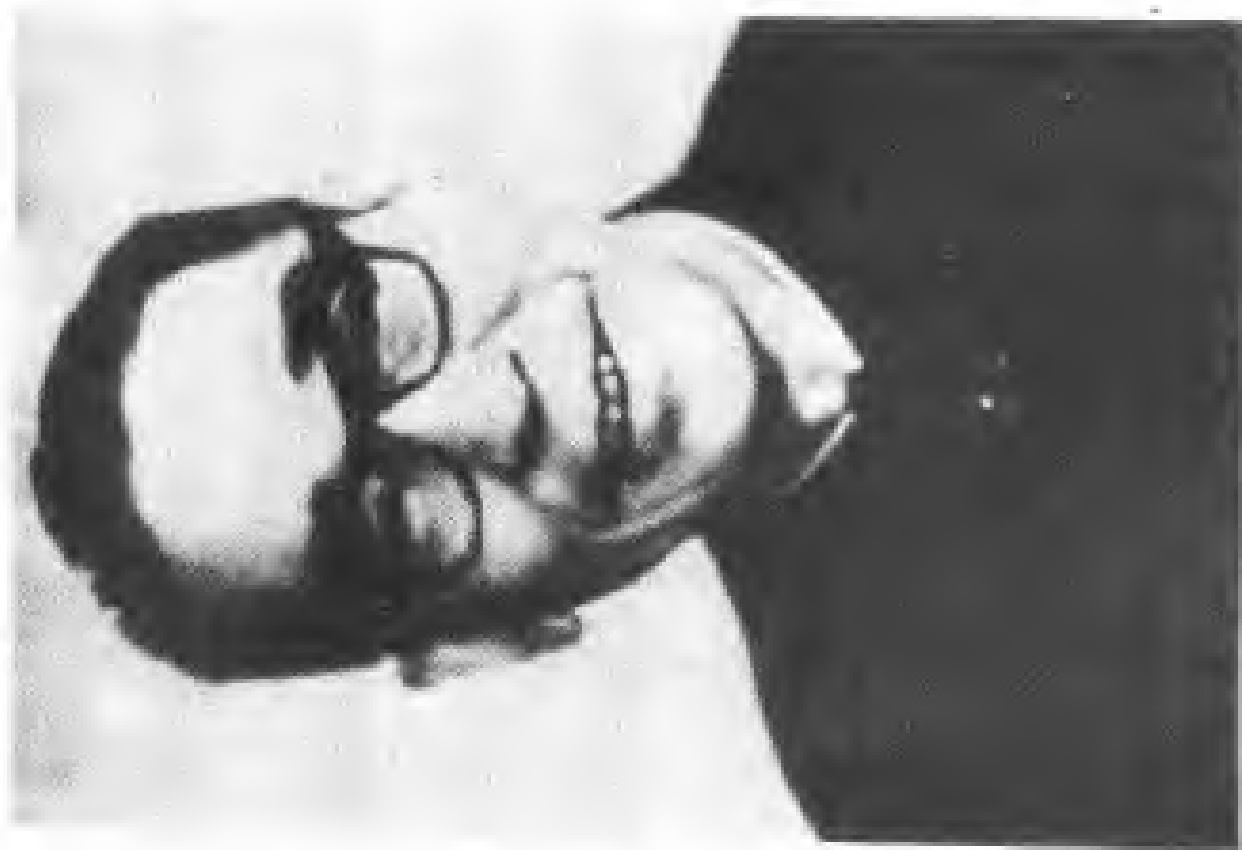
已故國務院副總理、无产阶级革命家董世恩(怀安人)遺像。