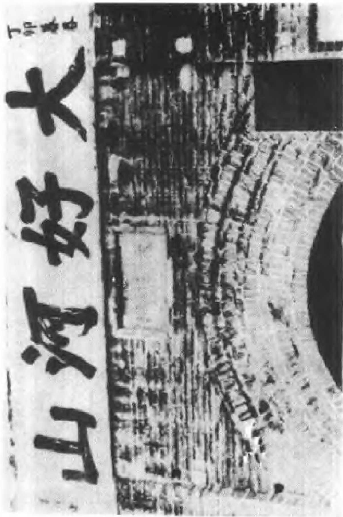
1940年前后的张家口市著名的历史文物“太境门”。“大好河山”四个楷体大字是1927年春夏之际，时任察哈尔特别行政区都统的高维岳题写，1966年所有题字被铲除，“大好河山”四字为1979年以后重塑。