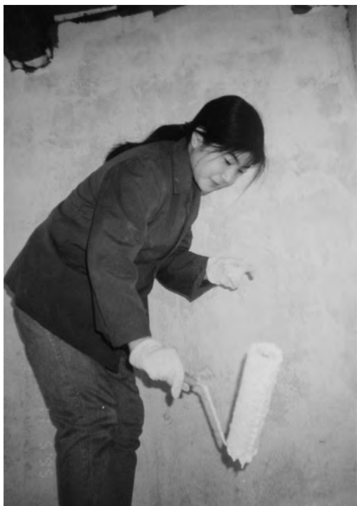
◎ 小魔女在粉刷墙壁

天我也很快乐。说起来，所谓‘我愿随你浪迹天涯’，很多女孩子都可以说，而到了实际上女孩子多喜稳定，漂泊万里，其中甘苦有几个女孩子能够承受呢？萨的情形，大学毕业以后换了七家公司，北京、新加坡、圣何塞、奥马哈、东京、大阪，一路如风吹落叶，雨打浮萍，萨苏始终感激小魔女和我风雨同舟，乐乐在一起，苦苦在一起，从无怨言，始终如一。