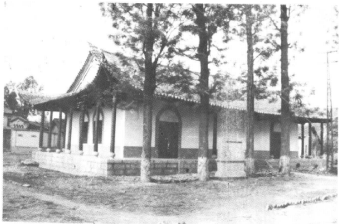
建国前蒙自海关旧址