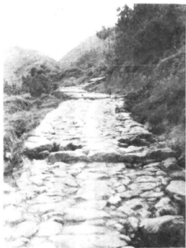
博南古道之一（大理至永平境内）