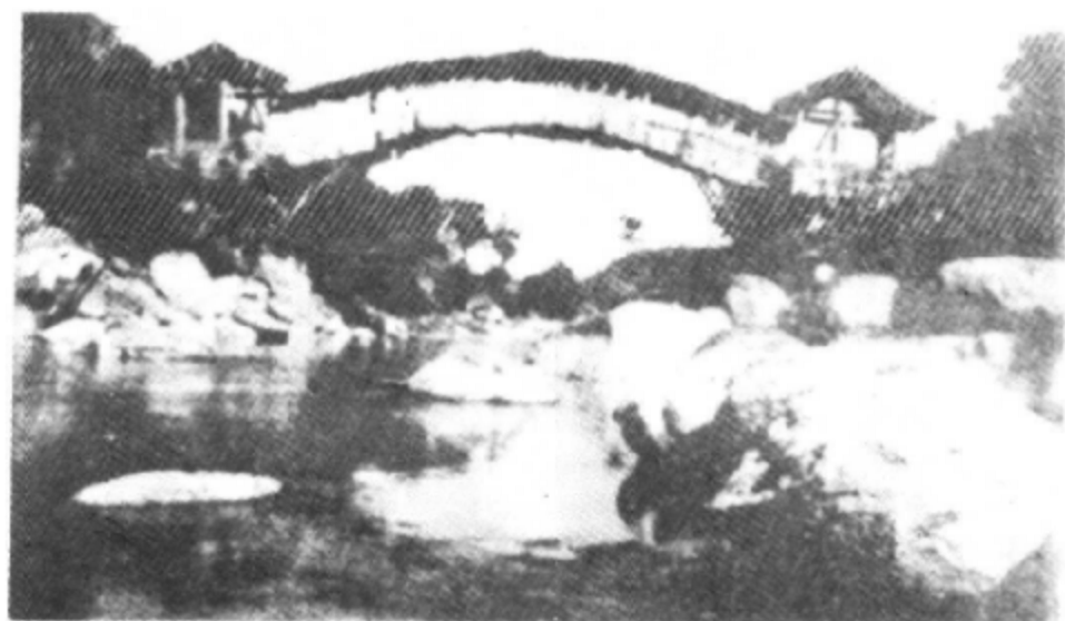
南方古丝绸之路腾冲曲石段野猪箐桥