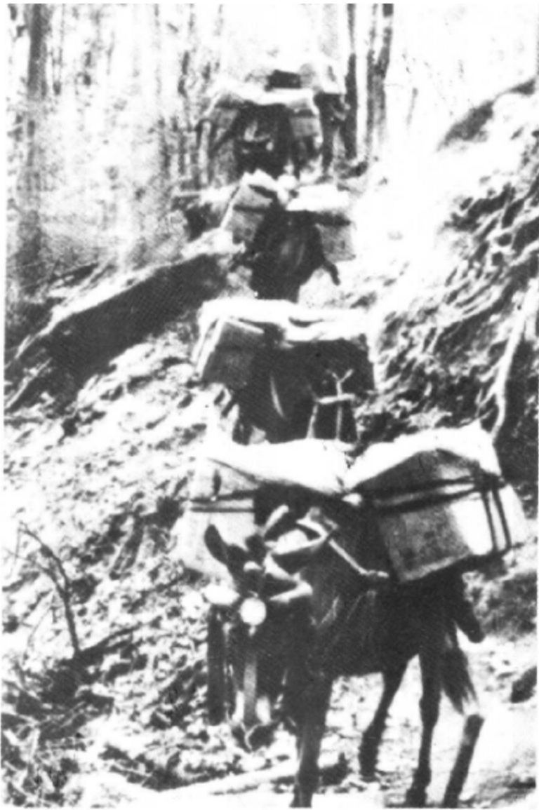
运输货物的马帮队