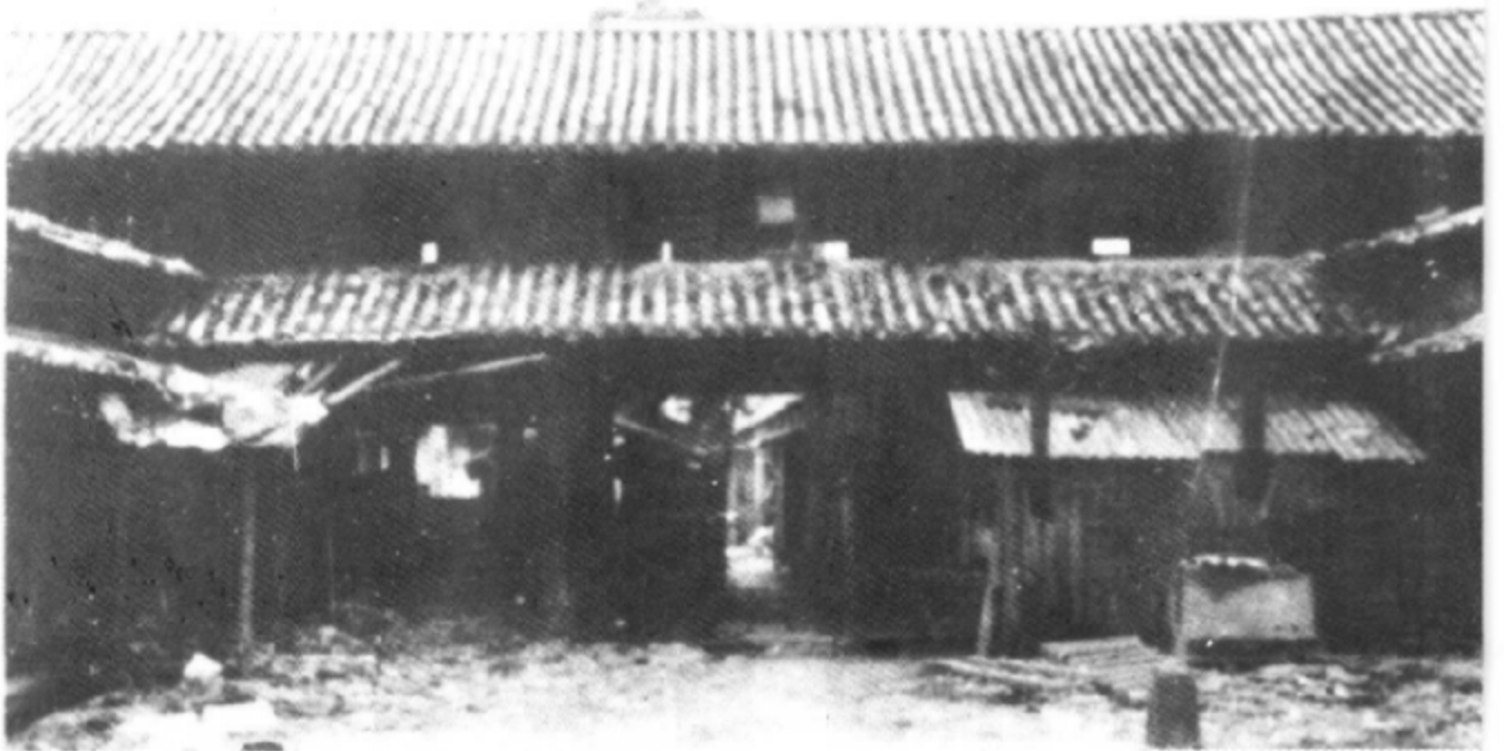
建国前思茅海关旧址