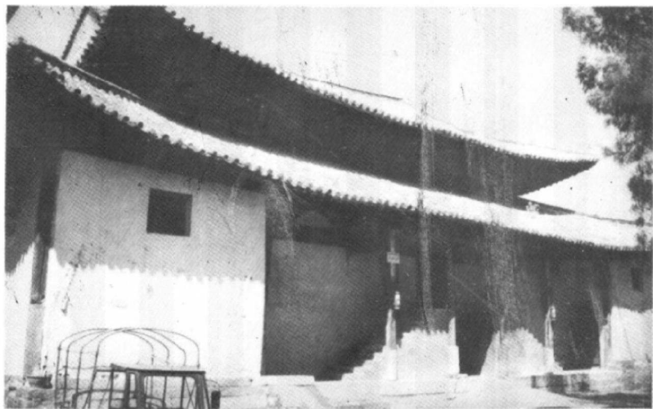
建国前建水商会旧址