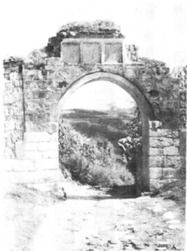
博南古道之一（大理至永平境内）