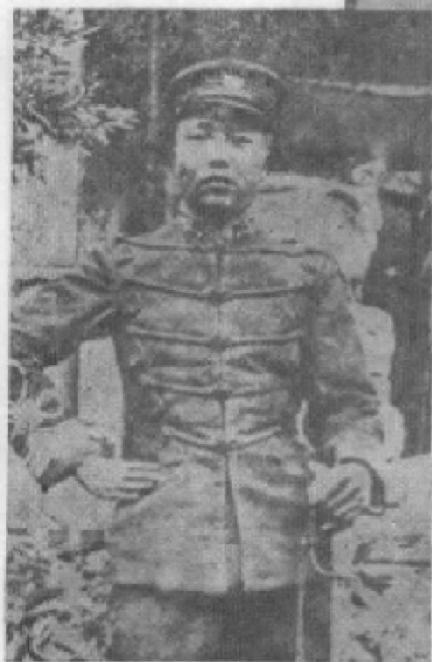
一九〇八年永昌起義領導人楊振鴻