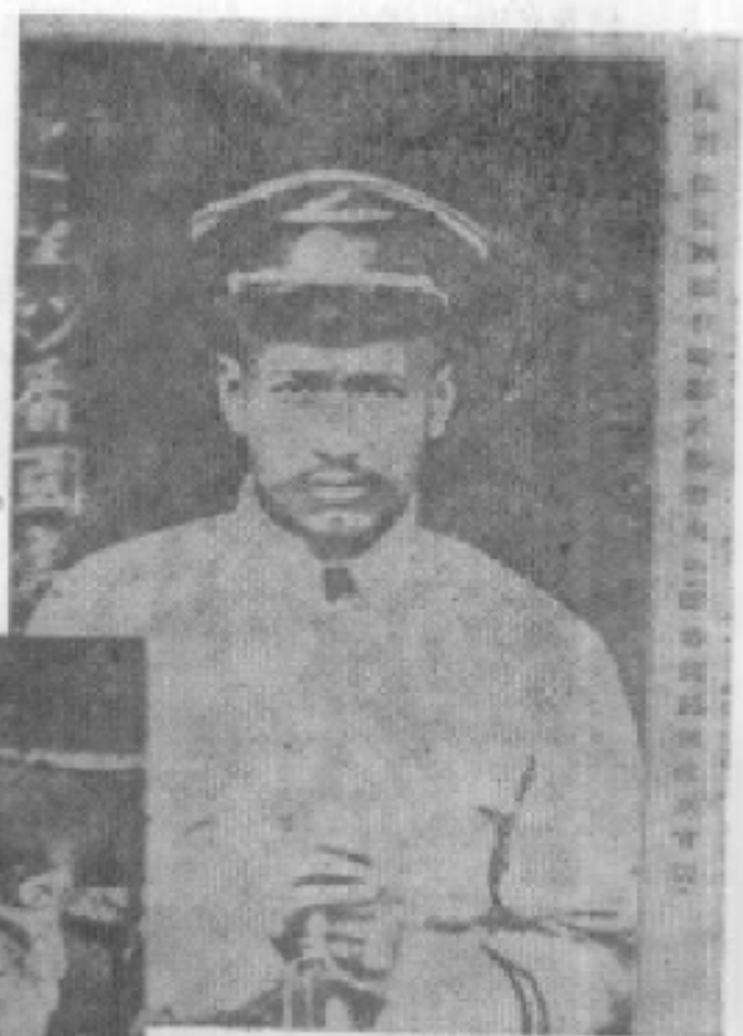
辛亥革命騰越起義 領導人張文光